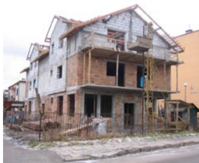
Nowy obiekt na Sadowej – na dole będą sklepy, a na górze mieszkania.

Jeżeli ktoś sądzi, że najmniej dzieje się na Posadzie, jest w błędzie. Tam jed-