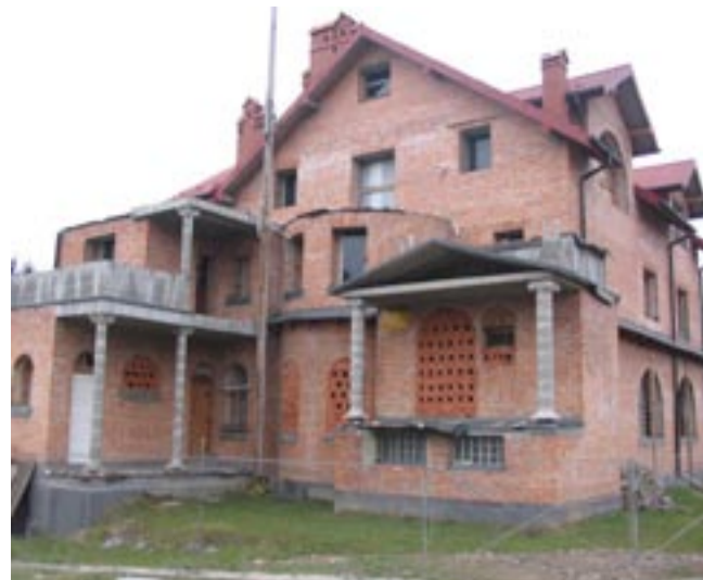
Pensjonat na ul. Białogórskiej może stać się konkurencją dla Hotelu „Bona”.

nak budownictwo ma nieco bardziej „medyczny” charakter. Na osiedlu Robotnicza powstają bowiem: przychodnia lekarzy rodzinnych oraz zakład dentystyczny. Kolejna przychodnia budowana jest także przy ul. 1000-lecia na Dąbrówce. Jeżeli już jesteśmy przy temacie obiektów wyższej użyteczności, wspomnieć należy w tym miejscu również o rozbudowie Miejskiej Biblioteki Publicznej oraz powstającym na Kiczurach budynku, w którym ponoć mieścić się będzie szkoła językowa.