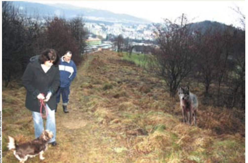
To zdjęcie, to oczywiście fotomontaż, ale nietrudno wyobrazić sobie taką sytuację. Jeszcze niedawno było tu mnóstwo wilczych śladów

Pozostało jeszcze sprawdzić, czy nie staliśmy się ofiarą jakiegoś żartownisia. Zdjęcie mogło przecież zostać zrobione w Nasicznem, Stuposianach