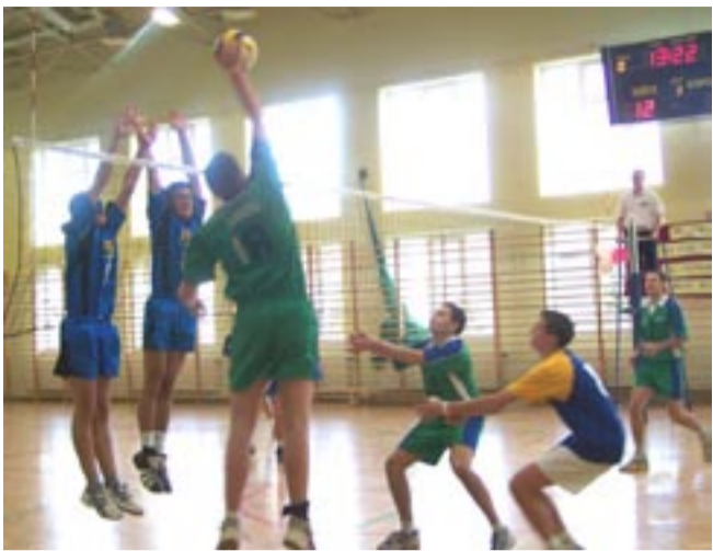
Siatkarze TSV są w dobrej formie. Jeżeli w jutrzejszym meczu będą mieli wsparcie kibiców, mogą pokonać lidera. Nawet 3:0!

Nasze drużyny siatkarskie rozegrały na wyjazdach zaległe mecze z 1 grudnia, przełożone z powodu śmierci Wojciecha Korneckiego. Zawodnicy TSV pokonali San Lesko, dziewczęta z Sanoczanki nie dały rady MOSiR-owi Jasło.