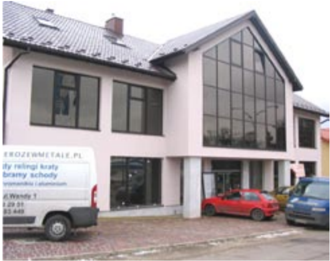
Nowy salon Media Market ma zostać otwarty 1 marca.

Sanok przeżywa budowlany boom, jakiego dawno nie było. Gdzie nie pojechać, tam szalują, murują, tynkują. Najwięcej przybywa domów jednorodzinnych, ale w oczy rzucają się przede wszystkim duże obiekty, powstające tuż przy głównych drogach. Co warto podkreślić, nie są to tylko kolejne punkty handlowo-usługowe, których mamy pod dostatkiem. Tak czy owak, miasto rośnie nam jak na drożdżach!