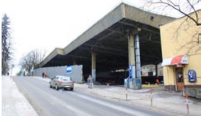
Zamiast pięknej galerii ciągle jeszcze mamy straszak, do niedawna nazywany sportowym skansenem z czasów PRL-u.

W obecnej sytuacji prawnej nie mogę postąpić inaczej, jak tylko