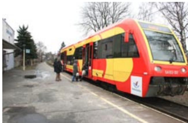
Pasażerów dziś nie kuszą, co widać na zdjęciu, nowoczesne autobusy szynowe, jeśli będą rozwijać szybkość 29 km/h jak ten na trasie Zagorz-Jasło.