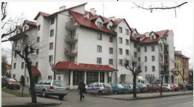
Mieszkańcy bloku przy ulicy Kościuszki 45 woleliby, aby na dolnych kondygnacjach powstały nowe mieszkania zamiast siedziby prokuratury.

– Policja, karetka więzienne, skuci kajdankami opryszkowicze – nie chcemy takich widoków – denerwuje się jeden z lokatorów. Zawsze istnieje niebezpieczeństwo, że jakiś bandzior ulotni się i będzie szukał schronienia w którymś z mieszkań.