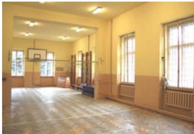
A tak wygląda sala gimnastyczna Gimnazjum nr 2, która służy 520 jego uczniom.

Warunkiem podpisania porozumienia w tej sprawie, byłoby ze strony Towarzystwa wycofanie z MSWiA wniosku o stwierdzenie nieważności decyzji Wojewody Krośnieńskiego z dnia 30 czerwca 1993 r. znak:GGG.III.7224-3/