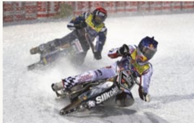
Już w ten weekend Sanok stanie się stolicą europejskiego ice speedwaya. Żuźła na lodzie to dyscyplina niezwykle widowiskowa. Nic dziwnego, że na to wielkie święto ściągną do Sanoka kibice z kilku krajów Europy.

Bilety – można jeszcze kupić w kasach przed zawodami: Piątek (Ice Racing Sanok Cup): normalny – 15 zł, ulgowy – 5 zł.