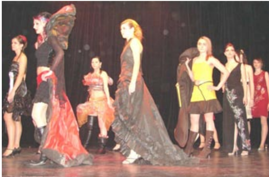
Folia, otulina, pianka poliuretanowa – nawet tak nietypowe materiały mogą służyć za tworzywo projektantom mody. Udowodniła to autorska kolekcja uczennic ZS nr 5, którą nagrodzono rzesiastymi brawami

Równie ciekawe okazały się zmagania adeptów sztuki fryzjerskiej przebiegające pod hasłem „Przyroda źródłem inspiracji kolorystycznych”. W konkursowych szrankach stanęli nie tylko najlepsi uczniowie ZS nr 5, ale i zaprzyjaźnionych szkół słowackich ze Svidnika, Preszowa i Medzilaborec. Stworzone przez nich na tzw.