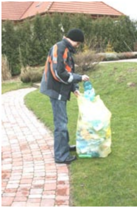
Segregacja też kosztuje i to немало. „Nagrodą” nie są znacząco niższe opłaty, tylko czyste środowisko...