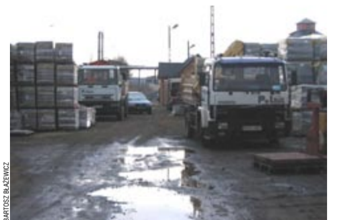
W składach materiałów budowlanych czuć wiosnę, ruch coraz większy. Wybierając się na zakupy, warto wcześniej sprawdzić oferowane ceny.

Zbadaliśmy jeszcze ceny styropianu i płyt regipsowych. Najwyższą cenę na sanockim rynku styropian osiągnął w TRANS BUD-zie i SAN BUD-zie (po 145 zł za kubik), taniej, bo 140 zł chciał skład ABP na Lipińskiego, przy wyjeździe z miasta, zaś