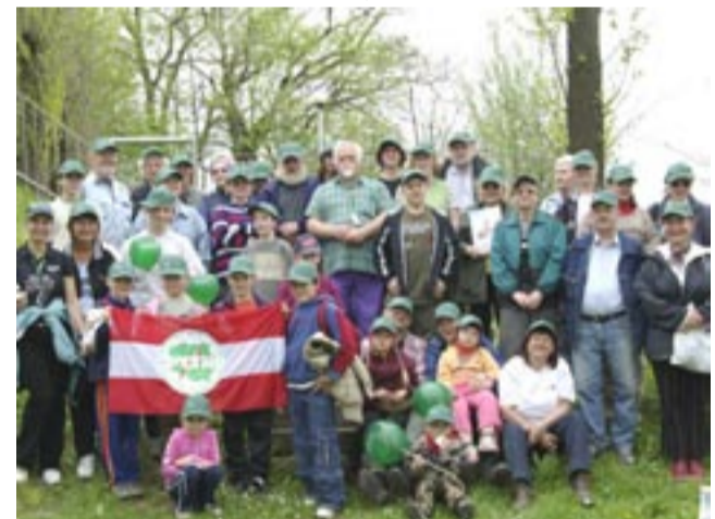
Mimo że pogoda nie rozpieszczała zanadto wędrowców, humoru i pogody ducha nikomu nie brakowało.

Już po raz 18. Koło Terenowe nr 1 przy sanockim Oddziale PTTK Ziemia Sanocka zaprosiło sanoczan na Rajd Rodzinny, upamiętniając w ten sposób 217 rocznicę Konstytucji 3 Maja. Mająca swoich sympatyków i stałych bywalców rekreacyjna impreza i tym razem okazała się nader udana.