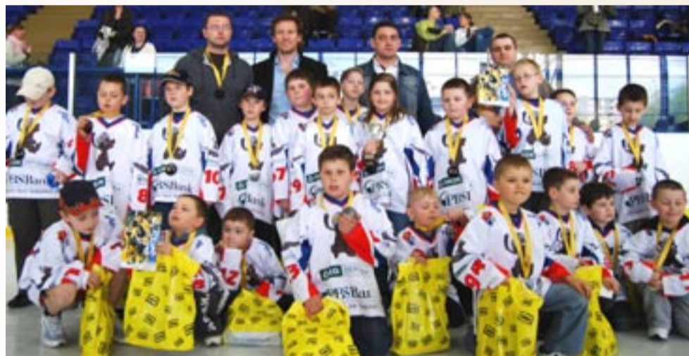
Rodzinne pamiątkowe zdjęcie „Niedźwiadków” z Mariuszem Czerkawskim podczas Turnieju Polsat Sport w Warszawie.

czas turnieju. To właśnie on spowodował, że zawodników odwiedził w szatni sam Mariusz Czerkawski, znajdując czas na rozmowę o ich ulubionej dyscyplinie sportu. Nasza młodzież idealnie wykorzystata