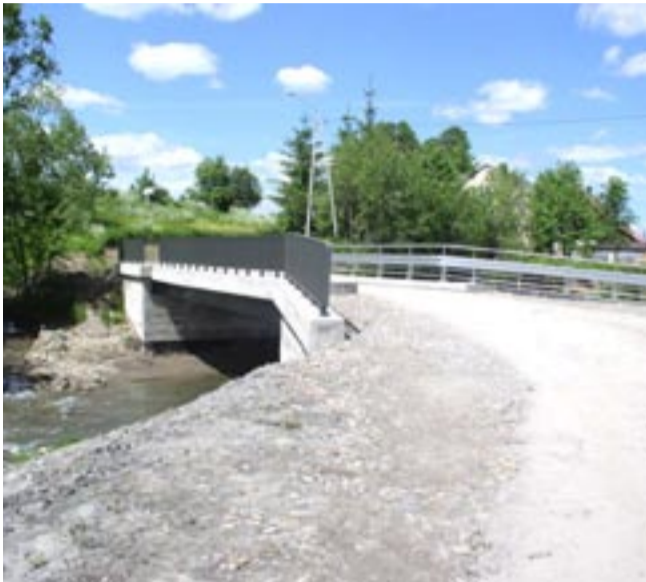
Most w Łukowem to samowolka wybudowana w dobrej wierze, która służy lokalnej społeczności.

wierze, nowy most powstał i służy ludziom, jednak za formalne uchybienie Urząd Miasta i Gminy Zagórz musi zapłacić karę w wysokości 125 tys. zł. – Będziemy odwoływać się od tej decyzji, lub przynajmniej jej zmniejszenie. W tej sprawie spotkałem się nawet z mieszkańcami Łukowego, którzy zło-