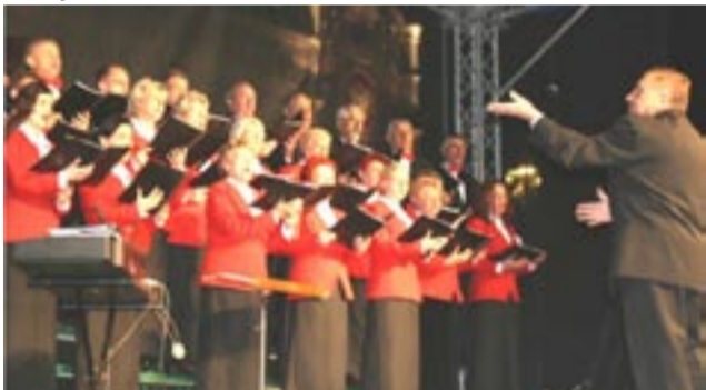
Profesjonalni, elegancy, ekspresyjni – Chór św. Cecylii w pełnej krasie.