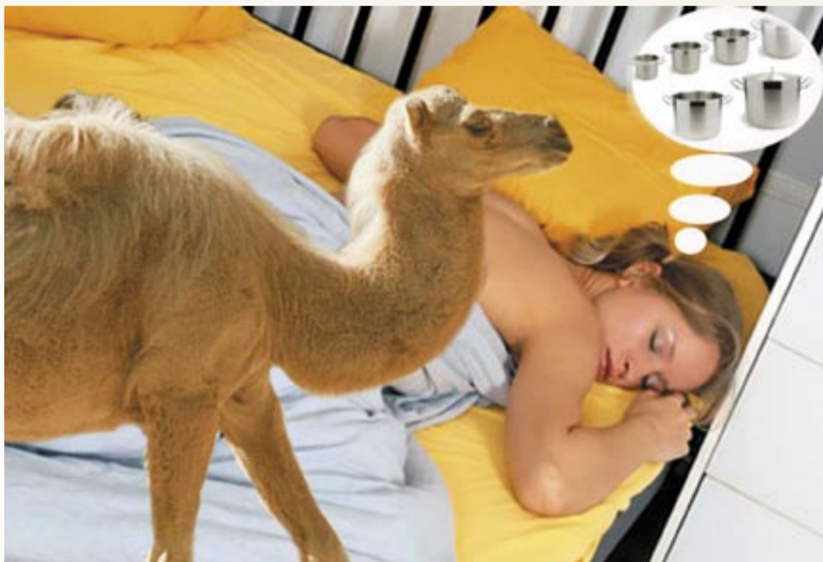
Jak niewiele potrzeba czasem do szczęścia... Psychoanalitycy twierdzą, że poczucie błogostanu we śnie daje pozytywne nastawienie do świata. Ale to samo marzenie śnione na jawie – już wcale niekoniecznie...