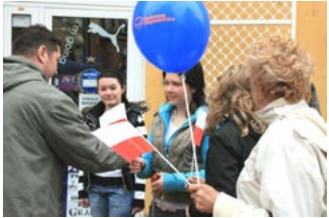
Sanoczanie z uśmiechem przyjmowali biało-czerwone chorągiewki od członków sanockiej PO.

Święto flagi narodowej przypadające na dzień 2 maja, a ustanowione w 2004 roku, miało w tym roku ciekawą oprawę. Po raz pierwszy odbyło się na odremontowanym Rynku, w asyście kilkudziesięciu motocyklistów uczestniczących w zlocie miłośników „Hondy”. Porównywalne grono stanowili mieszkańcy Sanoka.