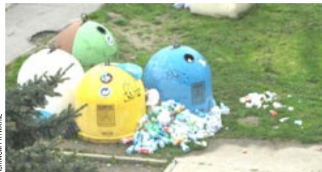
Pojemniki na plastikowe butelki powinny stać w wielu punktach miasta oraz być ogólnodostępne i często wywożone. Inna sprawa to kultura, z czym nie jest u nas najlepiej...