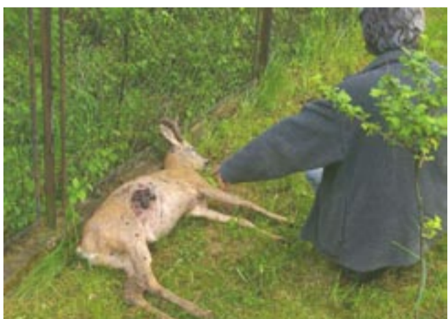
To już druga upolowana sarna, znaleziona na prywatnej posesji w rejonie ulicy Zaplskiej.

Mieszkańcy Okołowiczówki są poruszeni. We wtorek na terenie jednej z posesji znaleziono martwą sarnę. Właściciele i sąsiedzi, którzy systematycznie widują pod swoimi domami wilka, są przekonani, że to kolejna ofiara drapieżnika.