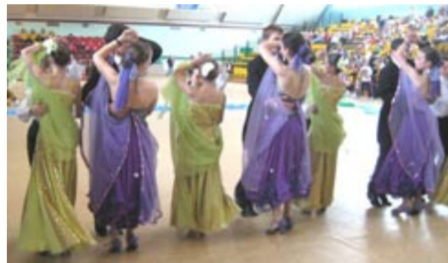
Czy pamiętasz, jak ze mną tańczyłeś walca?