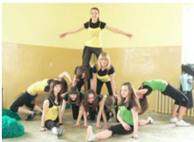
Układy akrobatyczne w wykonaniu młodych dziewcząt najbardziej przypadły do gustu widowni.

Ciężka praca nie poszła na marne. Licznie zgromadzeni skazani nagradzali gromkimi brawami ekwilibrystyczne popisy chłopców, wykonywane w rytm przebojów muzyki break dance. Atmosferę podgrzało wkroczenie na scenę uroczych czirlierek. Dziewczęta wykonały kilka tańców, z których najbardziej do gustu widzów przypadł ten, który