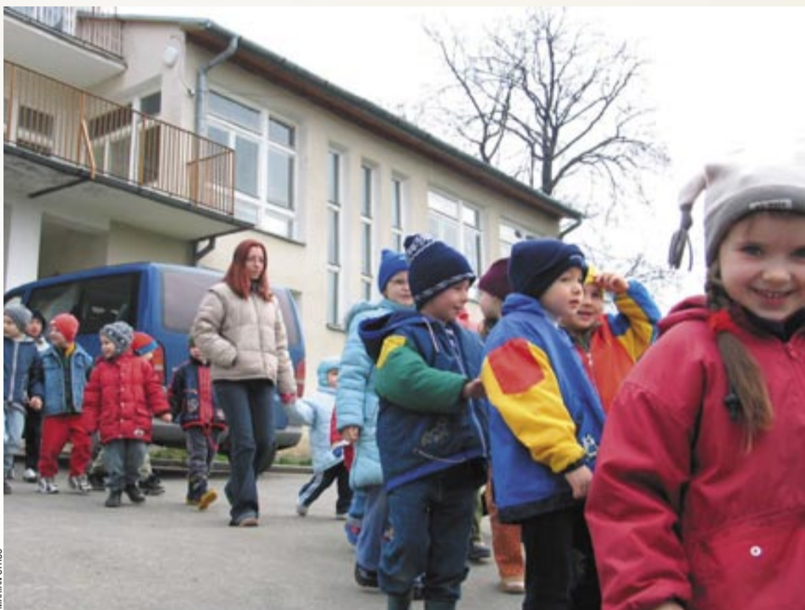
W niedalekiej przeszłości o przedszkole w Pakoszówce też trwały długie boje. Dziś nie jest to już placówka gminna, co – w świetle problemów u sąsiadów – wyszło jej chyba na dobre.