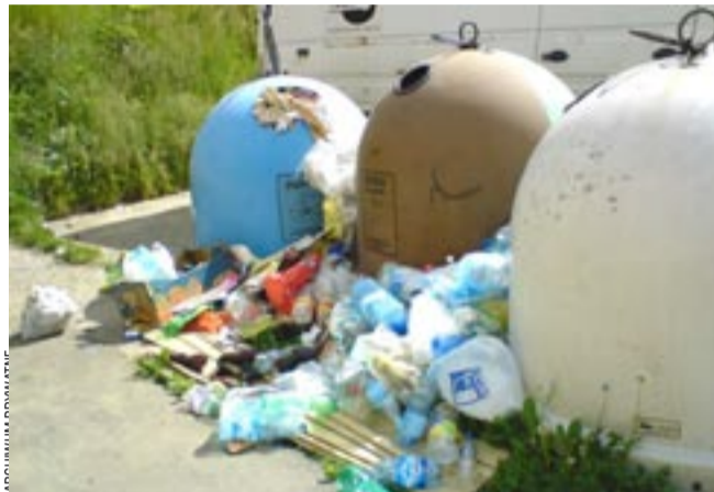
Codzienny obrazek osiedla w centrum miasta. Do niedawna razili tylko oczy. Teraz doszła obawa, że pojawią się tu szczury.

ci korzystają okoliczne sklepy mieszczące się przy ul. Jagiellońskiej, między innymi sklep „Centrum”. – Wystarczy jedna dostawa zużytych opakowań, aby po brzozi załadować nasze kontenery – wyjaśniają mieszkańcy Wąskiej. Ich zdaniem, temat naprawdę dojrzał do tego, aby poważnie się nim zająć. Bo następny krok to już chyba tylko deratyzacja. emes