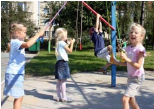
Dzieci z Sanoka nie muszą obawiać się, że któregoś dnia ich ukochana placówka zostanie zamknięta na cztery spusty. Przedszkola, po okresie zamykania i likwidacji, znów przeżywają swój rozkwit.