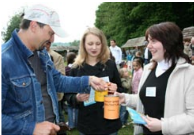
Czego się nie robi dla pięknych pań i szczytnej idei?

Znakomicie udał się Franciszkański Piknik Rodzinny, zorganizowany w ostatnią niedzielę. Mimo nie najlepszej pogody przez skansen przewinęło się 3-4 tys. osób. Wszyscy świetnie się bawili, a przy okazji udało się zebrać prawie 3,5 tys. zł oraz 1000 dolarów kanadyjskich na wsparcie Ośrodka Rehabilitacji dla Dzieci i Młodzieży Niepełnosprawnej przy Klasztorze Franciszkanów. Słowem działały się same dobre rzeczy.