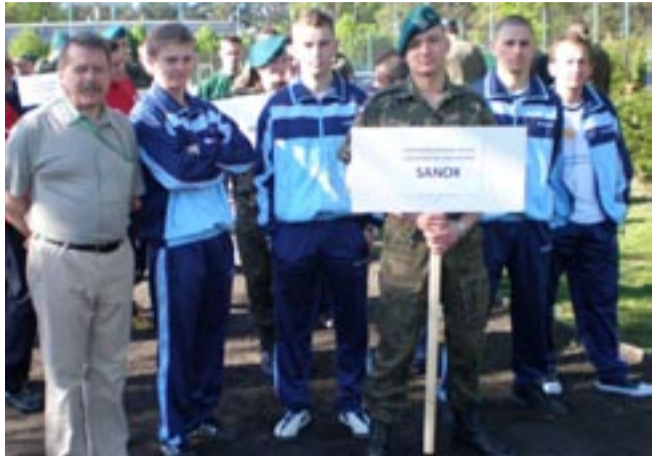
Zmęczeni, ale szczęśliwi – i nie bez powodu: 8. miejsce w kraju to w końcu nie było co...

Ekipa sanockiej PWSZ wzięła udział w V Ogólnopolskich Zawodach Sprawnościowo-Obrońnych Młodzieży Akademickiej „Military Żak”. Nasi reprezentanci nie zawiedli – w mocnej konkurencji 19 drużyn, wśród których nie brakło uczelni sportowych, zajęli dobre 8. miejsce.