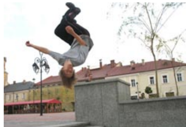
Patrząc na ekstremalne popisy chłopaków, niemal automatycznie nasuwa się myśl, że część dotacji powinny przeznaczyć na ubezpieczenia...

pana Mirka będziemy trenować raz w tygodniu w II Liceum Ogólnokształcącym. Ostatnio występowaliśmy m.in. na turnieju Belfer i Juwenaliach, ale trzeba szlifować formę, bo już wkrótce wybieramy się na zlot podobnych nam zapaleńców do Opola. A potem sami organizujemy imprezę w Sanoku – już po raz czwarty. Powinno w niej uczestniczyć około 50 osób z Podkarpacia – mówią członkowie Air Born. (bart)