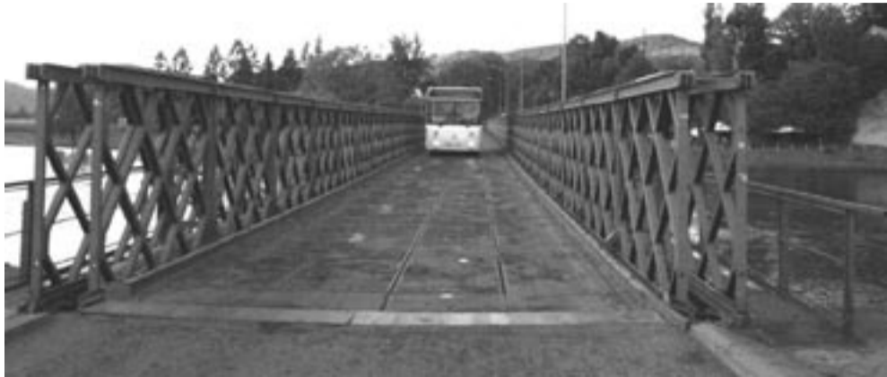
Jak mówi powiedzenie, prowizorki są najtrwalsze...

U progu każdego sezonu turystycznego wraca problem mostu na Białą Górę, z którego korzysta kilkadziesiąt tysięcy turystów odwiedzających skansen, nie wspominając o uczestnikach organizowanych tam imprez, spacerowiczach, cyklistach, gościach „Sosenek” czy Campu Biała Góra. Tymczasem konstrukcja – prowizorka z lat 80. wybudowana na czas powodzi – „ledwie zapie”.