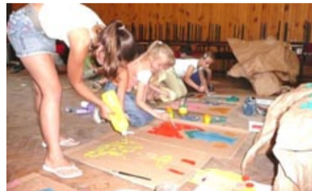
Podczas warsztatów dzieci poznały podstawy pracy scenicznej, wykonały samodzielnie lalki, scenografię oraz stworzyły mały spektakl.

Podsumowaniem warsztatów będą zajęcia plastyczne, przeprowadzone przez BWA podczas Kermeszu. (jz)