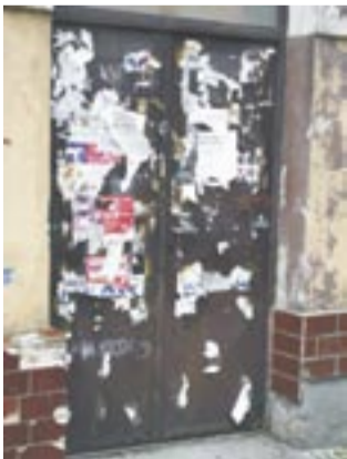
Tak wyglądają drzwi na reprezentacyjnym deptaku miejskim 3 Maja. Straż Miejska powiedziała: stop! Radni idą jej w sukurs.

O bezpieczeństwie na drogach, temacie wyjątkowo na czasie, mó-