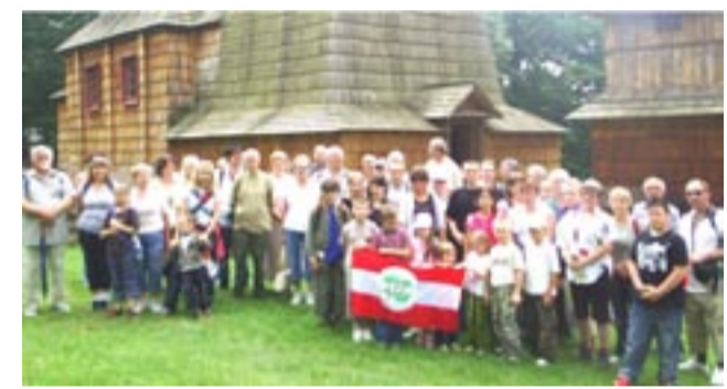
Spacerowicze pod urokliwą cerkwią z Ropiek – jednym z najciekawszych obiektów w sanockim skansenie.