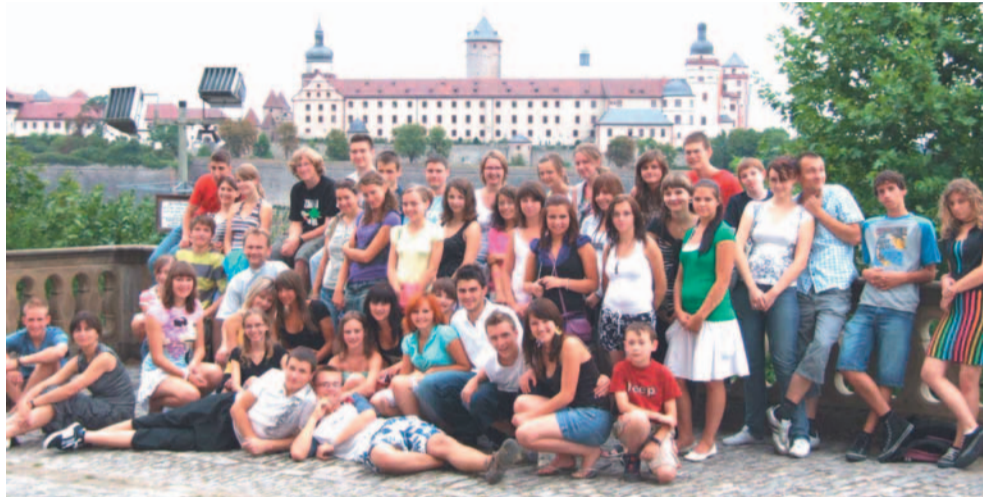
Radośni, pełni wrażeń i już mocno zaprzyjaźnieni – na tle twierdzy w Wurzburgu.