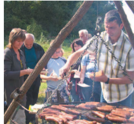
Po wyczerpującej wędrówce kielbaska z grilla smakowała jak największy rarytas...

kę. I chwała, że tacy ludzie w Sanoku są, że rzucając domowe obowiązki, słynny niedzielny obiad – rosół i kotlet schabowy – i że biorą plecak i idą. Cieszy nas to, gdyż nasza praca to nie jest sposób na zarabianie pieniędzy – to właśnie służba ludziom. To jest coś, co czujemy w sobie, co chcemy dać i pokazać. Sanok leży na tak