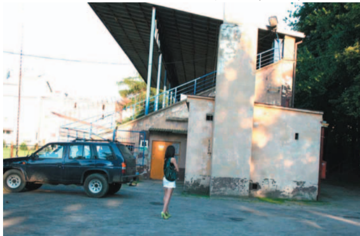
Tak dziś wygląda reprezentacyjny stadion miejski WIERCHY. Jest jednym z eksponatów sportowego skansenu Sanoka

Lokalizacja na Błoniach, choć nie jest przesądzona, może – łącznie z projektowanym Aquaparkiem – stworzyć piękny kompleks sportowy. Parkingi przy hali „Arena” będą mogły uzupełniać miejsca postojowe przy nowym stadionie, przez co potrzeba ich będzie mniej, gdyż zwykle duże imprezy nie odbywają się jednocześnie na hali i na stadioni-