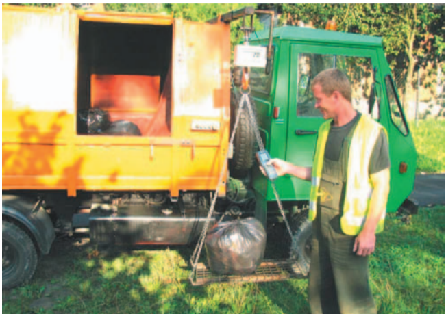
Śmieci w gminie Zagórze odbierane są specjalnym samochodem, wyposażonym w wagę.

W Sanoku cały czas dyskutujemy o problemie śmieci, tymczasem Gmina Zagórze wprowadziła nowy system ich odbioru. „Otwarty” zastąpiono „zamkniętym” i mieszkańcy płacą teraz za kilogramy oddawanych odpadów.