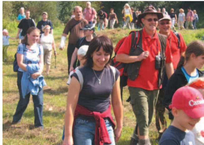
Zmęczeni, ale szczęśliwi – dzięki „Kijowi” odkryli góry na Dolinie.

ciekawie się rozwija i z roku na rok ma coraz większą frekwencję. Zaczynaliśmy nieśmiało, niepewni czy to się przyjmie, czy się uda. Ale udało się i jesteśmy wdzięczni wszystkim tym, którzy nam zawierzili, uważając, że w naszym towarzystwie można mile spędzić niedzielne przedpo-