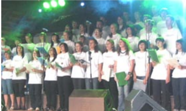
Dwugodzinny koncert w wykonaniu sanockiej młodzieży oazowej porwał publiczność i zachęcił do wspólnego śpiewu.

Zjazdy na linie, pokazy karate, grupa antyterrorystów w akcji, loteria fantowa, to tylko kilka z atrakcji jakie przygotowali młodzi ludzie z oazy, aby przyciągnąć uwagę dzieci i młodzieży, która często odchodzi od kościoła, popadając w nałogi. – Żyjemy w czasach, w których trzeba szukać ratunku w takich imprezach jak ten koncert. Kościół jest zamknięty, oaza nie jest zamknięta, otwieramy się na ludzi,