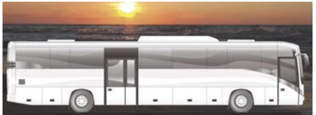
Czy Autosan takim właśnie Euroliderem wjedzie na drogi europejskich miast?