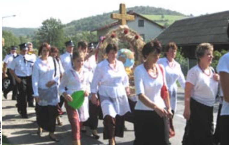
Grupa dożynkowa z Holuczkowa niosła w korowodzie wieńiec w kształcie zwieńczonego krzyżem koła z globem ziemskim w środku.