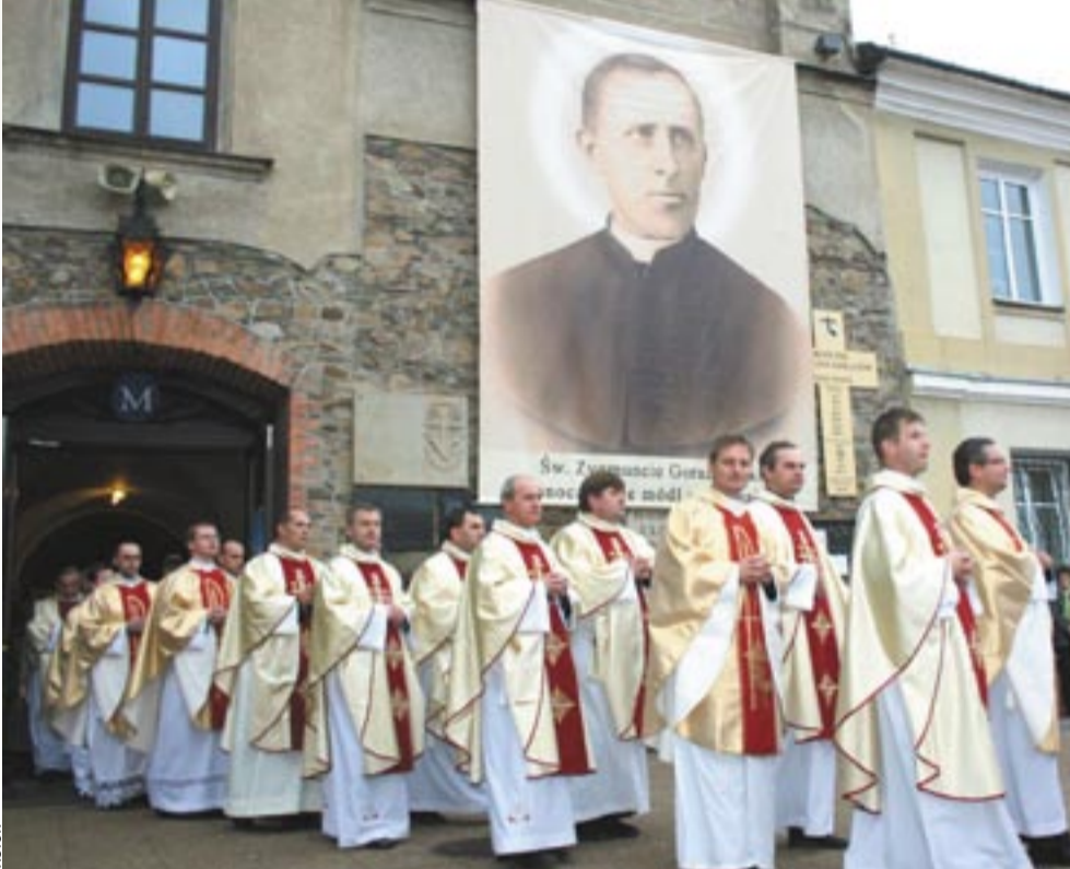
Sanok powierzył się opiece św. Zygmunta Gorazdowskiego, przyjmując Go za swego patrona. W uroczystości ogłaszającej to światu uczestniczyło kilkudziesięciu kapłanów. Ich orszak, na tle olbrzymiej planszy z wizerunkiem Świętego, prezentował się wyjątkowo.