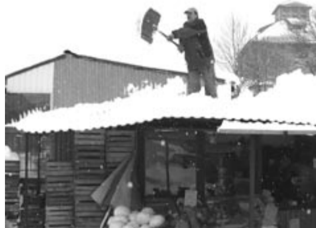
Nie ma siły – trzeba złapać za łopatę...

Mając na uwadze obfite opady śniegu w ostatnim czasie Urząd Miejski w Sanoku uprzejmie informuje, że utrzymanie ulic należy do zarządcy drogi, a w przypadku braku zarządcy do właściciela terenu.