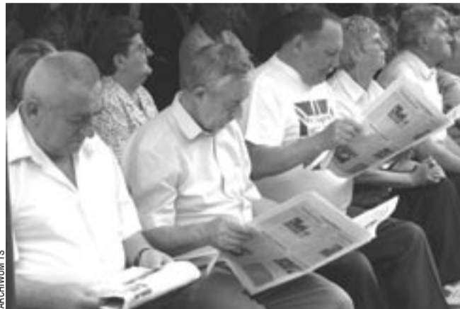
Mamy liczne dowody na to, że „TS” jest lubiany przez sanoczan. Taki obrazek, jak ten na zdjęciu, to prawdziwy miód na nasze serca. Niestety, nie możemy się pochwalić tym, że lubią nas wszyscy radni. Ale nie mamy im tego za złe. I jeśli nawet nie dobędziemy ich sympatii, to liczymy na to, że będziemy sprawiedliwie oceniani i szanowani.

Systematycznie relacjonujemy obrady sesji Rady Miasta. Staramy się to czynić wiarygodnie i jak najrzetelniej. Treści tych relacji nie dyktuje nam ani nie cenzuruje burmistrz miasta czy jego współpracownicy. „TS” redaguje zespół re-