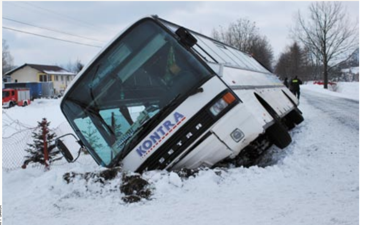
Nad pasażerami tego autobusu czuwała Opatrzność – odnieśli na szczęście niegroźne obrażenia. Feralną podróż pamiętać będą jednak długo.