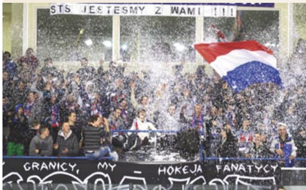
Sanoccy kibice, zdopinguowani obecnością kibiców z Bytomia, szybko złapali formę, wspierając swój zespół. W podziękę za pierwsze zwycięstwo zapowiedzieli, że jadą do Bytomia po dwie kolejne wygrane.