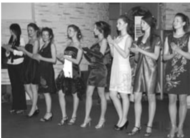
Uroda, wdzięk i szyk, czyli sanockie modelki w akcji.

pokaz. – Przeważały trzy kolekcje prezentujące trendy i tkaniny, które będą lansowane przez projektantów w przyszłym sezonie wiosna-lato. Wszystkie kostiumy pochodzą z sanockich sklepów, a część kreacji zapro-