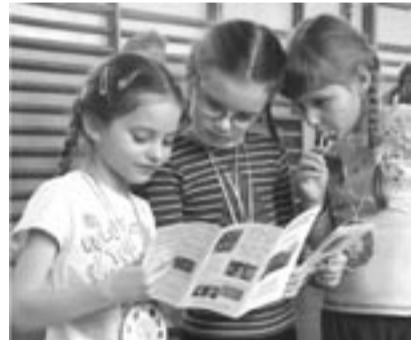
Ale fajna ta szkoła! – zdają się mówić przyszłe pierwszoklasistki.

Podobnie jak w ubiegłym roku nauczyciele z „Kingi” przygotowali dla małych gości bogatą i atrakcyjną ofertę zajęć, konkursów i zabaw edukacyjnych, mających ośwoić ich ze szkolną rzeczywistością. Emocji sportowych i żywiołowego dopingu dostarczyła „Olimpiada przedszkolaka”, a interesujących doświadczeń i eksperymentów – „Przygoda z przyrodą”. W świat liczb i figur wprowadziła przyszłych pierwszoklasistów „Wesoła matematyka”, nie brakło również zajęć kształcenia zintegrowanego pn. „Przyjaciele Kubusia Puchatka”. Dzieci wędrowały po „Krainie Baśni”, obejrzały przedstawienie „Kopciuszek”, kręciły „Kółem fortuny” w wersji angielskiej, odbyły też fascynującą „Podróż w czasie”, podczas której dowiedziały się m.in., jak dawniej kiszono kapustę i skubano pierze. Ku ogromnej uciesze mogły też samodzielnie zagnieść ciasto w niecce, sprawdzić, jak robi się masło w maśniczce i „ogolić” kolegę prawdziwą brzytwą.