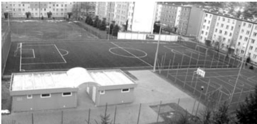
Sanocki „Orlik” przed otwarciem. Po otwarciu ani przez chwilę nie był taki pusty.