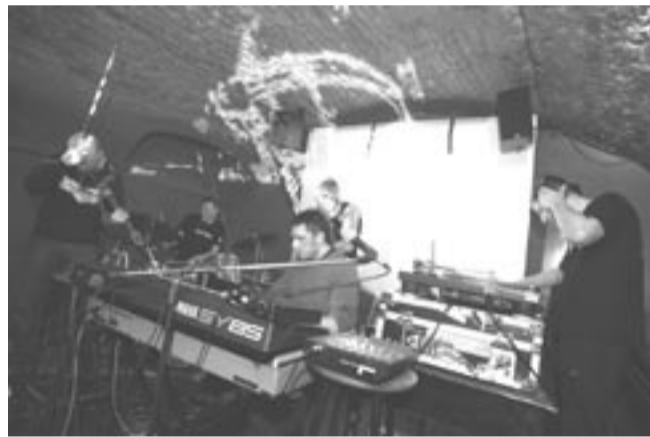
Polsko-norweski projekt SPEJS zaskoczył publiczność „Paniki” awangardowym połączeniem jazzu i wizualizacji, przedstawianych za pomocą rzutnika.

Kolejne koncerty w najbliższy weekend. W sobotę w „Panice” wystąpi folkowa Kapela Na Dobry Dzień – pierwszy raz przed sanocką publicznością. Początek o godz. 20, bilety po 5 zł. W niedzielę punkowe klimaty w klubie Szklarnia, gdzie zagrają: WC, OSC i BabaYaga Oyo. Godzina 18, wjazd 12 zł. Natomiast na przyszłą sobotę (21 bm.) planowane są tam koncerty grup: Proletariat, Out Of Tune i Get Break. Bilety w sklepach Sonic i Violin po 16 zł.