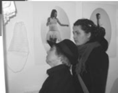
„Połączone” Małgorzaty Markiewicz przyciąga uwagę kwintesencją kobiecości postrzeganej przez pryzmat macierzyństwa.

– Specyficzne kobiece doświadczenia, przez lata wyprowadzane z przestrzeni prywatnej do sfery publicznej, stały się swoistym kodem, to już nie tyle gra stereotypami, co autonomiczny język, zastrzeżony dla kobiet, podkreślający wyjątkowość ich działań. Przędzenie i tkanie od najdawniejszych czasów w wielu kulturach były czynnościami o znaczeniu symbolicznym czy wręcz magicznym. Dla artystek podkreślenie odmienności płciowej w sztuce okazało się korzystne. Z perspektywy czasu można zaryzykować twierdzenie, że żadna inna strategia nie pozwoliłaby im zostać tak