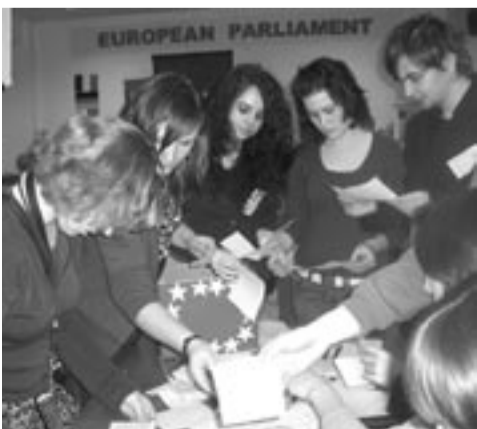
Gimnazjaliści świetnie sprawdzili się w rolach eurodeputowanych.

Zespół Szkół w Rzepedzi był gospodarzem międzynarodowej symulacji wyborów do Parlamentu Europejskiego – jednej z zaledwie czterech tego typu w kraju.