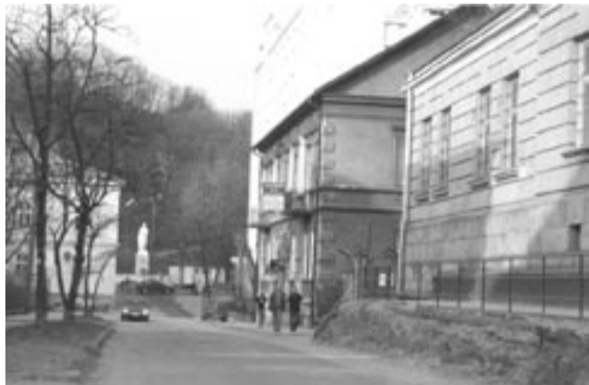
Jesienią ul. Sienkiewicza ma być jak nowa. Zniknie też widoczny na zdjęciu wysoki chodnik obok dawnej Policji.

Ciągle sporo emocji wywołuje temat ul. Sienkiewicza na odcinku od Kościuszki do Słowackiego. Ostatnio prace prowadziło tam miasto, które do 15 kwietnia ma przekazać inwestycję powiatowi. Wówczas ogłoszony zostanie przetarg, choć nie brak głosów, że można to było zrobić wcześniej. – To nie takie proste, bo wszystko zależy od terminów. Pewnych procedur nie da się