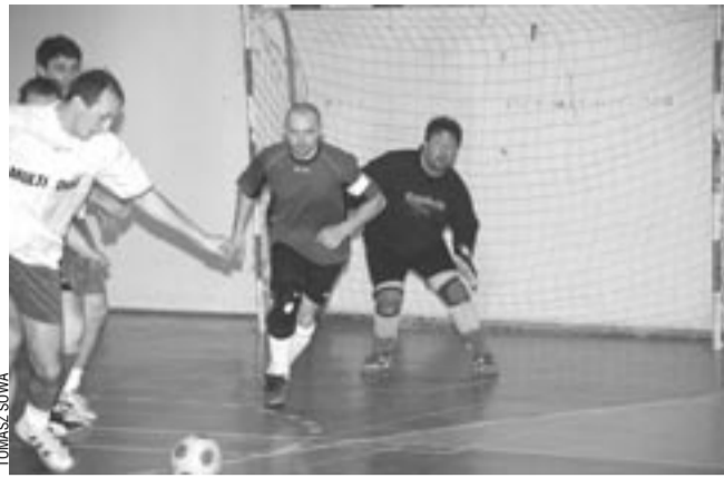
W meczu finałowym gra toczyła się głównie do bramki Policji.

Przed finałem wielu kibiców twierdziło, że słynąca z żelaznej taktyki Policja postawi trudne warunki drużynie z Leska. Cóż, mecz jeszcze dobrze się nie rozpoczął,