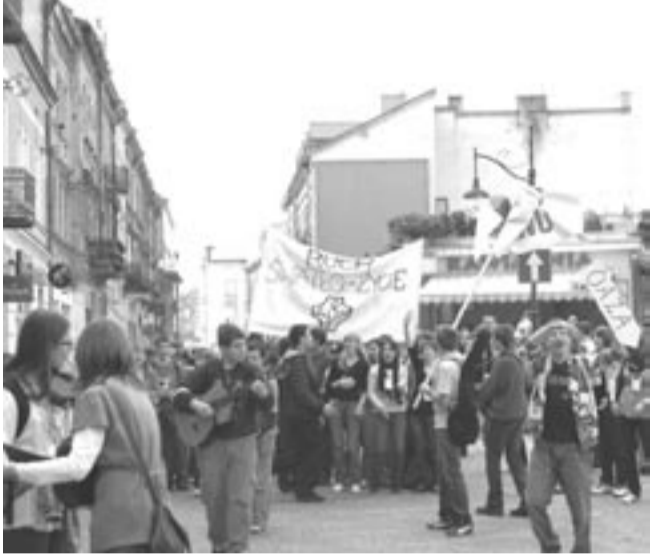
Ulice Przemyśla żyły duchem młodzieży.

Z Sanoka do Przemyśla pojechały dwa autokary z młodzieżą, głównie ze szkół średnich, m.in. członkowie ruchu „Światło-Życie”. Młodzi chcieli zwrócić uwagę na potrzebę dbania nie tylko o swoje, ale także o życie innych ludzi. Dużo mówili o problemie