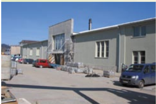
Teren obok Autosanu to jeszcze plac budowy, ale za dwa miesiące lśnić będzie pełnym blaskiem.

Już wkrótce Posada dołączy do grona dzielnic, w których funkcjonują markety handlowe. Początkiem czerwca obok Autosanu otwarty zostanie sklep firmy INTERMARCHE. Całkiem możliwe, że będzie to jej jubileuszowa 200. placówka w Polsce.