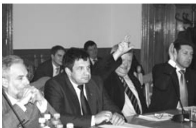
Emocje przy głosowaniu.