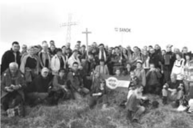
Pątnicy z Sanoka dotarli pod krzyż papieski na szczycie Tarnicy w dobrej kondycji, do czego przyczyniła się wyjątkowo łaskawa w tym dniu pogoda.

Miejska Biblioteka Publiczna ul. Lenartowicza 2, tel. 013-464-57-50 (sekretariat), 013-464-57-51 (czytelnia), 013-464-57-52 (wypożyczalnia).