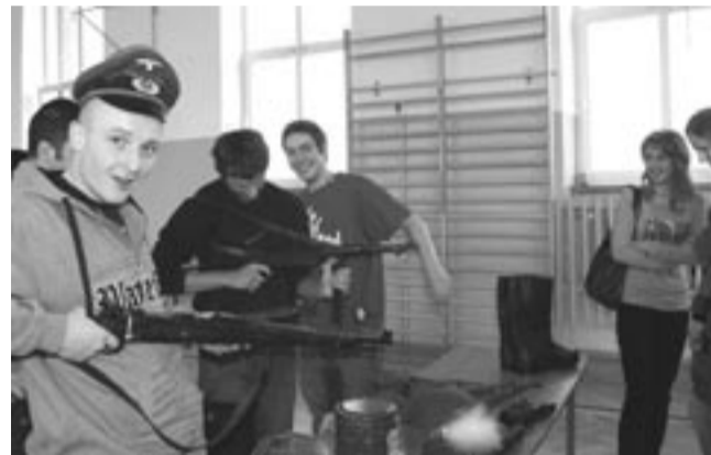
To była niepowtarzalna okazja, aby założyć bluzę munduru, wziąć do ręki broń i zrobić sobie fotografię.