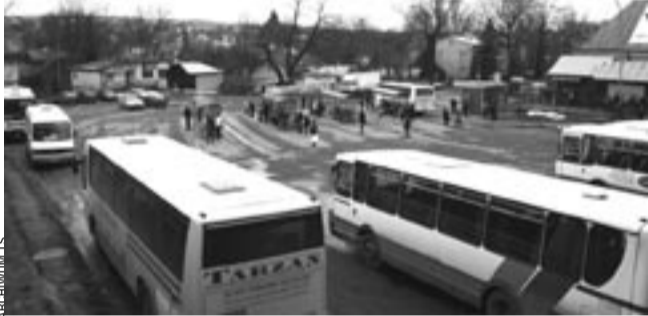
Ciekawe czy wielopoziomowy parking w Śródmieściu, z zapleczem handlowo-usługowym na swej najwyższej kondygnacji, podtrzyma nazwę „OKĘCIE”, czy też przyberze inną?

Tak więc, jeśli wszystko będzie przebiegać po myśli inwestorów, jeszcze w tym roku w okolicach ulicy Jagiellońskiej k. tzw. okopiska mogą pojawić się maszyny budowlane. emes