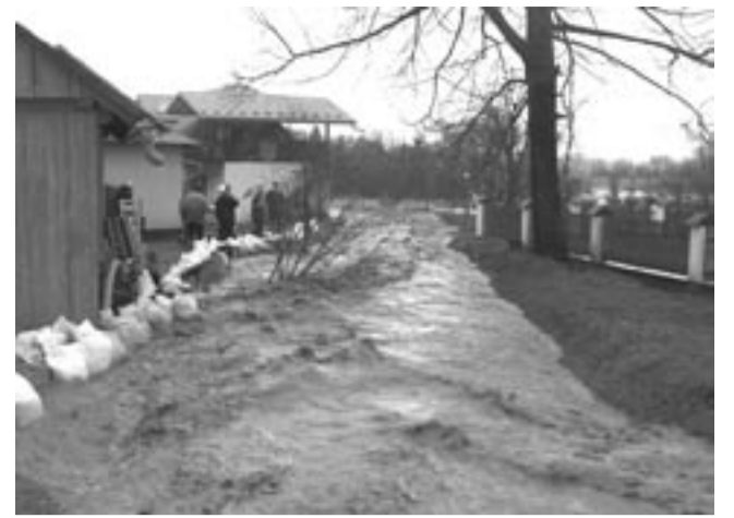
Potok Ratnówka zamienił się w rwącą rzekę.