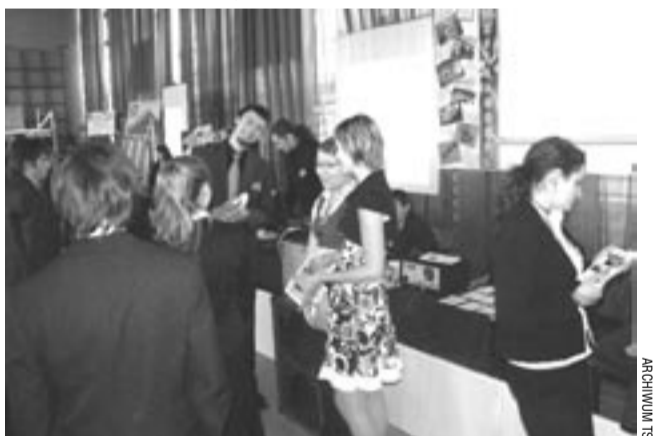
Gimnazjaliści z zainteresowaniem przyglądali się ofertom szkół, choć większość chyba wyboru dokonała już wcześniej.

Prawie półtora tysiąca uczniów przewinęło się przez jubileuszową, XX Giełdę Szkół Ponadgimnazjalnych, która jeszcze przed świętami zorganizowana została w Zespole Szkół nr 3. Podczas imprezy swoje oferty prezentowało 13 placówek.