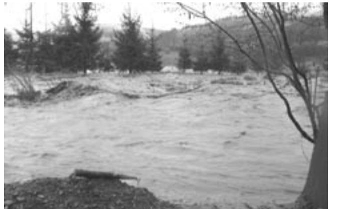
Woda zalała także wiele pól

liu miejscach zaowocowało lodowym deszczem wielkości orzechów włoskich, wybijającym nawet szyby w samochodach) w gminie Sanok jest dość rozległy. Ze wstępnych ustaleń poczynionych przez członków komisji powołanej do oszacowania strat wynika, że najbardziej ucierpiała gminna infrastruktura drogowa i mostowa, której naprawa może kosztować nawet 750 tys.