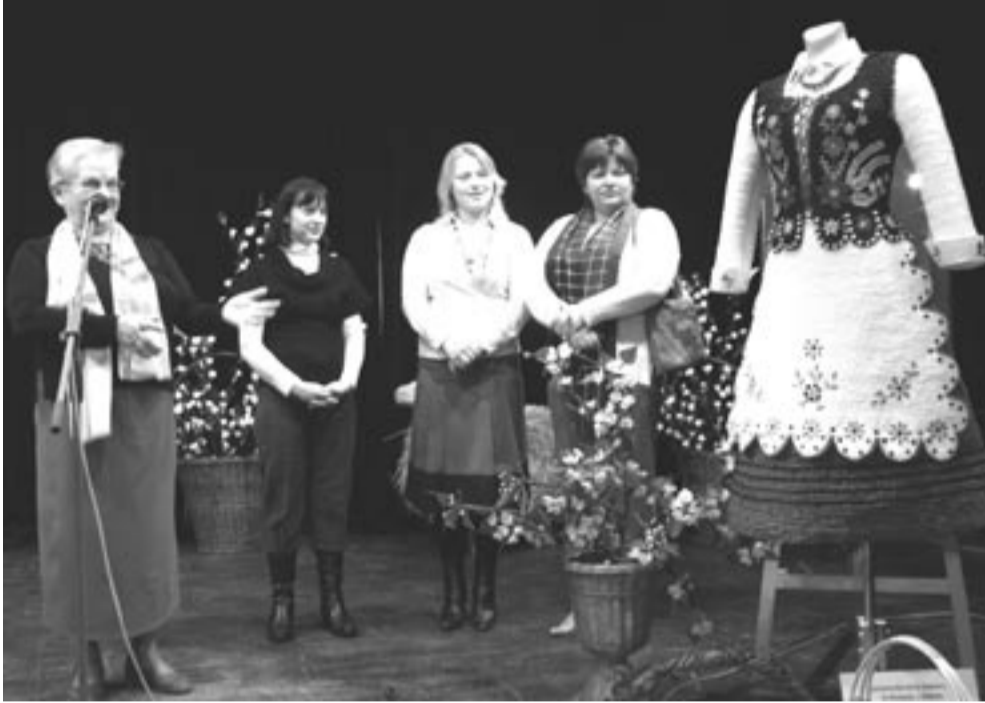
Mistrzyni w kręceniu bibuły z dumą prezentowały swoje najnowsze dzieło.

Tylko ci, którzy odwiedzili XIV Wystawę Wielkanocną w Sanoku mogli przekonać się o tym, jak wspaniałe rzeczy można stworzyć, mając do dyspozycji bibułę. Rękodzielniczek z Gminnego Ośrodka Kultury w Sanoku przeszły same siebie – przygotowały rzeszowski strój ludowy. Dzięki niespotykanej pomysłowości i talentowi arcydzieło utkane z cieniokiego papieru zostało tak upodobnione do prawdziwej tkaniny, że zwiedzający brali je za prawdziwy ubiór.