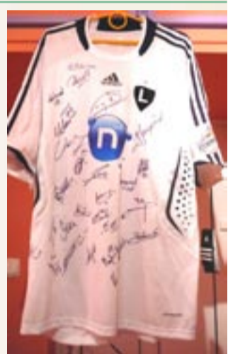
wek, a teraz już w ćwierćfinale, co dodatkowo zwiększa wartość koszulki wystawionej na Allegro. Gorąco zachęcamy do licytacji!