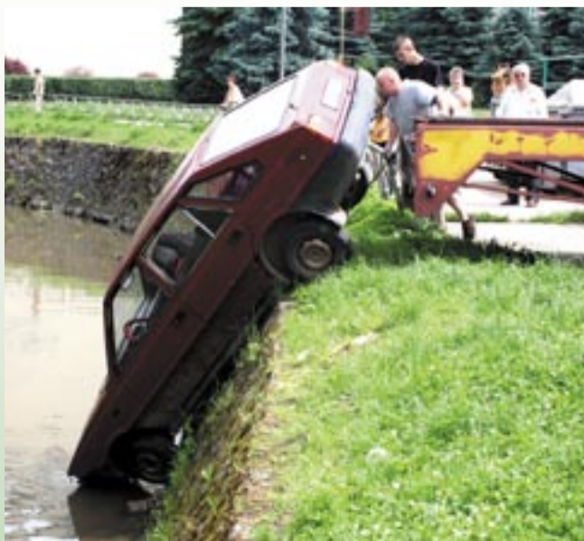
Samochód „zaparkowany” w potoku musiała wyciągać laweta.