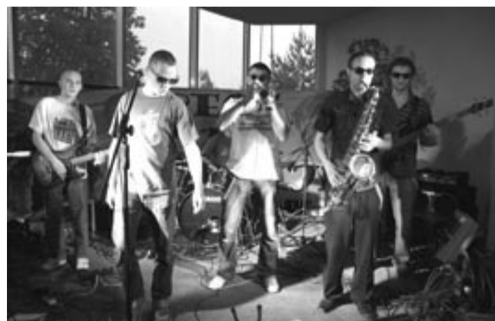
Trąbka i saksofon to ciekawy dodatek w muzyce punk/reggae. Solówki członków zespołu spodobały się sanockiej publiczności.

MARGINESS. Muzyka kapeli z początku działalności przypomina nieco poczynania legendarnej grupy KRZYYS. To, co zaprezentowali w sanockiej „Szklarni” to połączenie reggae, ska i melodyjnego punka. Zespół wykonał sporo piosenek z własnego repertuaru, ale także kilka coverów znanych kapel, takich jak Brygada Kryzys czy Grabaż.