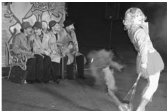
Spektakl „Płonące laski 4”, choć bardzo dynamiczny i zabawny, skłaniał też do głębszej refleksji.

Niedzielnny program miał bardziej rozrywkowy charakter. Najpierw było popołudnie dla dzieci, którym przygotowano zjeżdżalnię, trampoliny i inne atrakcje. Kulminacją zabawy sta-