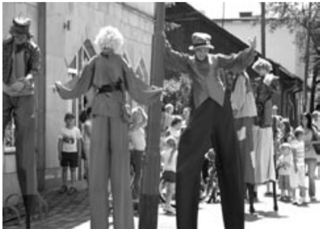
Szczudlarze z Katowic wciągnęli dzieci do wspólnej zabawy.

Kiedys Collage Teatralny był sanocką specjalnością, teraz organizuje go Zagórz. Gdyby nie pogoda, inauguracyjna edycja tej imprezy okazałaby się naprawdę udana – były plenerowe spektakle, uliczne happeningi i różnego rodzaju pokazy.