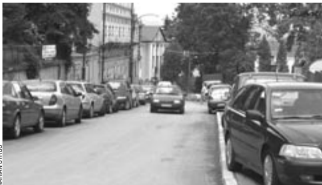
Tak dziś wygląda ulica Zamkowa. Żadnym usprawiedliwieniem dla komunikacyjnej wolnej amerykanki nie jest budowa parkingu.

Bardzo podobne problemy mają też kierowcy jadący pod górę ulicą Sobieskiego. Komuś, kto dał