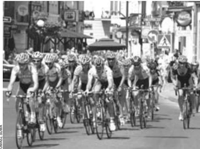
Gdy kolarze przejeżdżali przez Sanok, stojący w korkach kierowcy kleli w żywy kamień.

Nie tylko mieszkańcy Sanoka mieli w tym dniu problemy z poruszaniem się samochodem po mieście. Czwartkowa wyprawa nad Solinę mogła okazać się ponaddwugodzinną drogą przez mękę z kilkoma przymusowymi postojami. – Musieliśmy stać i czekać w Sanoku, Lesku i Hoczwi – skarżył się jeden z kierowców. Organizatorzy wyścigu nie skontaktowali się