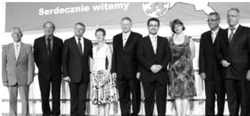
Jubileusz 15-lecia partnerstwa miast Sanok – Reinheim zainaugurowali nasi przyjaciele z Niemiec, goszcząc naszą delegację w swoich progach (na zdj. podczas oficjalnego spotkania). W drugiej połowie lipca dojdzie do rewizyty. Tym razem to my będziemy organizatorami jubileuszowych uroczystości.

– Uważam, że zaproszenie partnerów z Niemiec wykorzystano