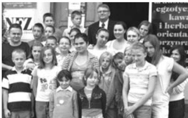
Turnus wprawdzie już się kończy, ale przecież będzie jeszcze wycieczka do Krakowa i Wieliczki – pocieszają się koloniści Stowarzyszenia Przyjaciół Heleny Kosiny.