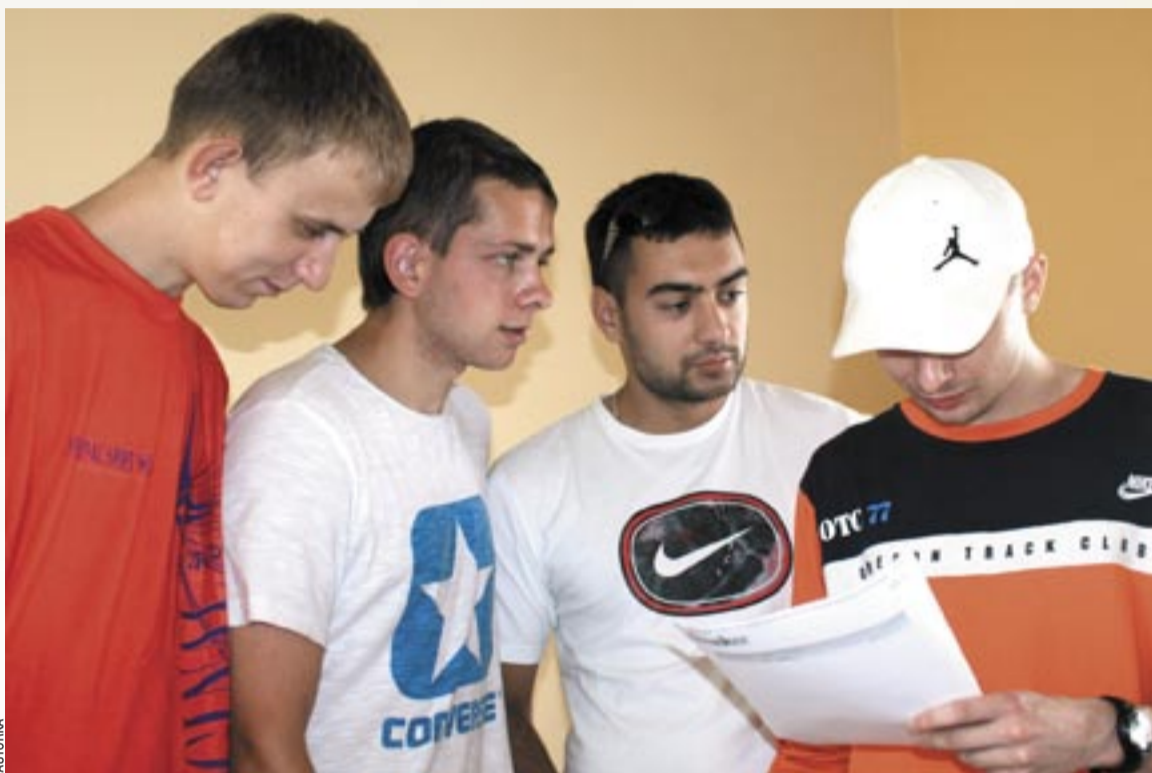
Oszukani mężczyźni nie wierzą w odzyskanie należnych im pieniędzy, chcą jednak ostrzec innych przed nieuczciwym pracodawcą.