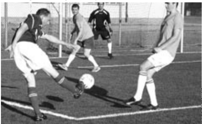
Mecz Kingsów (ciemne stroje) z WKS był ozdobą ostatniej kolejki.

Do końca rozgrywek na „Orliku” pozostały jeszcze 3 kolejki. Mecze cieszą się zainteresowaniem, ogląda je spora grupa kibiców.