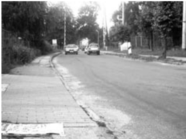
Remont ul. Konarskiego obejmować będzie 300-metrowy odcinek drogi.

Niebawem ruszą w Sanoku kolejne remonty ulic, prace na Konarskiego i Konopnickiej mają rozpocząć się w tym tygodniu. Starostwo Powiatowe zadba także o naprawę szkód wywołanych przez ubiegłoroczne podtopienia na trasach Zagórz-Poraż i Sanok-Dobra.