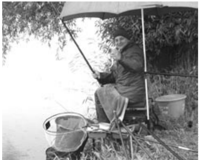
Wędkarstwo spławikowe to nie przelewki. Do tego łowienia potrzebna jest prawdziwa „bateria” sprzętu.