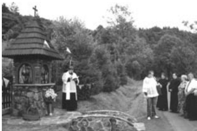
Kapliczka stała tuż przy drodze, w pięknej scenarii. Przejżdżając obok, warto westchnąć do świętego Krzysztofa, prosząc o bezpieczną, bezwypadkową jazdę. Na zdjęciu – moment poświęcenia.

Uroczystość zgromadziła blisko 200 osób: rodzinę, znajomych, księży. Gospodarze zadbał o odpowiednią oprawę – każdy z gości otrzymał obrazek z wizerunkiem świętego