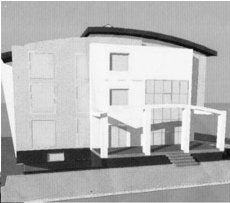
Zaniedbany i opuszczony budynek nie zdobi otoczenia. Gdyby nie ośli upór kilku sąsiadów, mógłby już dawno wyglądać jak na powyższym obrazku.

mistrza też była zła. Na tak małej działce, przy planowanej rozbudowie istniejącego budynku, nie ma szans na stworzenie tylu miejsc postojowych. To po prostu jest nierealne. Prawo budowlane