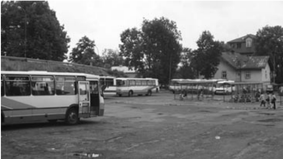
Program oszczędnościowy tylko w niewielkim stopniu wyhamuje inwestycje. Te najważniejsze, takie jak parking z obudową handlowo-usługową na Okęciu, pójdą wcześniej wytyczonym tempem.

A co z „Orlikiem” przy Szkole Podstawowej nr 1 na os. Błonie? Czy się obroni? Wszak to też inwestycja z dotacją wysokości