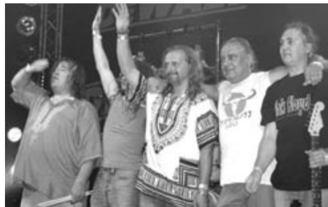
Węgierska grupa PINK FLOYD Tribute Band zagra w Mrzygłodzie.