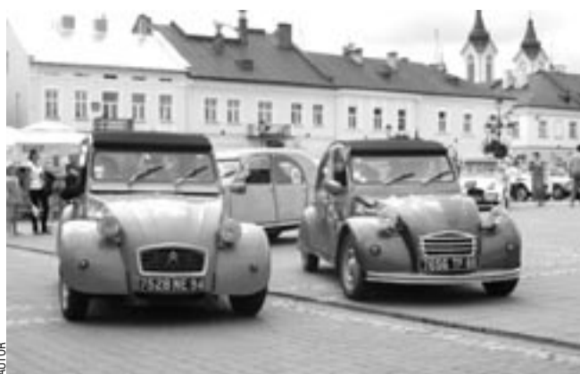
Francuzi mieli Citroena 2CV, Niemcy „garbusa”, Brytyjczycy „mini”, Włosi Fiata 500, a Polacy „malucha”. Magia małych samochodów oczarowała całą Europę.