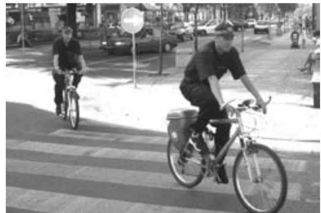
Dla tych, którzy nie mogą sobie wyobrazić Straży Miejskiej patrolującej na rowerach obrazek z Wrześni. I co, można? Na hulajnodzie nie udało się nam nigdzie znaleźć. Może Sanok da przykład?

Pragnę podać Panu liczne przykłady patroli rowerowych funkcjonujących w innych miastach takich jak: Tychy, Września, Lublin, Poznań, Kościerzyna, Elk, Biała Podlaska, Racibórz, Kołobrzeg itd. Komendanci Straży Miejskich w innych miastach zauważają: strażnik miejski pieszo przechodzi około 15 km, rowerem jest w stanie pokonać do 60 km dziennie. Czy władze tych miast zastępują, także na śmiech?