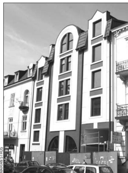
Była dziura w zabudowie i była jakaś droga prowadząca do nowego parkingu. Jest ciekawy architektonicznie budynek, a będzie równie piękny parking. Brawo PBS!

Prace postępują zgodnie z planem, co oznacza, że do końca listopada zagospodarujemy nowy obiekt. Nie będzie to jeszcze koniec całej inwestycji. Na wiosnę zechcemy odnowić elewację głównego budynku (róg Kościuszki i Mickiewicza), tak, aby wespół z nowo oddanym stanowiły ładny i ciekawy kompleks architektoniczny. Wiosną zajmiemy się także podwórzem, które zamierzamy ucywilizować – mówi