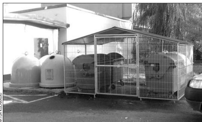
Mieszkańcy ul. Jana Pawła II chwalą sobie takie rozwiązanie, choć nie zawsze śmietnik wygląda tak idealnie.

Na zakup boksów z zamkami oraz utwardzenie terenu spółdzielnia wyda prawie 100 tys. złotych. To niemało, ale wydatek