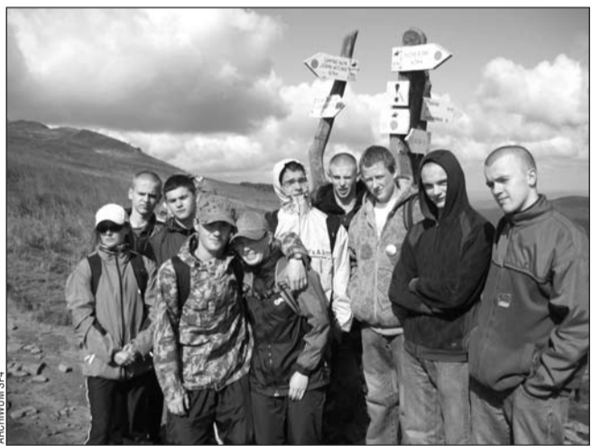
Uczniowie „Budowlanki” wykazali się nie tylko znakomitą kondycją, ale i sporą wiedzą.

tek – zajął 2. miejsce w konkursie wiedzy ekologicznej. Gratulujemy! /jot/