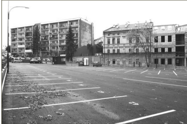
Parking Elcomu przy ul. Zamkowej na razie świeci pustkami.