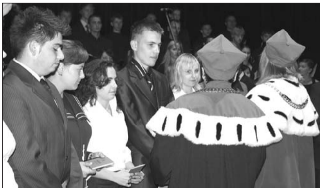
Uroczystym momentem inauguracji było ślubowanie oraz immatrykulacja studentów I roku. Zaszczycu tego dostąpili adepci PWSZ, którzy najlepiej spisali się podczas akcji rekrutacyjnej.