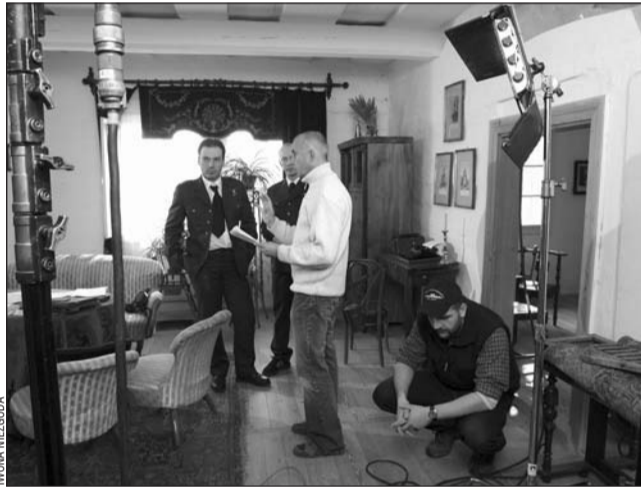
Zdjęcia kręcone były w Zakopanem, Krakowie, Sanoku, Mrowli, Preszowie i Spiskiej Nowej Wsi. Część ujęć powstała w sanockim skansenie. Na zdjęciu – jeden z obiektów, zmieniony w siedzibę wojskowego sztabu.

Tytuł filmu, zrealizowanego w ramach projektu „Niebo nad Historią”, brzmi: „Tragedia Załogi R XIII”. Na projekcję, która odbędzie się dziś w Galerii BWA o 18, zapraszają Nafta Fandango i Rohan Multimedia. Pokaz będzie zarazem spotkaniem z ekipą filmową oraz ludźmi, dzięki którym ten dokument powstał. (2)