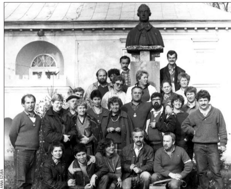
Wycieczka szkoleniowa przewodników – Dubiecko, miejsce urodzenia Ignacego Krasickiego.