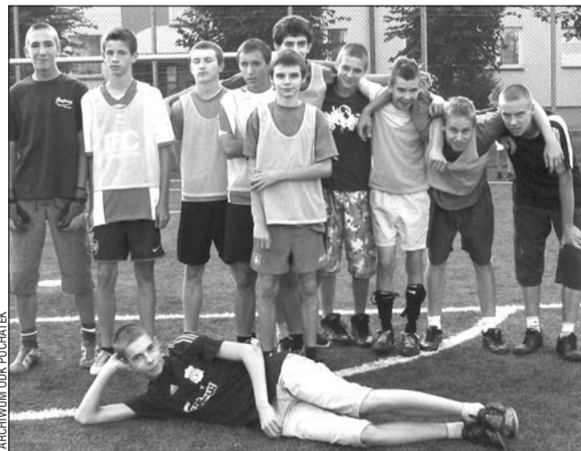
Zwycięska drużyna WSM.

Drużyna o nazwie WSM odniosła zwycięstwo w tradycyjnym Turnieju Piłki Nożnej „O Nagrodę Misia Puchatka”, który pierwszy raz rozgrywano na Orliku.