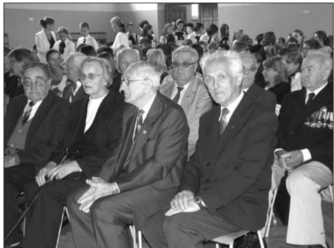
Zaangażowanie dzieci i nauczycieli oraz wspólne przeżywanie wraz z zaproszonymi gośćmi inscenizacji to dowód i nadzieja na to, że sztafeta pokoleń trwa i będzie nadal trwała.

Pamięć o grozie wojny oraz heroizmie i bohaterskiej postawie obrońców ojczyzny – to obowiązek młodego pokolenia i warunek niezbędny do zachowania narodowej tożsamości. Takie przesłanie towarzyszyło uroczystemu spotkaniu z okazji 70. rocznicy wybuchu II wojny światowej, zorganizowanemu w SP-2 przy wsparciu sanockiego koła Światowego Związku Żołnierzy Armii Krajowej.