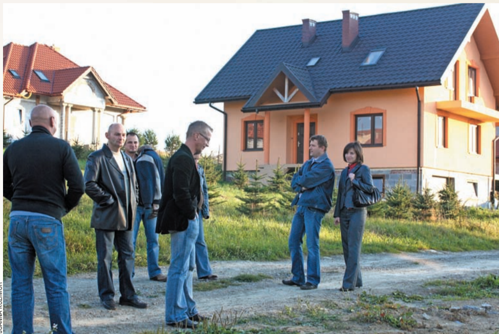
Nie jesteśmy przeciwko obwodnicy, ale nie rozumiemy, dlaczego ma być wybudowana naszym kosztem? – pytają retorycznie mieszkańcy osiedla.

Bomba wybuchła w marcu, kiedy upubliczniono warianty obwodnicy miasta planowanej w ramach modernizacji drogi krajowej Zator-Medyka. Jej inwestorem jest Generalna Dyrekcja Dróg Krajowych i Autostrad – Oddział w Rzeszowie, a projektantem firma Ove Arup & Partners International Limited Sp. z o.o., która zgodnie z wytycznymi inwestora przygotowała 6 wariantów przebiegu obwodnicy w ramach I etapu Studium techniczno-ekonomiczno-środowiskowego (miasto partycypuje w połowie kosztów opracowania projektowego). Choć ich przebieg jest zróżnicowany, mają też cechy wspólne – włączają obwodnicę w drogę krajową w rejonie torów kolejowych w Pisarowcach, z drugiej zaś strony – na granicy miasta w Olchowcach. Wszystkie w mniejszym lub większym stopniu przechodzą przez tereny zabudowane, pociągając za sobą konieczność wyburzeń, co wywołało ostre protesty mieszkańców.