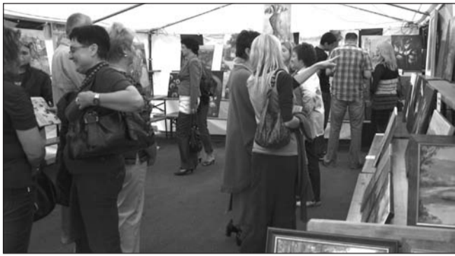
Dla artystów plener jest źródłem twórczych inspiracji i wymiany doświadczeń, dla organizatorów – okazją do powiększenia ciekawej kolekcji obrazów.

Impreza, której patronują starosta, burmistrz i wójt gminy Sanok, na stałe wpisała się w kalendarz miejscowych przedsięwzięć artystycznych, stając się znakomitą okazją do promocji Ziemi Sanockiej. O jej atrakcyjności świadczy rosnąca z roku na rok liczba uczestników, wśród których obok stałych bywalców pojawiają się nowicjusze. Tegoroczna edycja zgromadziła rekordową liczbę 22 artystów z Polski, Słowacji i Litwy (Ukraińcy nie dojechali z powodu problemów wizowych). Sanockie klimaty, gościnność gospodarzy i piękna