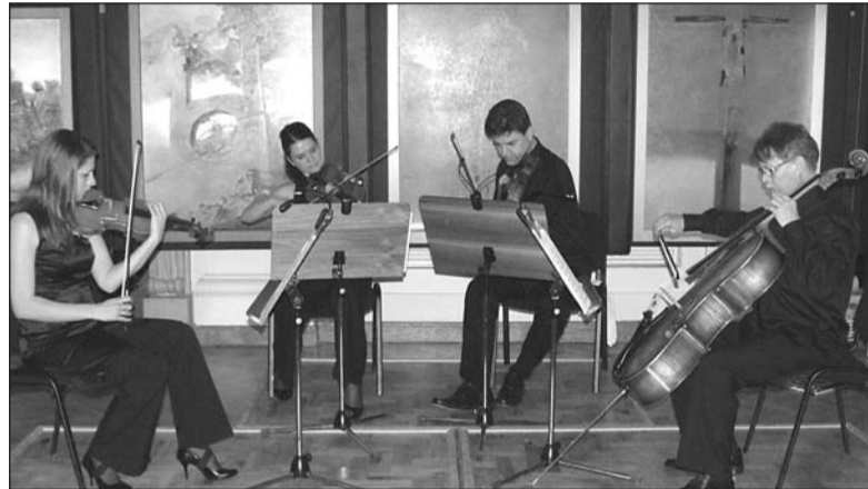
Kwartet Art Deco kilkakrotnie bisował na życzenie słuchaczy.

prac Beksiańskiego. Na pierwszym towarzyszyła im bardzo ekspresyjna muzyka Schuberta i Szostakowicza w wykonaniu kwartetu Art Deco. – Było to równie wstrząsające przeżycie. Kiedy muzyka ucichła, zapadła wielka cisza. Dopiero po chwili słuchacze jakby się obudzili, rozległy się owacje i prośby o bisy. Zainteresowanie było tak duże, że wszyscy nie zmieścili się w sali i część publiczności słuchała koncertu przez otwarte drzwi na korytarzu. Po-