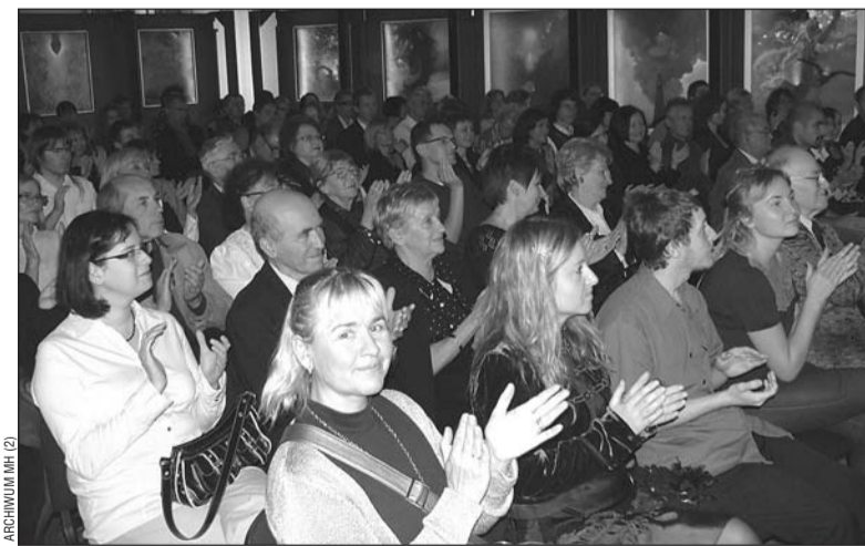
Szczęśliwcy zmieścili się w sali, pozostali słuchali koncertu... na korytarzu.

W inauguracyjnym koncercie w filharmonii krakowskiej uczestniczyła kilkudziesięcioosobowa grupa sanoczan. Zachwy-