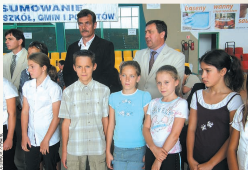
Delegację sanockich szkół (na zdjęciu przedstawiciele SP4 i SP1) nagrody i dyplomy odbierały w Krośnie, gdzie odbyło się „Wojewódzkie podsumowanie współzawodnictwa sportowego szkół, gmin, powiatów i klubów za rok szkolny 2008/2009”.