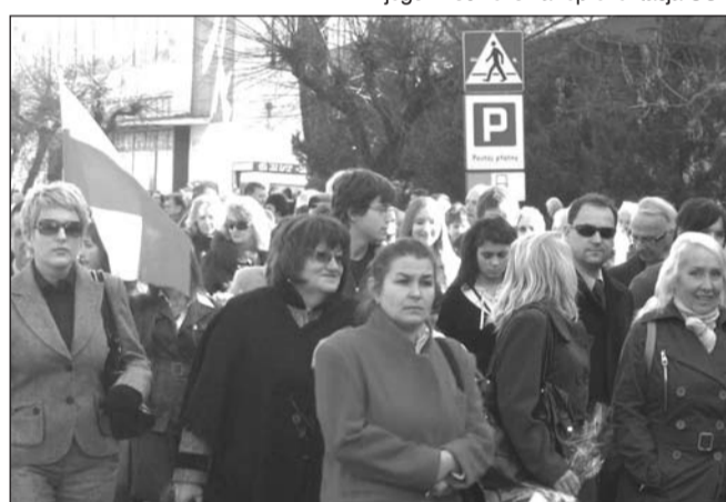
Czy społeczeństwo Sanoka weźmie liczny udział w obchodach Święta Niepodległości? Doświadczenie pokazuje, że sporo w nas patriotyzmu.

W dzień 11 listopada o godz. 11 w kościele farnym zostanie odprawiona uroczysta msza święta, z udziałem