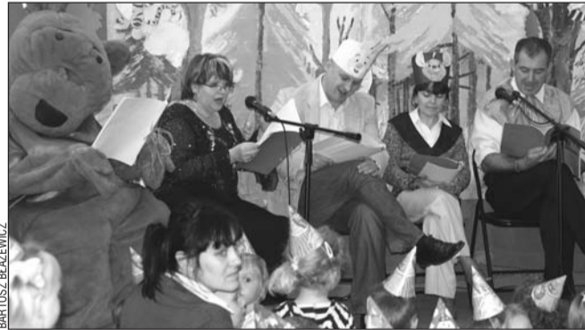
Kubaś Puchatek w wykonaniu takiego zespołu lektorskiego bardzo spodobał się przedszkolakom.

w całej poświęcono bajce Alana Alexandra Milne’a. Wiedząc, że do naszego przedszkola uczęszczają