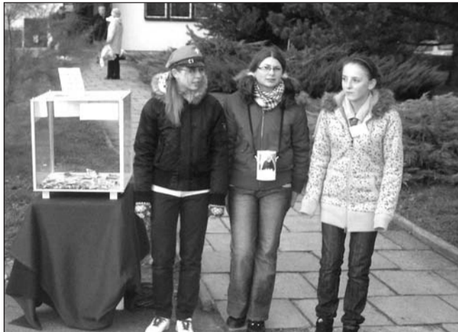
Wartę przy skarbnicy pełnili harcerze z sanockiego Hufca ZHP.

Listopadowa kwesta na cmentarzach była w tym roku wyjątkowo uroczona. Poza Albertynami pieniądze zbierało Stowarzyszenie Pomocy Rodzinie im. ks. Zygmunta Gorzdzkiego oraz Stowarzyszenie Opieki nad Starymi Cmentarzami, które zrezygnowało z puszek na rzecz skarbnicy wystawionej w pobliżu kaplicy przy ulicy Dąbrowieckiej. Mimo tak licznej konkurencji, mieszkańcy chętnie dzielili się groszem, otwierając swe serca i portfele dla potrzebujących.