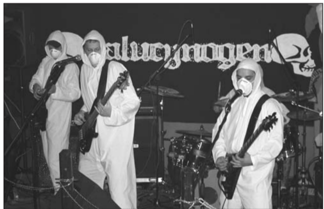
HALUCYNOGEN na scenie. Czyżby muzycy z Rzeszowa obawiali się świńskiej grypy?

Lokal był odpowiednio wystrojony w dynie i balony, klimat wzmacniała mocna hardcorowa muzyka. W uszy „rzucano się” bardzo dobre nagłośnienie i selektywne brzmienie. Prawie 100-osobowa publiczność gorąco przyjęła obydwie zespoły, prezentujące metal na niezłym poziomie. Choć jako gwiazda wystąpiła BLASFEMIA, bywalcy „Rudery” dłużej zapamiętają HALUCYNOGEN. Przede wszystkim za sprawą świetnego wokalisty, dysponującego ponoć 5-oktawową skalą głosu. Ale też z powodu ciekawego image’u. Muzycy zagraли bowiem ubrani w laboratoryjne kombinezony i maski. Czyżby w obawie przed świńskiej grypą, która ponoć atakuje z Ukrainy? (bart)