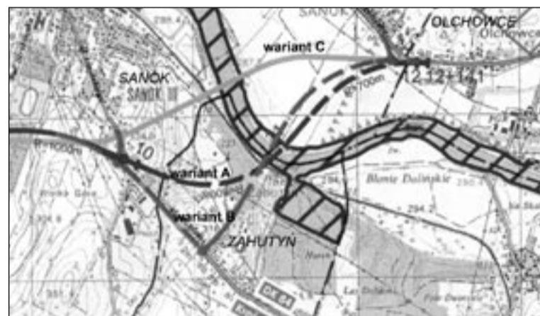
Tak wyglądają zaproponowane przez projektantów trzy wersje wariantu 7. Wszystkie przecinają San, łącząc się przed Olchowcami z drogą krajową nr 28, biegnącą w kierunku Przemysła. Każda z nich – ze względu na ukształtowanie terenu – oznacza konieczność budowy potężnych estakad, porównywalnych rozmiarami do Tower Bridge. Za jedyne 140 milionów złotych...

Łagodzą cierpienia, przywracają nadzieję, prowadzą akcje charytatywne, pochylają się nad tymi, którzy znaleźli się na skraju ubóstwa. A przy tym dzielą się z drugimi tym, co ma największą wartość – własną krewią, ratując im życie. Mowa o ludziach spod znanego na całym świecie znaku Czerwonego Krzyża. Polskiemu Czerwonemu Krzyżowi stuknęło 90 lat!