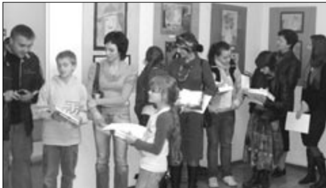
Mali artyści z dumą odbierali nagrody.

Taki tytuł miał konkurs plastyczny zorganizowany już po raz siódmy przez ODK „Gagatek” dla uczniów sanockich i podsanockich szkół podstawowych, gimnazjalnych oraz średnich.