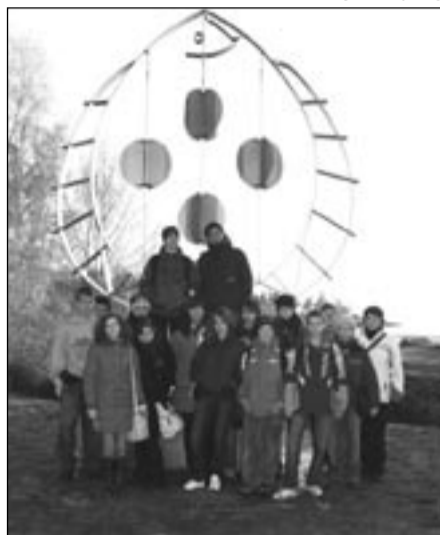
Pamiętkowe zdjęcie ekipy „sanockich ekologów” w Norwegii.

– Ta troska o wykorzystanie każdego zbytecznego przedmiotu jest u Norwegów niesamowita. Zbiera młodzież pieniądze na wycieczkę, już giełda różności i sprzedaż kwitnie. Oglądaliśmy przy gminnym punkcie odpadów sklep,