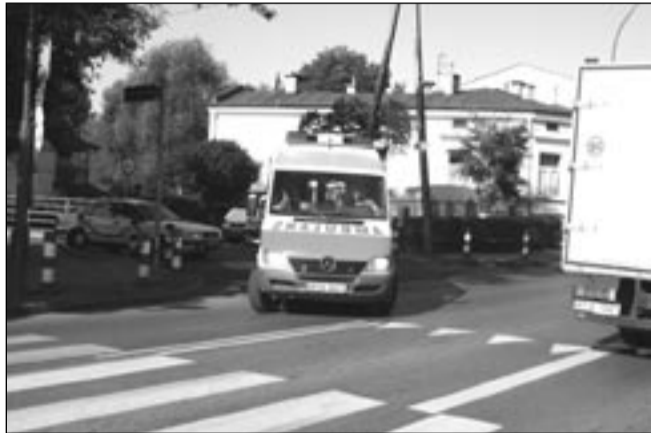
Przed przejściem kierowcy powinni obowiązkowo zdjąć nogę z gazu.

W ubiegłym tygodniu doszło w Sanoku do dwóch wypadków z udziałem pieszych. Oba zdarzyły się na oznakowanych przejściach, czyli w miejscach, gdzie kierujący powinni zachować szczególną ostrożność, a piesi mieć pewność, że są bezpieczni.