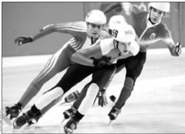
Na torze krótkim często walczy się „bark w bark”