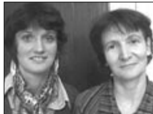
* Gdzie i kiedy odbywają się zajęcia?

także pary, które planują potomstwo. Zapraszamy też wychowawców oraz... babcie i dziadków. To zajęcia dla tych, którzy chcą wychować dzieci na ludzi o poczuciu własnej wartości i silnej woli. A jednocześnie umiejących słuchać innych, wrażliwych na ich problemy.