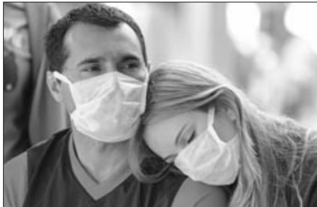
Takie obrazki na ulicach, na szczęście, raczej nam nie grożą...

Przez długi czas mieszkańcy powiatu sanockiego dość skutecznie bronili się przed grypą. Przekazywane systematycznie przez lekarzy informacje pokazują jednak, że i u nas rośnie liczba zachorowań. W ostatnim tygodniu odnotowano 92 przypadki grypy, w tym kilka spowodowanych wirusem A/H1N1. Jego obecność potwierdzono u czterech z pięciu pacjentów hospitalizowanych na Oddziale Zakaźnym sanockiego szpitala.