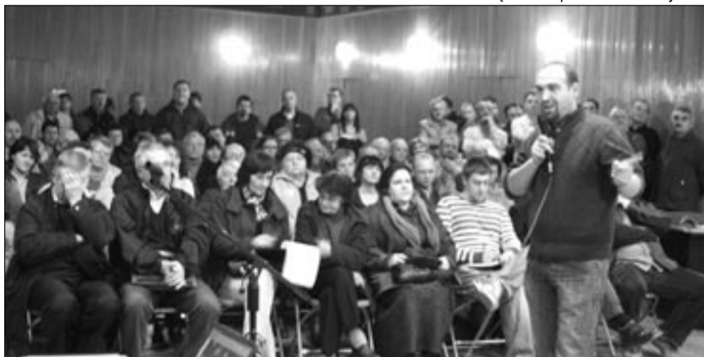
Mieszkańcy wyjątkowo tłumnie stawili się na spotkaniu. I nic dziwnego. Któż chciałby mieć obwodnicę w środku osiedla?

Południowa obwodnica Sanoka wciąż budzi wśród mieszkańców spore emocje. Tym razem alarm podnieśli właściciele domów przy ulicy Wilczej, Sowiej i Rysiej, którzy ostro zaprotestowali przeciwko wariantowi, w którym korytarz drogi wyznaczono przez środek osiedla. Nie zasypiając gruszek w popiele, zawiązali Społeczny Komitet Protestacyjny, wystosowali pisma do rzeszowskiego Oddziału Generalnej Dyrekcji Dróg Publicznych i Autostrad, projektanta oraz burmistrza miasta, zwołali też pospolite ruszenie w Klubie Chemika.