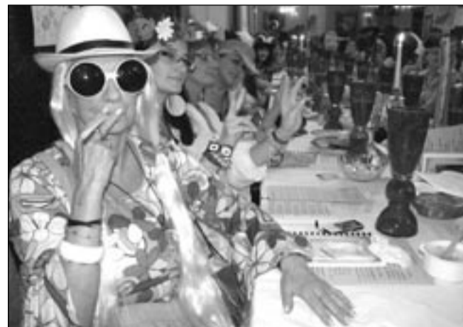
Kobiety-kwiaty... I leż treści mieści się w tym pojęciu!