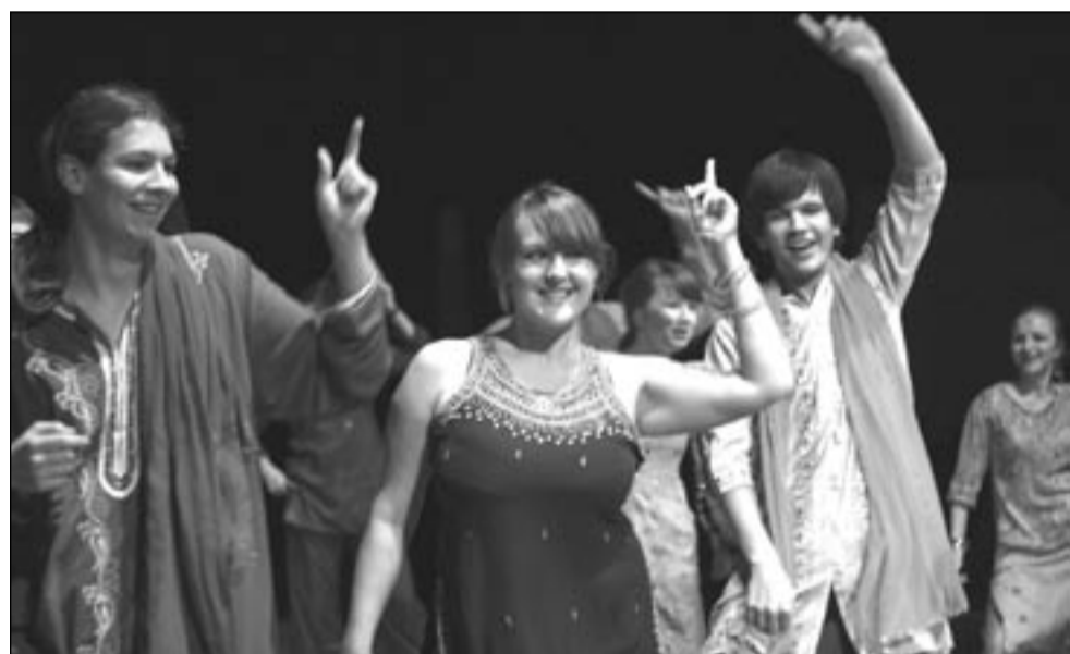
Taniec z Bollywood okazał się najbardziej barwnym momentem koncertu.

Śladem naszych publikacji, czyli „GŁOS MAJĄ CZYTELNICZY