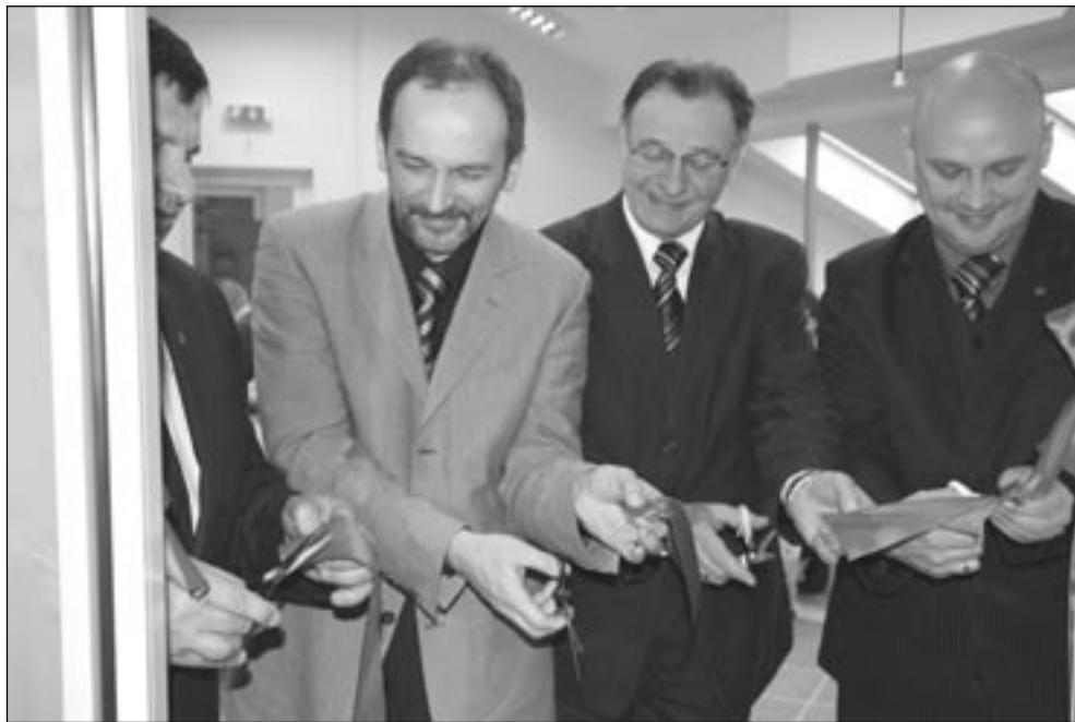
W sanockim szpitalu trwa nieustająca moda na przecinanie wstęgi. A to chyba dlatego, że wszyscy chcą w tym uczestniczyć, co wyraźnie widać na zdjęciu.

Nie można nie doceniać znaczenia ratownictwa medycznego we współczesnym świecie. W sanockiej społeczności także. – W ciągu roku do szpitalnego oddziału ratunkowego trafia 20 tysięcy osób. Cztery zespoły wyjazdowe udzielają pomocy 8 tysiącom pacjentów rocznie. W przypadku 6.800 zgłoszeń są to nagłe pogorszenia stanu zdrowia, wymagające interwencji wyspecjalizowanych służb medycznych. Nasze karetki przejeżdżają rocznie 180 tys. kilometrów. Dlatego tak zależało nam, aby poprawić warunki pracy zespołom ratownictwa. Nie mogliśmy też zapomnieć o serologii, która spełnia ogromnie ważną rolę. W ciągu roku pracownia ta wykonuje ponad 5 tysięcy badań, ratując osoby poszkodowane w wypad-