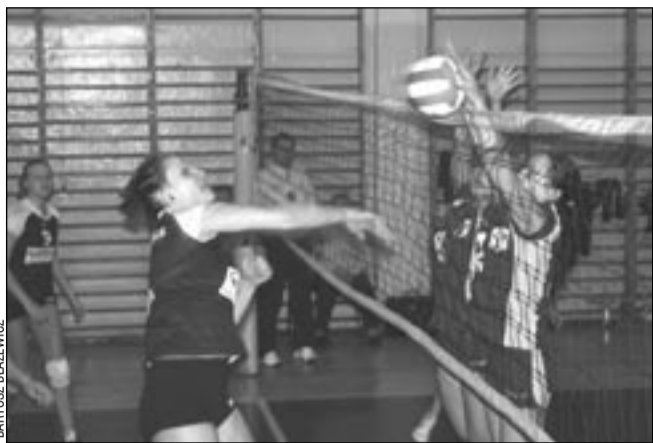
Poza nielicznymi przypadkami, siatkarki Sanoczanki (po lewej) pewnie przełamywały blok Stali Nowa Dęba.

Być może zawodniczki Sanoczanki obiecały kolegom z TSV, że skończą kwadrans przed 18, by kibice zdążyli dojechać na mecz z Anilaną. A do Zespołu Szkół nr 3 warto było