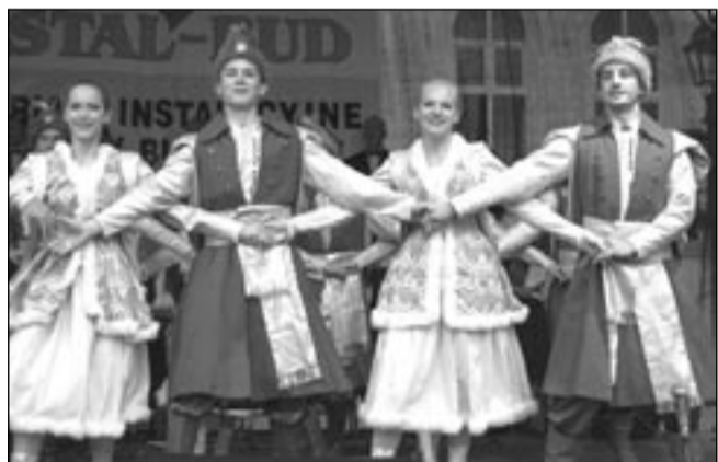
Polonez czy mazur – w staropolskich strojach tancerze ZTL „Sanok” prezentują się wyjątkowo pięknie.