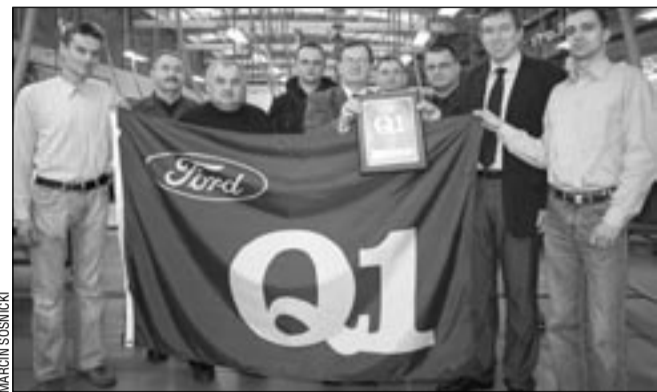
Potwierdzając przyznanie prestiżowej nagrody tablicą oraz specjalną, niebieską flagą przedstawiciele spółki odebrali uroczystie z rąk reprezentanta Ford Motor Company w ubiegłym tygodniu.