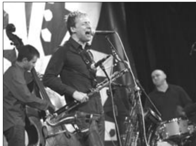
Formacja MP3 wręcz zahipnotyzowała publiczność, zgromadzoną w klubie „Górnik”.

Frekwencji jednak szkoda. Szkoda tym bardziej, że tegoroczny „Jazz bez...” nie miał słabych punktów. Muzycy zaprezentowali się w pełni profesjonalnie, program był ambitny i co najważniejsze, zróżnicowany. Miejsmy nadzieję, że za rok festiwal będzie równie udany lub jeszcze lepszy. I nie napotka konkurencji. Bo pytanie, czy dwa festiwale jazzowe w jednym czasie, to czysty przypadek, nadal pozostaje aktualne. Znamienne zresztą, że podczas