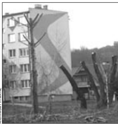
Czy to jeszcze można nazwać drzewami?