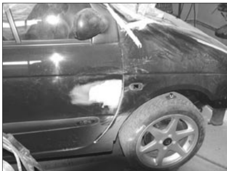
Po pierwszym remoncie auta konieczny był drugi.

w tydzień to robią, więc zostawiłam auto i 200 zł zaliczki – opowiada kobieta. – Minął tydzień, potem drugi, a auto dalej nie było zrobione. Nie było też mojej zaliczki, bo okazało się, że brat mu jej nie przekazał. Ciągłe słyszałam, że już robią, że jutro, że na pewno. W końcu pofatygował się tam mój mąż, który wrócił z zagranicy. O mało nie doszło do bitki. Pojechaliśmy z lawetą, żeby zabrać auto. Ale coś przy nim aku-