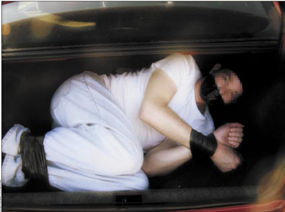
nie jest to oczywiście zdjęcie z materiałów operacyjnych policji, ale ilustracja mająca pomóc wyobrazić sobie, w jakiej pozycji prawdopodobnie przewożeni byli w bagażniku samochodu uprowadzeni przedsiębiorcy.

Policja została poinformowana o zdarzeniu późnym wieczorem. W stan pogotowia natychmiast po-