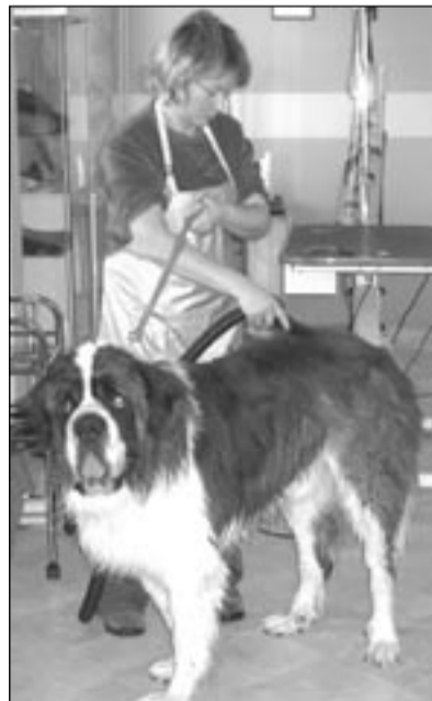
Kąpiel, kosmetyka oczu, uszu i pazurków? – proszę bardzo.