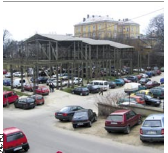
Plany inwestora, który kupił nieruchomość przy ul. Feliksa Gieli, dają nadzieję, że w niedługim czasie z księżycowego krajobrazu centrum zniknie ten mało cywilizowany parking.

Z rozmowy, jaką burmistrz przeprowadził z przedstawicielami kierownictwa ELPRO, wynika, że nabywca nieruchomości zainteresowany jest budową obiektu handlowego wraz z parkingiem, który całkowicie zmieni oblicze jednej z najbrzydszych enklaw centrum Sanoka. – Zapewniono mnie, że nie będzie to żaden tymczasowy obiekt typu „blaszak”,