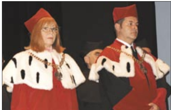
Do niedawna działali w tandemie, dziś stanęli po przeciwnych stronach barykady...