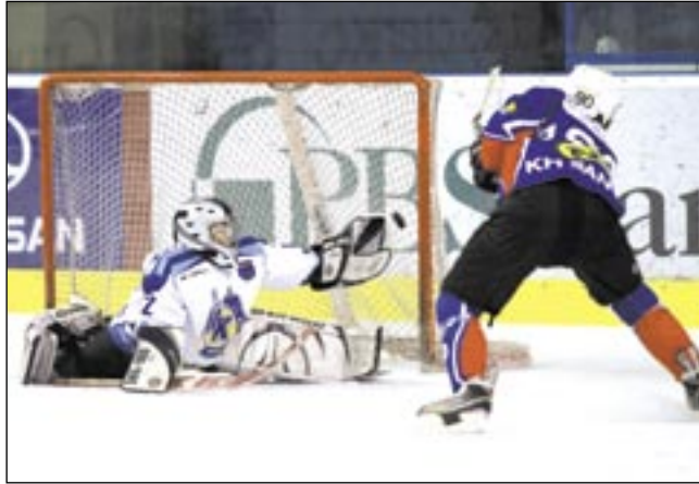
Celne strzały przeplatały się z bramkarskimi paradami.

III SANOK HOKEJ FESTIWAL. Trzydniowy turniej młodzieżowy pod dyktando drużyn MOSM Bytom. Żacy wygrali bez straty bramki, młodzikom postawili się zawodnicy Ciarko KH, tocząc walkę przez dwie tercje meczu finałowego.