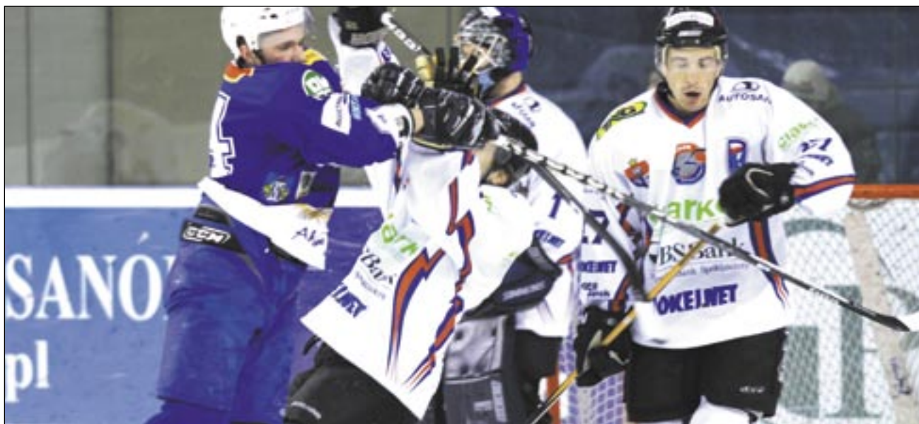
Unicy przyjęli taktykę ostrej, brutalnej gry, która nie przyniosła im powodzenia.