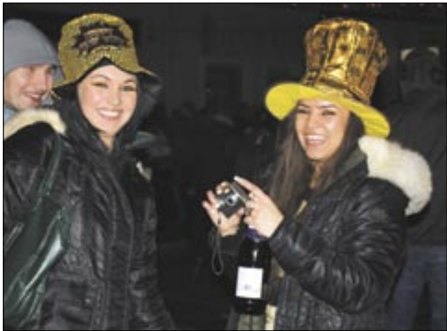
Uroczę, uśmiechnięte dziewczęta w oryginalnych złotych kapeluszach były wyjątkowo smacznym kąskiem dla fotoreportera podczas sylwestrowego balu pod gwiazdami.

Mimo wyjątkowej jak na przełom roku aury, tłumów w Rynku na tym balu nie było. Do godziny 23 liczba uczestników nie przekraczała tysiąca, dopiero zbliżająca się północ przyciągnęła ludzi, którzy docierali tu z prywatnie, co widać było po kreacjach pań. Na scenie królował zespół „One gain” i dobra muzyka w klimatach rocka, bluesa, a nawet fanky, zachęcająca do ruszania nogami, a co najmniej biodrami. Prawdziwych płasów jednak nie odnotowaliśmy. Najczęściej widokiem były roześmiane grupki młodych ludzi z butelkami szampa w rękę. Często nawet bardzo młodych, niekiedy wyraźnie już zmęczonych alkoholem i wrażeniami.