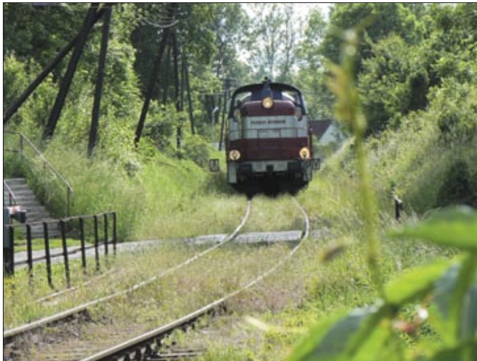
Czy ta fotografia, pstryknięta bez namysłu latem, miałaby stać się dokumentem historycznym?

Bo przecież szkoda... Szkoda czegoś, co od 125 lat wpisane było tak pięknie w sanocki pejzaż, co bez wątplenia przyczyniło się do rozkwitu Sanoka. I było jednym z ostatnich trwałych pomostów między pełnym uroku XIX wiekiem a współczesnością.