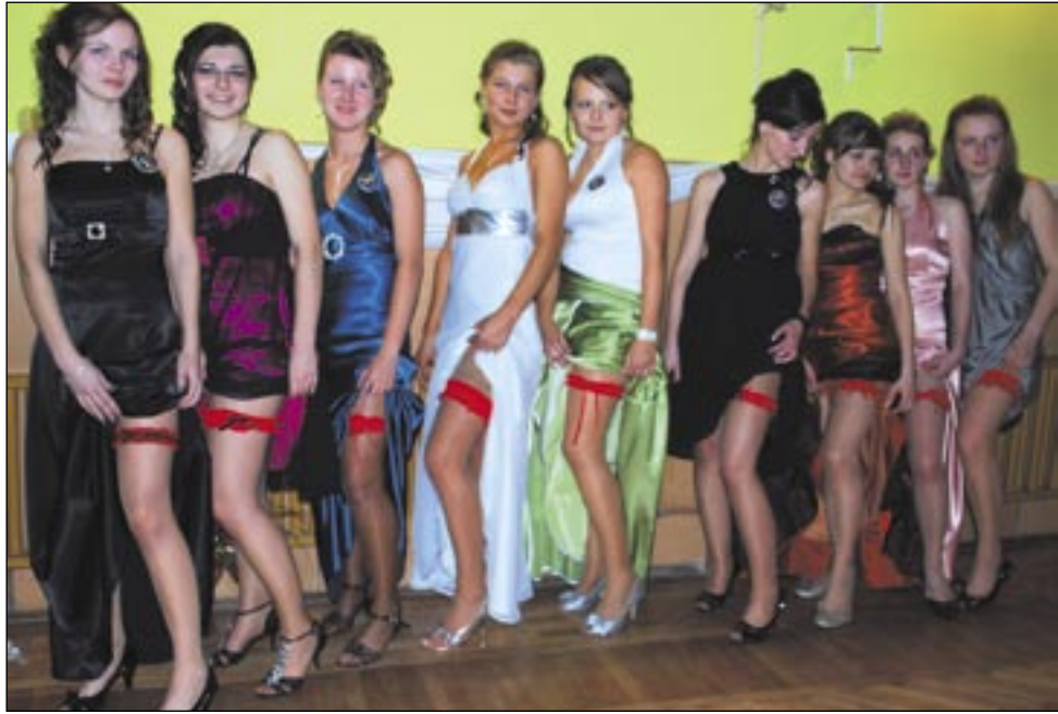
W przesady nie należy wierzyć, ale czerwona podwiązka stanowi obowiązkowy atrybut każdej maturzystki. Lepiej dmuchać na zimne...