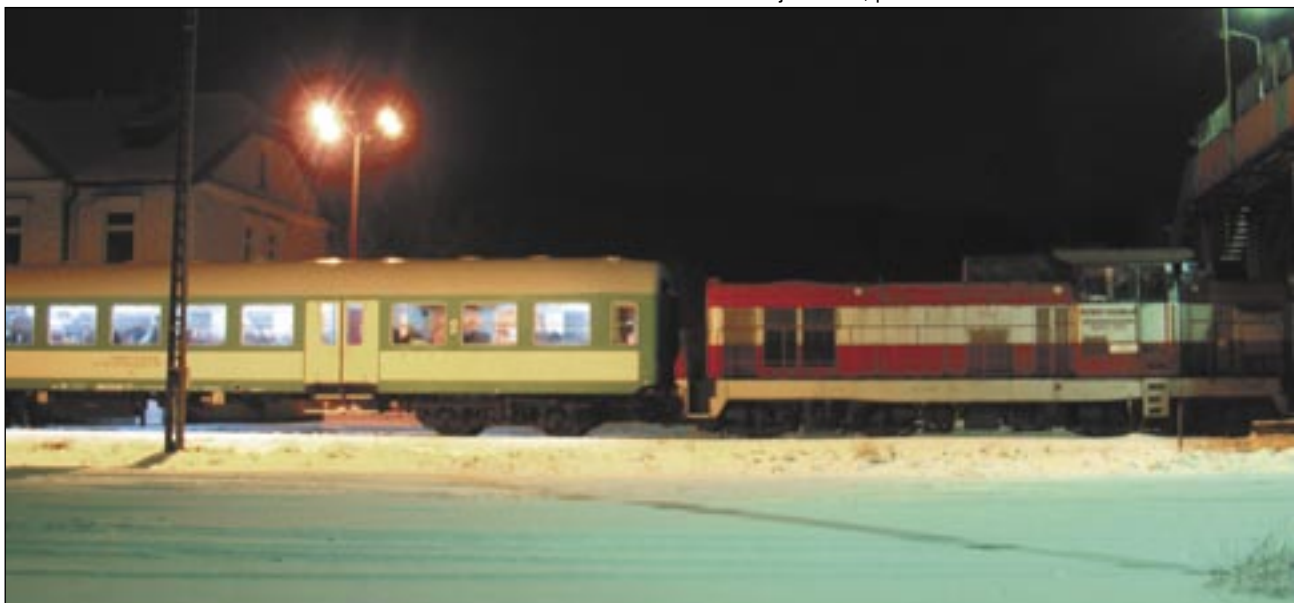
Z wydłużenia do Jasła trasy pociągu relacji Chyrów-Sanok, zwanego „przemytnikiem”, zrobiono wielkie halo. W niczym nie rozwiązało to jednak problemu zamkniętej linii Zagórz-Jasło.

Pytanie, czy jest jeszcze o co walczyć. W sobotę z Zagórzca wywieziono lokomotywy i wagony. Pociągi międzynarodowe jeżdżą lewą stroną, omijając tym samym dworzec główny. Zatrzymują się trzy kilometry dalej, w Nowym