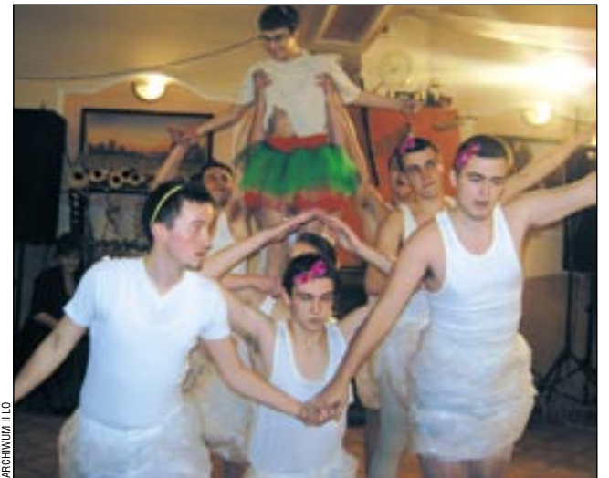
Baletowa suita w „łabędzim” wykonaniu chłopaków z IIIb ani chybi przejdzie do historii szkoły.