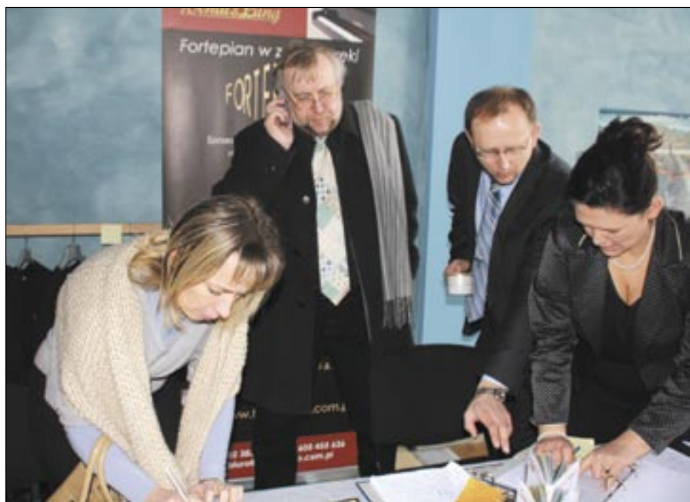
Sztab organizacyjny w akcji i co nam się szczególnie podobało: działający przy otwartej kurtynie. Macie nasze brawa!