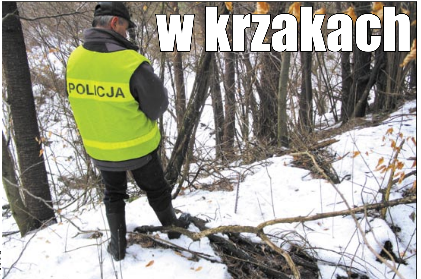
Znalezienie jakichkolwiek śladów w tak trudnym terenie jest często dziełem przypadku.