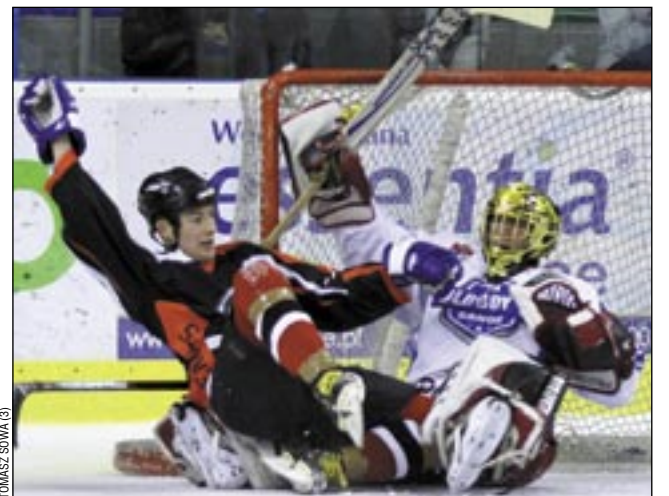
Atmosfera na lodzie była znakomita. Nawet gdy dochodziło do twardej walki, to zawodnicy podnosili się z uśmiechem na ustach.

Turniej cieszył się bardzo dużym zainteresowaniem, ostatniego dnia na trybunach zasiadło około tysiąca