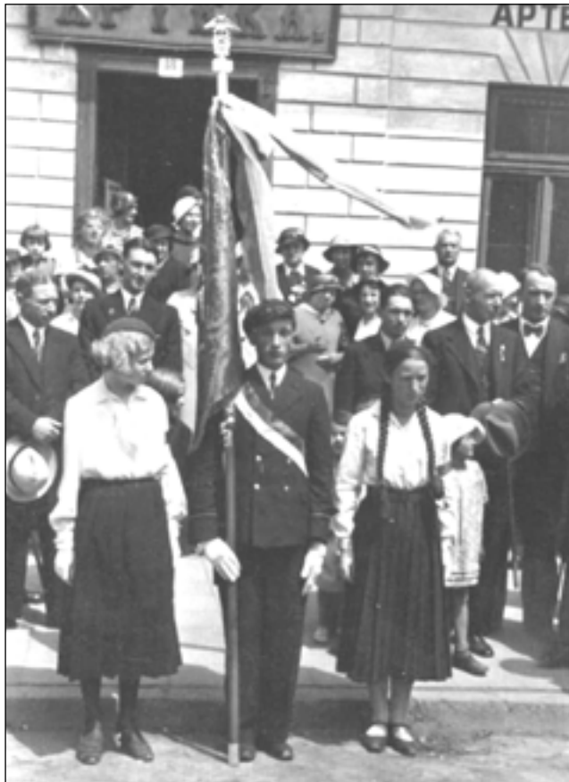
„Handlówka” miała też swój sztandar. Podczas uroczystości państwowych reprezentował on szkołę, spoczywając w ręku uczniów wybranych do pocztu sztandarowego.