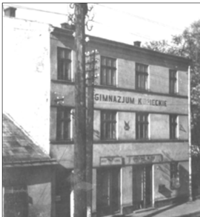
Dziś niewiele sanoczan pamięta, że tuż przed wybuchem II wojny światowej sanocki „Ekonomik” mieścił się na dwóch piętrach w wynajętej kamienicy przy ulicy Kościuszki nr 27 (za skrzyż. z ul. Sienkiewicza w kierunku na Krosno)