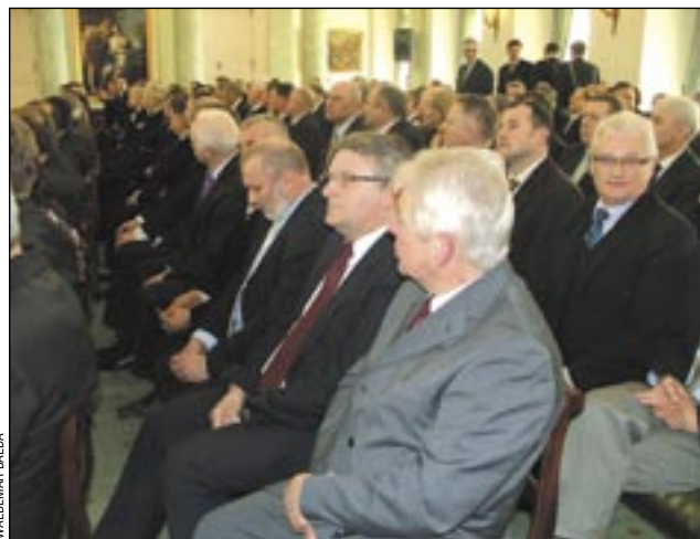
Przedstawiciele Sanoka na sali obrad.

W trakcie dyskusji w kuluarach wiele dyskutowano o możliwości wykorzystania doświadczeń sprzed stuleci w obecnej rzeczywistości, nie tylko w aspekcie kształtowania tożsamości historycznej. Gościom Pałacu Prezydenckiego imponowała głównie dynamika Kazimierzowskich zmian. Za najważniejsze uznano zgodnie rozpowszechnianie – na co zwrócił zresztą uwagę i Lech Kaczyński – świadomości, że państwo to nie tylko instytucje