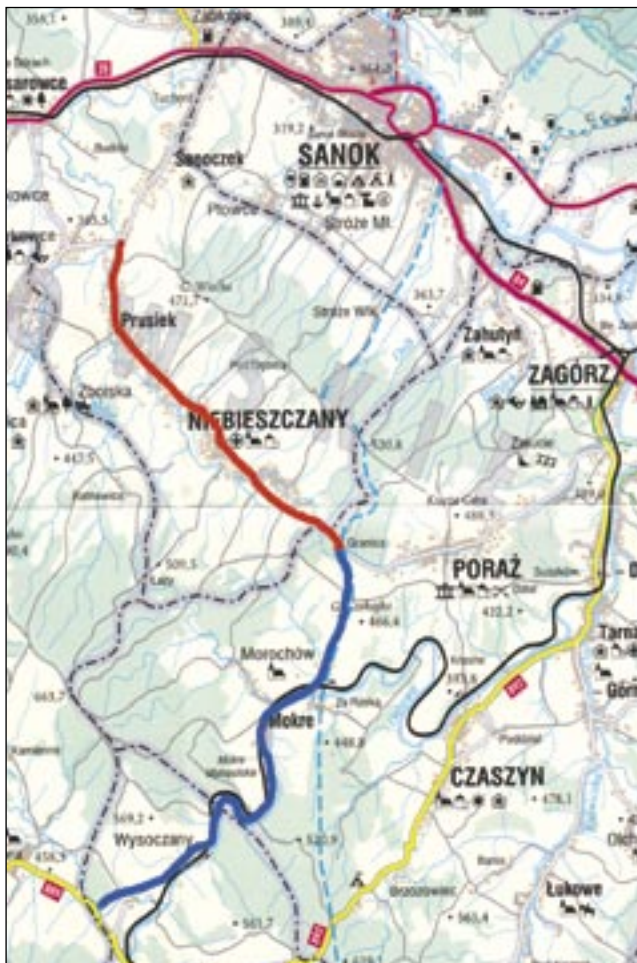
Odcinek drogi w kolorze czerwonym – zaplanowany do przebudowy, odcinek w kolorze niebieskim – nieuwzględniony do zgłoszenia w projekcie.

W tym momencie aż prosi się, aby krzyknąć: przecież ktoś