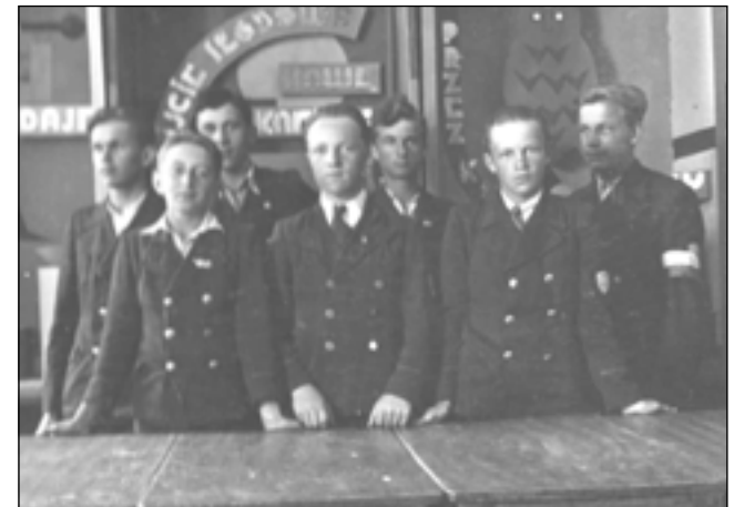
Absolwenci najstarszych roczników dumnie twierdzą do dziś, że uczniowie sanockiej „Handlówki” w swoich mundurkach prezentowali się najładniej.

Wprowadzie Szkoła Handlowa nie stała się ośrodkiem twórczości tajnych kompletów, jednak wąskie grono młodzieży (zarówno męskiej jak i żeńskiej) uczestniczyło w działalności konspiracyjnej Narodowej Organizacji Wojskowej, organizując grupę o kryptonimie „Młodzieżówka”. Grupa ta mogła liczyć 20-25 osób. Działalnością tą młodzież Handlówki dała dobre świadectwo swojej