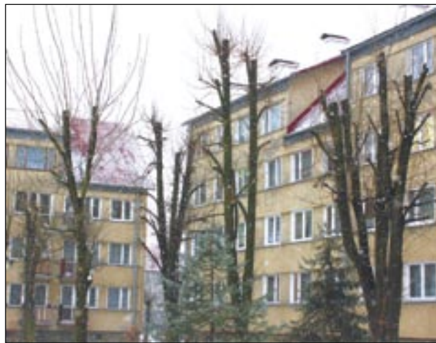
Drzewa obok bloków przy ul. I Armii Wojska Polskiego zostały ogłowione w dość zdecydowany sposób.

Temat ogławiania drzew to klasyczny „dziennikarski bumerang”. Wrócił znowu, tym razem za sprawą części mieszkańców bloków przy I Armii Wojska Polskiego, których przeraża nowy widok za oknami.