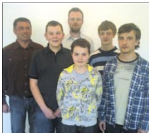
Piątka laureatów w komplecie wraz ze swoim nauczycielem.

Podczas Podkarpackich Przesłuchań uczniów klas instrumentów dętych w Mielcu głośno było o „dęciakach” z Państwowej Szkoły Muzycznej w Sanoku. We wszystkich kategoriach mieli swoich reprezentantów na podium.