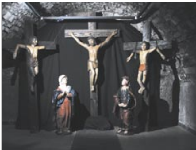
Męka Jezusa na Krzyżu – ze zbiorów Muzeum Historycznego w Sanoku.

Czas upamiętniający ostatnie dni Chrystusa, czas towarzyszenia zdradzonemu i umierają-