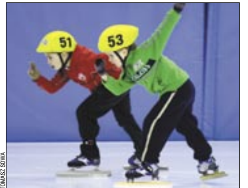
Short-trackowy narybek w akcji.