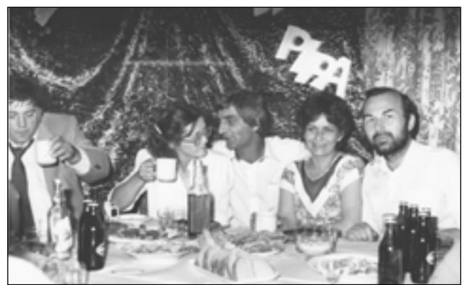
W klasowym, przyjacielskim gronie. Autorka publikacji druga z prawej. Co szkokuje, jest jedyną żyjącą osobą na zdjęciu. Pozostali przedwcześnie odeszli.

Nasze spotkania klasowe z biegiem czasu odbywały się