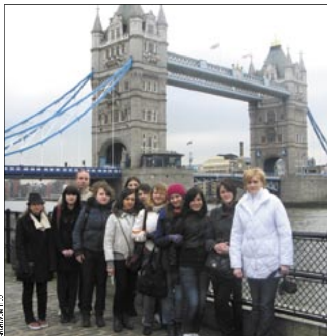
Wycieczka z II LO zwiedziła m.in. słynny Tower Bridge.

– Pierwszego dnia udało się nam zobaczyć kolekcję malarstwa w National Museum, podziwiać zabytki Westminster Abbey, London Eye, Royal Opera House i Buckingham Palace. Ciąg dalszy pobytu w Londynie wypełniony był wrażeniami ze zwiedzania Tower Bridge, Hyde Parku, Natural History Museum oraz południka „0”. Wielką