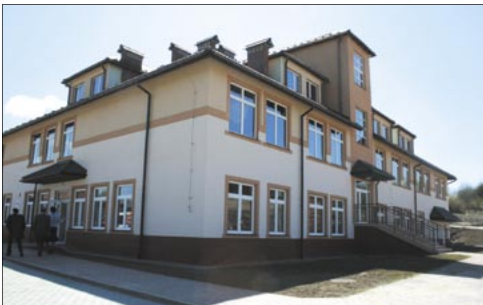
Poruszyli mózgowicą i wymyślili znakomite rozwiązanie: przeniesiemy oddział neurologiczny z Konarskiego na piętro do nowego obiektu, w którym mieści się oddział „sztucznej nerki”. Pomysł jest rewelacyjny, potrzeba tylko 4 miliony złotych, aby go zrealizować!

Organizatorzy – kierownictwo Szpitala Specjalistycznego w Sanoku oraz Starostwo Powiatowe – wytyczyli mózgi i zaproponowali bardzo ciekawy program „Tygodnia...” (12-19 marca). Inicjatywą swą zainteresowali zarówno młodzież, jak też starsze pokolenie. Uczniom sanockich szkół średnich zaproponowali temat bardzo ciekawy, zamykający się w tytule „Tajemnice mózgu”. Okazał się strzałem w dziesiątkę. Młodych ludzi nie tylko interesowała budowa mózgu i skomplikowany system przekazywania poleceń przez różne jego ośrodki, a w nich 10 miliardów komórek zwanych neuronami, ile postępy czynione w diagnostyce. – Na pewno na temat mózgu ciągle jeszcze więcej nie wiemy, niż wiemy, jednak większość tego co wiemy nauka zawdzięcza badaniom ostatnich pięćdziesięciu lat. Śmiało moż-