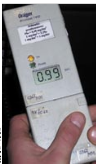
Taki wynik (0.99 mg/l to ponad 2 promile) traktowany jest jako przestępstwo, a nie wykroczenie.

Okazało się również, że kierowca fiata nie posiada uprawnień do kierowania pojazdami, a traktorzysta nie może prowadzić pojazdów z uwagi na obowiązujący go do 2012 roku zakaz wydany przez Sąd Rejonowy w Sanoku. Tym razem sąsiedzka pomoc okazała się niezbyt fortunna... /jot/