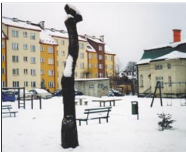
Były piękne, młode i zdrowe płaczące wierzy, pozostał po nich płacz mieszkańców do niedawna wypoczywających w ich cieniu.

W obronie dwóch takich wierzb zaprotestowali mieszkańcy bloku przy Al. Prugara-Ketlinga. Lista z podpisami wyrażającymi sprzeciw (28 podpisów na 32 mieszkania) została przekazana do SSM. – Drzewa te znajdują się w znacznej odległości od budynków, obok jest piaskownica i ławka, więc nawet wskazane byłoby, aby dawały latem trochę cienia odpoczywającym tam osobom – tłumaczono. Niestety, dokona-