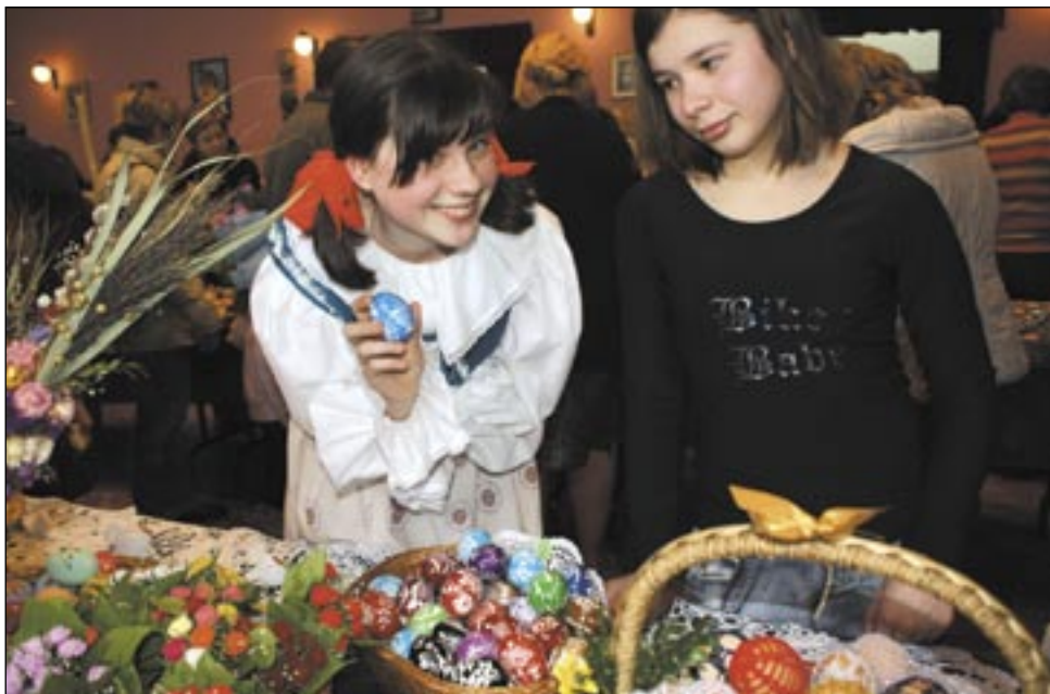
Młodzież z ZS w Strachocinie, która przygotowała inscenizację, również była ozdobą tej wystawy...