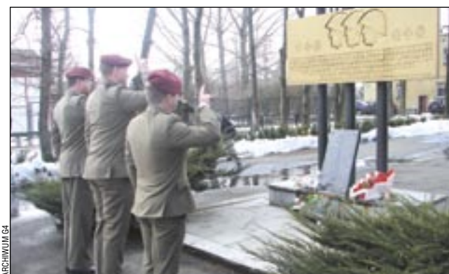
Uczestnicy uroczystości składali kwiaty pod pomnikiem 6 PDP.

W Gimnazjum nr 4 odbyła się akademie z okazji 5. rocznicy nadania szkole imienia 6 Pomorskiej Dywizji Piechoty.