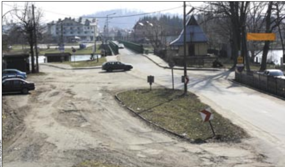
Turystyczny Sanok. Miejsce, przez które rocznie przewijają się około 100 tysięcy turystów odwiedzających nasze miasto. A my od dwóch lat nie potrafimy zlikwidować betonowego słupa i wysypki, na miejscu której można by zorganizować parking na kilkanaście samochodów.

Pozostanie jeszcze sprawa kosztów realizacji zlecenia. Jak wyliczono, sama operacja „słup” kosztować będzie ok. 15 tysięcy złotych. Pieniądze nań musi wysuwać powiat. O zlikwidowaniu wysypki nikt nie mówi, ale to wydaje się logiczne. W końcu po to m.in. likwiduje się słup. A już o tym co należałoby zrobić, aby nie wracać do tematu, kompletna cisza. Przypomnijmy, że chodzi tu o przeprofilowanie zjazdu z mostu w ulicę Rybickiego, o miejsca parkingowe, o zjazd na lotnisko i uporządkowanie całego terenu za mostem. – Tu potrzebna byłaby ja-