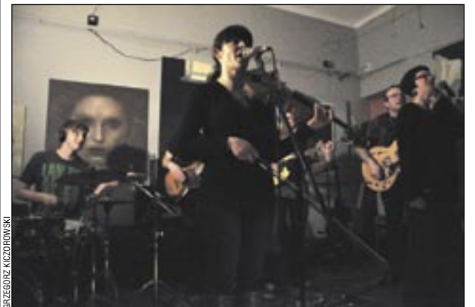
KAPELA NA DOBRY DZIEŃ na scenie Galerii.

– Odważne brzmienie instrumentów, mocny wokal i fantastyczna atmosfera wspólnej zabawy. Muzycy zaprezentowali nie tylko swoje sztandarowe utwory, jak „Stefan” czy „To i hola”, ale również nowe piosenki, które być może znajdą się na kolejnej płycie KnDD. Jedyne, czego brakowało, to miejsca do wywijania hołubców, bo przy tak skocznej muzyce nogi same rwały do tańca – dodał jeden z uczestników imprezy.