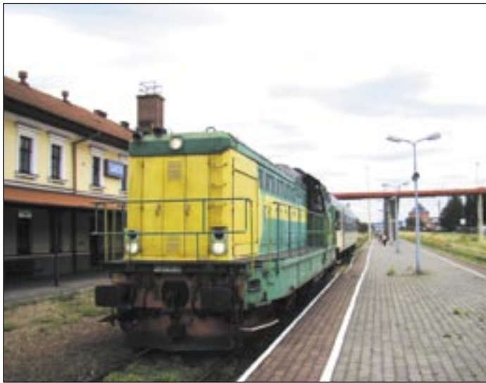
Od 1 kwietnia na trasie Zagórz-Jasło i Jasło-Zagórz kursować będą cztery pociągi. Pytanie, czy nowy rozkład jazdy zachęci podróżnych...

To nie prima aprilis. Od 1 kwietnia przywrócony zostanie kolejowy ruch pasażerski z Jasła do Zagórza i z powrotem. Radość jest jednak połowiczna. Zamiast 14 kursów, będą tylko 4. I to w godzinach niezbyt korzystnych dla uczniów i pracowników. Przynajmniej tych z Sanoka i okolicznych miejscowości.