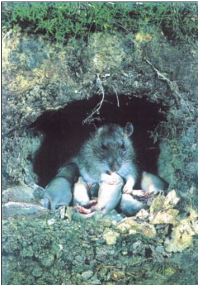
Przy sprzyjających warunkach szczury bardzo szybko się mnożą i opanowują kolejne rewiry.