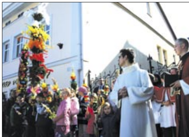
Za chwilę palmy i ich wykonawcy zostaną pokropieni święconą wodą...

Wyjątkowo barwnie prezentował się w niedzielne przedpołudnie plac przed kościołem oo. Franciszkanów na sanockim Rynku. Przyczynkiem było doroczne poświęcenie i konkurs palm wielkanocnych.