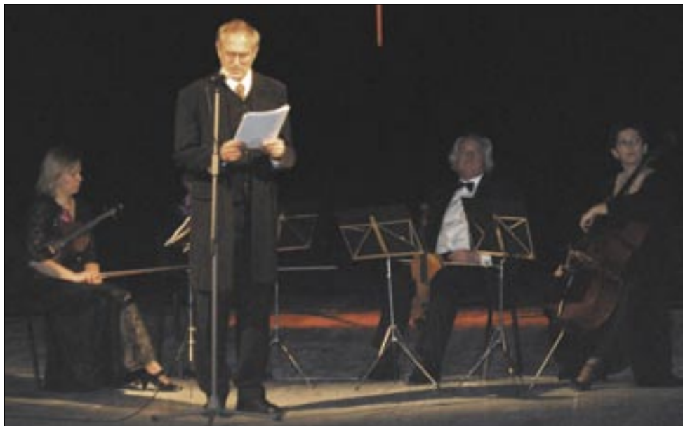
Olgierd Łukaszewicz 21 marca gościł w Sanockim Domu Kultury – wraz z Przemyskim Kwartetem Smyczkowym prezentował „Siedem ostatnich słów Chrystusa na krzyżu” J. Haydna.

– Nie chcę o tym rozmawiać, to są intymne sprawy... Powiem krótko: moje wyznanie – rzymsko-katolickie, a reszta to grzesznik, grzesznik, grzesznik.