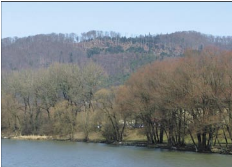
Nawet z oddali wyraźnie widać ślady wycinki na zboczu...

nych; tła, na którym zabudowa rysowała się wyjątkowo malowniczo. Od kilku jednak lat w lesie, pokrywającym łańcuch wyniosłości od Międzybrodzia za Olchowce, zaczęły pojawiać się wyrwy: i na graniach, które zamiast być zwieńczone jednolitym pasem drzew, koronuje w wielu przypadkach niespójny grzebień przerzedzonych okazów, ale zwłaszcza