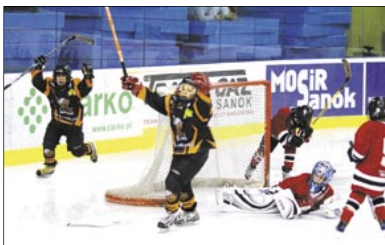
Najbardziej ulubionym momentem Niedźwiadków jest podniesienie w górę rąk po strzeleniu bramki. A już uczynienie tego w pojedynku z prawdziwymi Kanadyjczykami wyjątkowo smakuje.

Po raz pierwszy w historii Sanok gościł hokeistów z Kanady. Przyjechali ze słowackiego Bardejowa, z którym utrzymują kontakty sportowe. A że Niedźwiadki często goszczą na Słowacji, udało się im przejąć na jeden dzień atrakcyjnych rywali. Nic też dziwnego, że podejmowali ich z fasonem, rozpoczynając mecz od odegrania hymnów państwowych. A potem ruszyli do boju! Wysokie zwycięstwo sanocznan może niejednego zdziwić, warto jednak wiedzieć, że Niedźwiadki, mimo iż liczą dopiero 9-10 lat, uprawiają hokej już od 3,4 lat, więc radzą sobie całkiem