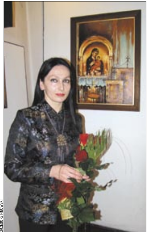
Artystka podczas wernisażu w galerii „Atelier”.

„Magiczne Bieszczady” nie są jej pierwszą wystawą indywidualną – choć pierwszą w Krakowie. Swoje prace prezentuje publicznie od dwunastu lat, m.in. miała ekspozycje w Rzeszowie, Szczecinie, Suchoj Beskidzkiej, Iwoniczu-Zdroju, Brzozowie. A w Sanoku?