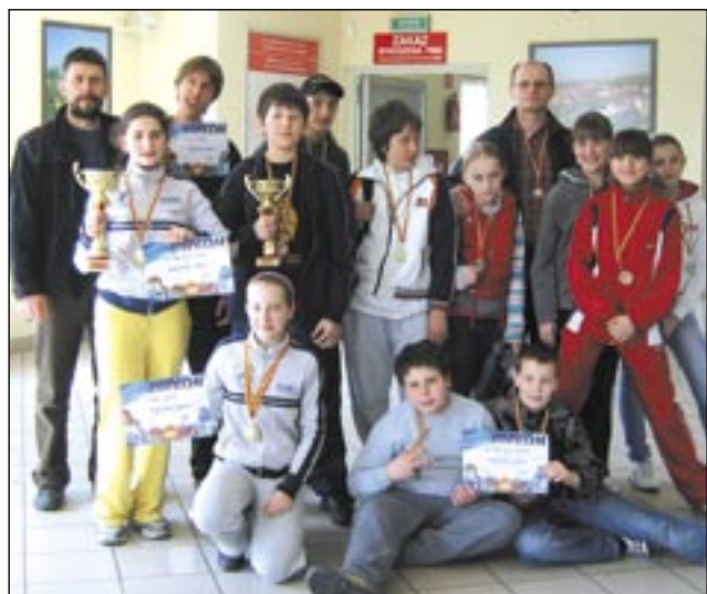
Sanockie drużyny łyżwiarskie wraz z opiekunami.