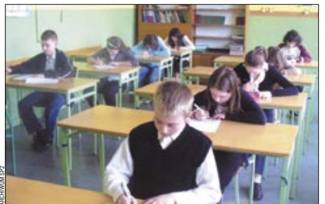
Zmagania z Bykiem Ortografem wymagały nie tylko znajomości reguł, ale i umiejętności ich praktycznego zastosowania.

W drużynowej części turnieju, aby pokonać trzygłowego potwora – Byka Ortografę, uczestnicy zmagani musieli wykazać się znajomością reguł