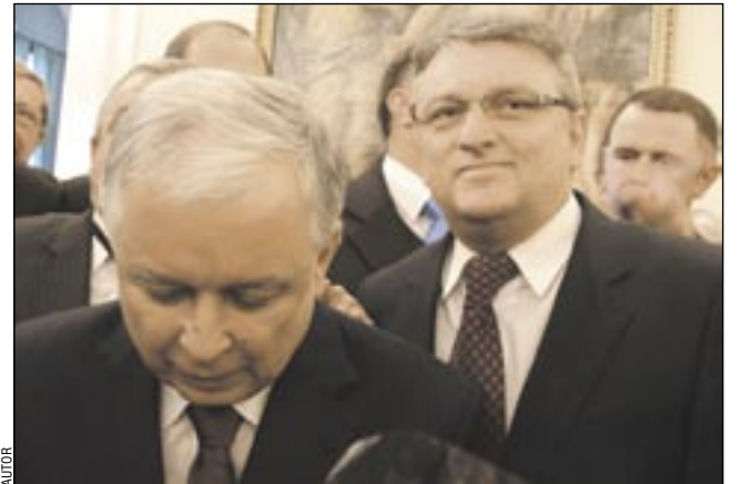
Jedno z ostatnich zdjęć Prezydenta Lecha Kaczyńskiego.