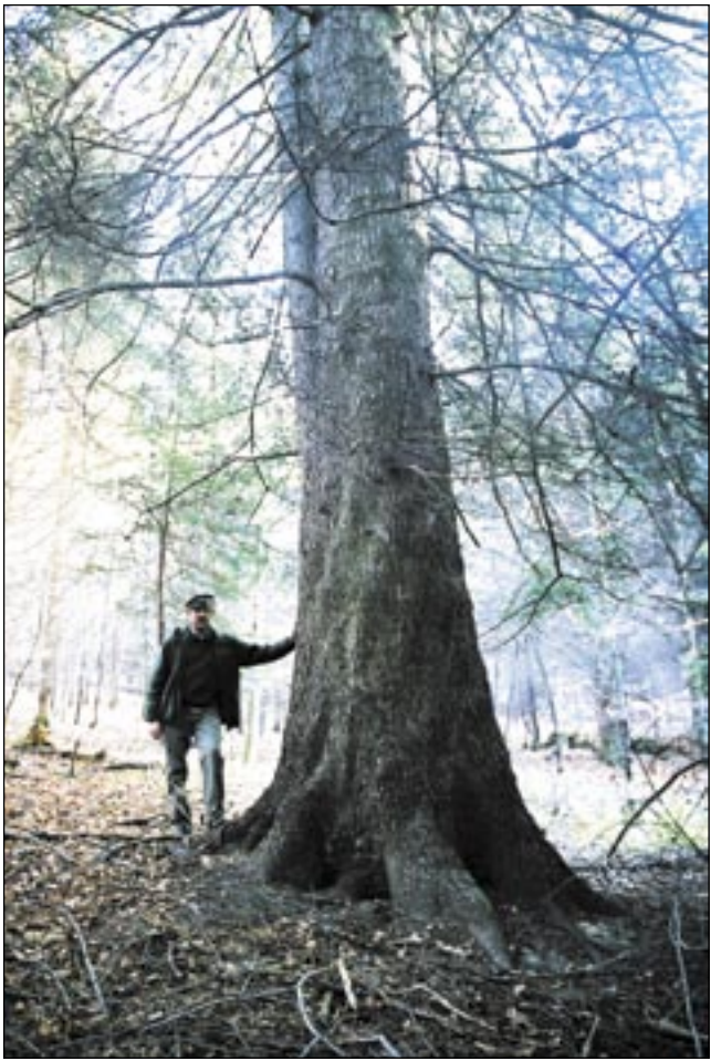
Pomnikowa jodła w rezerwacie Polanki to żywy świadek dawnego składu gatunkowego lasów w okolicy Sanoka.

Taka właśnie jest historia lasów w tej okolicy, opisana również w dokumentacji leśnej. Jednak celowo nie powołuję się na zapisy planu urządzenia lasu Nadleśnictwa Brzo-