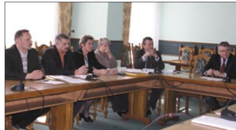
Przedstawiciele Urzędu Miasta proponowali odkupienie 28-arowego arealu gruntów pod częścią b. lodowiska. Działacze „Sokoła” mają inną wizję tego terenu.