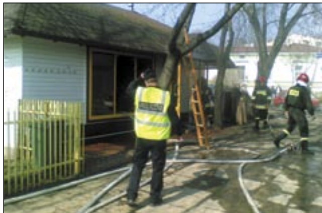
Choć ogień udało się dość szybko ugasić, straty okazały się znaczne.

W ubiegły piątek (9 bm.) tuż po godzinie 10 doszło do pożaru w saloniku odzieżowym przy skrzyżowaniu ulicy Jagiellońskiej z Konarskiego.