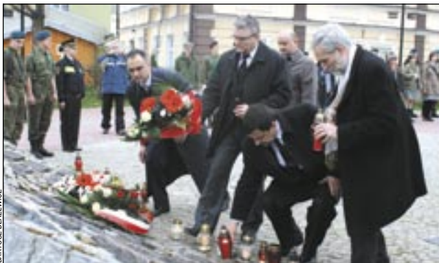
Kwiaty pod pomnikiem „Synom Ziemi Sanockiej” złożyła m.in. wspólna delegacja władz miejskich i powiatowych.

Ogrom tragedii sprawił, że odwołano cały poniedziałkowy program, zawierający prelekcje, wystąpienia i inscenizacje oraz rozstrzygnięcie konkursów i wręczenie odznaczeń. Pozostawiono tylko oddanie hołdu w miejscach pamięci narodowej. Delegacje władz oraz wielu instytucji i organizacji złożyły wieńce i wiązanki kwiatów – najpierw pod Krzyżem „Golgota Wschodu” na Cmentarzu Centralnym, a następnie pod pomnikiem