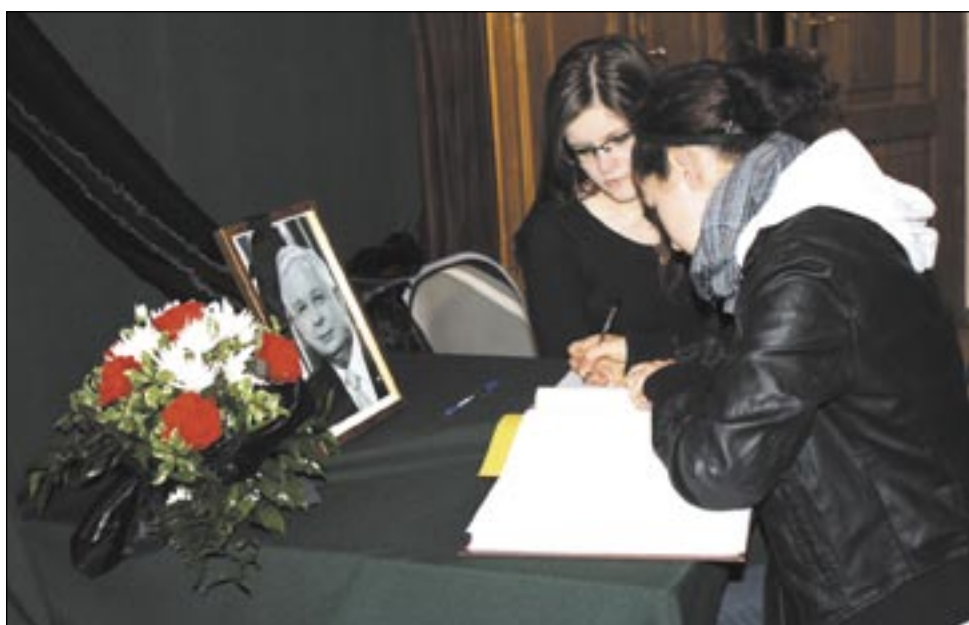
Budujące, że do Księgi Kondolencyjnej wpisują się nie tylko osoby starsze, ale i ludzie młodzi, którymi tragedia pod Smoleńskiem wstrząsnęła równie mocno.

– Wpisy są bardzo różnicowane – od krótkich po zajmujące nawet i pół strony. Część to wypowiedzi o starannie przemyślanej formie, nierzadko z cytatami, inne mają bardzo emocjonalny