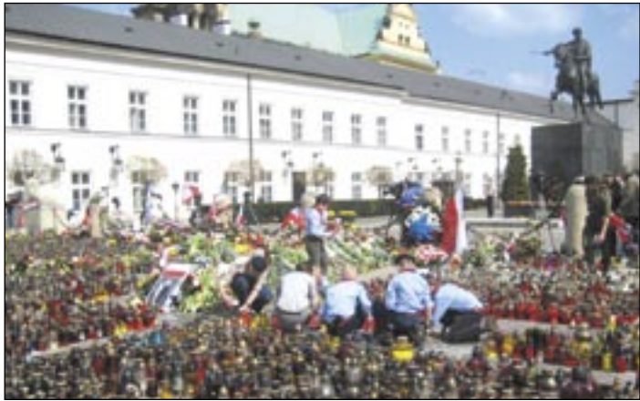
Dziedziniec Pałacu Prezydenckiego tonie w zniczach i kwiatach.