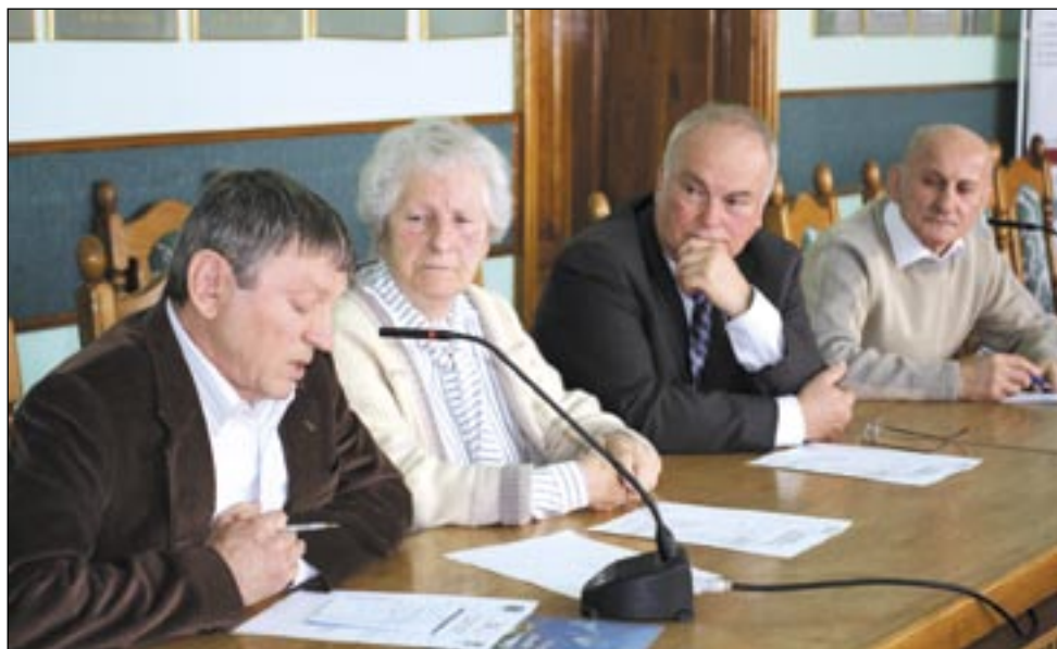
Po dłuższej przerwie działacze Towarzystwa Gimnastycznego „Sokół” powrócili do rozmów. Wynika z nich, że będą one trwać jeszcze długo. Sportowy skansen przy ul. Mickiewicza nabiera walorów.