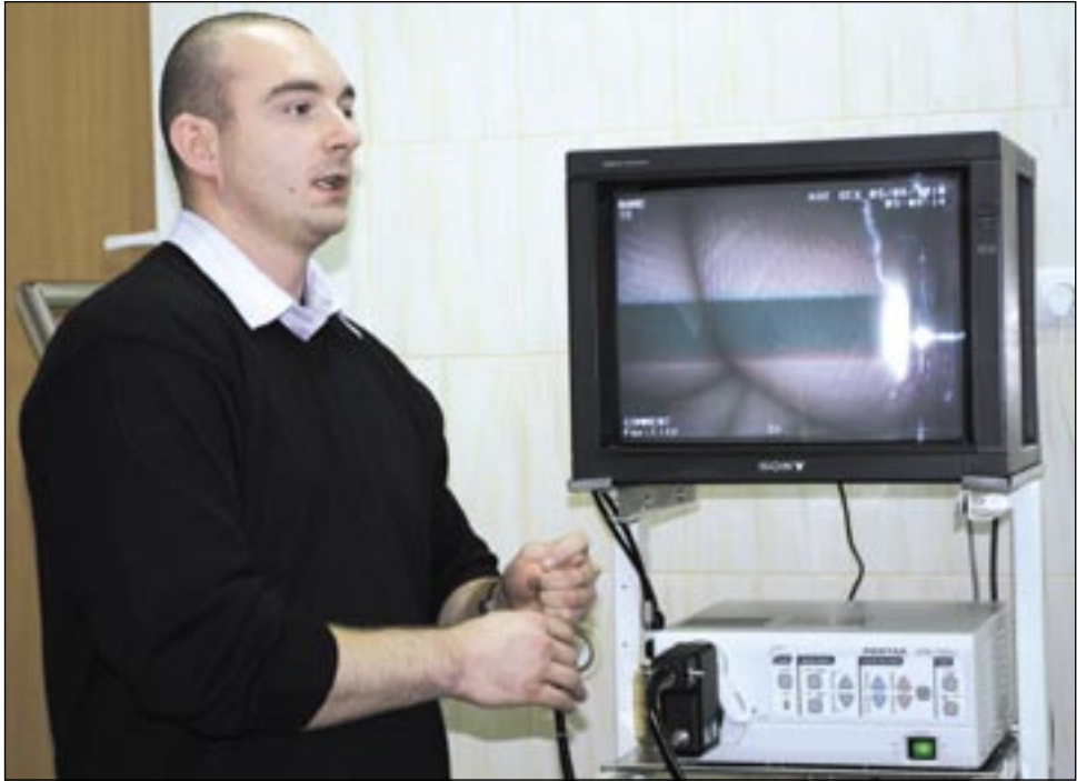
Prezentacja nowego videogastroskopu w wykonaniu przedstawiciela firmy wzbudziła duże uznanie dla najnowszego wyrobu japońskiej Pentaxa.

Należy jeszcze podkreślić, że zadbano, aby ten nowoczesny sprzęt spoczywał w rękach wykwalifikowanych lekarzy. Jest młoda, zdolna kadra, dla której