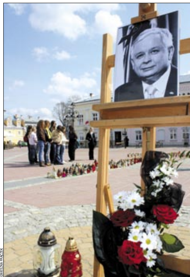
Sanocki Rynek stał się miejscem pamięci Ofiar katastrofy pod Smoleńskiem. Sanoczanie przychodzą tu, aby oddać hołd tym, którzy w niej zginęli, zapalić znicze pamięci.

Patrzę na szczątki dopalającego się samolotu, kryjące blisko sto ludzkich ofiar. Pochylam nad nimi swoją głowę. Na Wawelu odezwał się dzwonn Zygmunt, z całego świata płyną depeşe kondolencyjne. Na pierwszym planie wymienia się w nich osoby Prezydenta i Jego Małżonki. Prezydent służył Polsce,