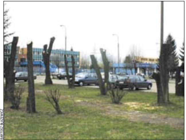
Czy tak powinny wyglądać drzewa po zabiegach pielęgnacyjnych?