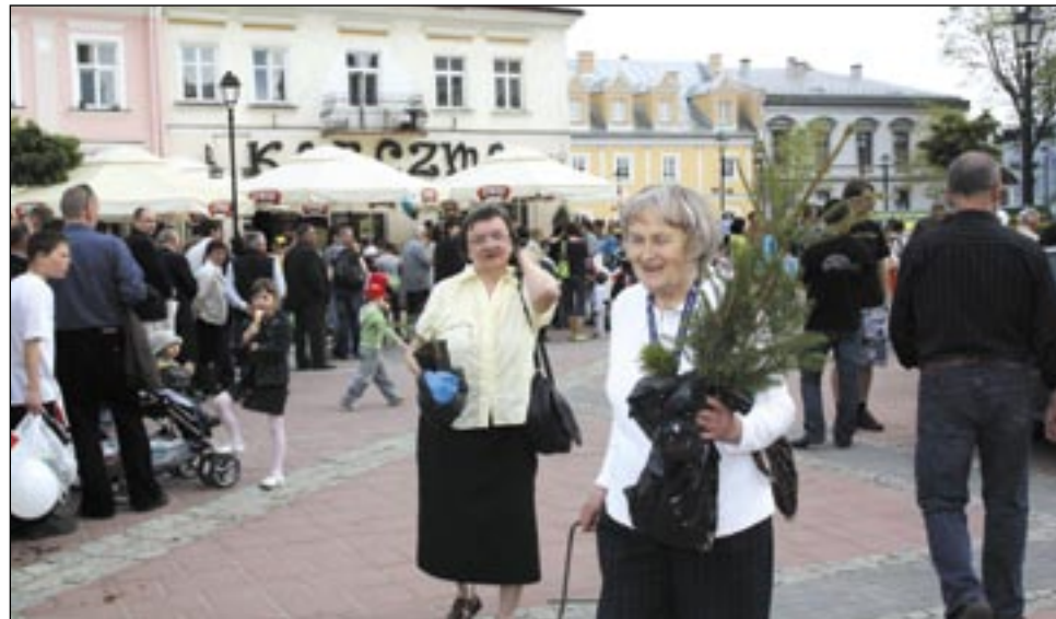
Dzieci, rodzice, babcie, dziadkowie, wszyscy przyszli na Rynek z siatkami wypchanymi surowcami wtórnymi, a po ich zdaniu wracali z sadzonkami drzew i krzewów. Piękna, pożyteczna lekcja ekologii. Brawa dla babć i ich wnucząt!

– Nie wiem, czy jakakolwiek gwiazda wyrwałaby mnie z domu w taką pogodę – mówiła po występie, chcąc w ten sposób odwdziżyć się uczestnikom koncertu za tak liczny udział, mimo ulewy i tak świetną zabawę. Nie kryła też uznania dla organizatorów. – To fajny pomysł na imprezę ekologiczną z przesłaniem. Lubię takie koncerty, gdyż skupiają ludzi, którym na czymś zależy. Za tym kryje się coś więcej niż zwyczajne dni miasta, podczas których najczęściej dochodzi do takich koncertów – oświadczyła. A jak kochają Majkę jej sanocki fani, niech świadczy fakt, że o ile koncert trwał jedną godzinę z kwadrantem, to rozdawanie autografów i wspólne zdjęcia zajęły artystce blisko dwie godziny. Można tylko wyobrazić sobie, co by się działo na sanockim Rynku, gdyby koncert Majki Jeżowskiej odbywał się przy dobrej pogodzie. Warto by to kiedyś sprawdzić.