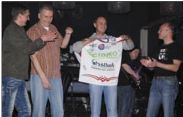
Koszulka z podpisami hokeistów wylicytowana została za 1200 zł.