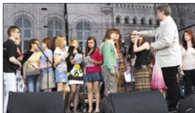
Zespół wokalno-instrumentalny Młodzieżowego Domu Kultury zaskoczył wszystkich. W krótkim czasie placówka ta dorobiła się swojej artystycznej wizytówki.

ruszyła. Do kontenera zaczęły wpadać aluminiowe puszki, butelki, stoiki, „pety” i makulatura, do odrębnego pojemnika zużyte baterie. Po wypełnieniu zadania uczestnicy akcji podchodzą do miejsca, w którym zgromadzono sadzonki drzew i krzewów. Tu już czekają na nich członkowie Ligi Ochrony Przyrody, pomagając w dokonaniu wyboru i podawaniu sadzonek. Są to dzie-