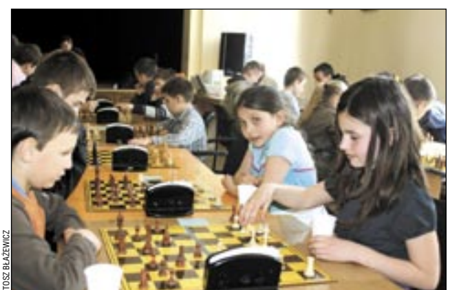
W starciu Sanok-Krosno górą goście.