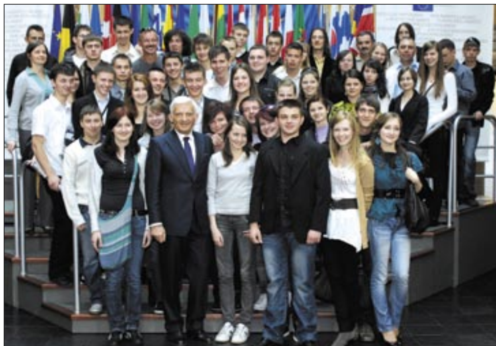
Wspólna fotografia z przewodniczącym Europarlamentu Jerzym Buzkiem pozostanie pamiątką na całe życie.