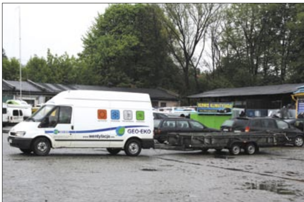
Już po samej ilości samochodów parkujących przed firmami mieszczącymi się na terenie Inkubatora można powiedzieć, że ten ma się całkiem dobrze. Bo tak się ma!

Sanocka Izba zrzesza 85 podmiotów gospodarczych, głównie małych i średnich przedsiębiorstw, ale nie tylko. Członkami Izby są także takie firmy jak: PGNiG – oddział w Sanoku, czy banki: PBS i PEKAO. RIG wspiera swoich członków, gdy potrzebują oni pomocy, organizuje konferencje i szkolenia, opracowuje projekty służące rozwojowi przedsiębiorczości, organizuje doroczny prestiżowy konkurs na „Firmę, Produkt i Człowieka Roku”. Może też poszczycić się otwartym sercem skierowanym do tych, którzy tego serca potrzebują. Mowa tu o akcji pn. „Słoneczny dzień od przyjaciel-