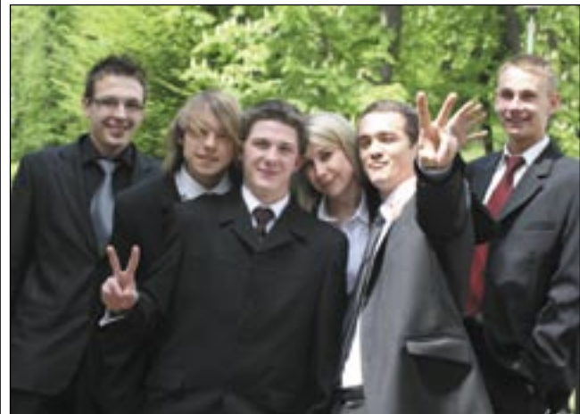
Maturzyści z II LO bardziej obawiali się matematyki niż języka polskiego: – Liczymy, że jako nowicjuszom dadzą nam trochę forów...

W czwartek maturzyści zdawali pisemnie język obcy, w kolejnych dniach – egzaminy ustne i pisemne z wybranych przedmiotów dodatkowych. /joko/