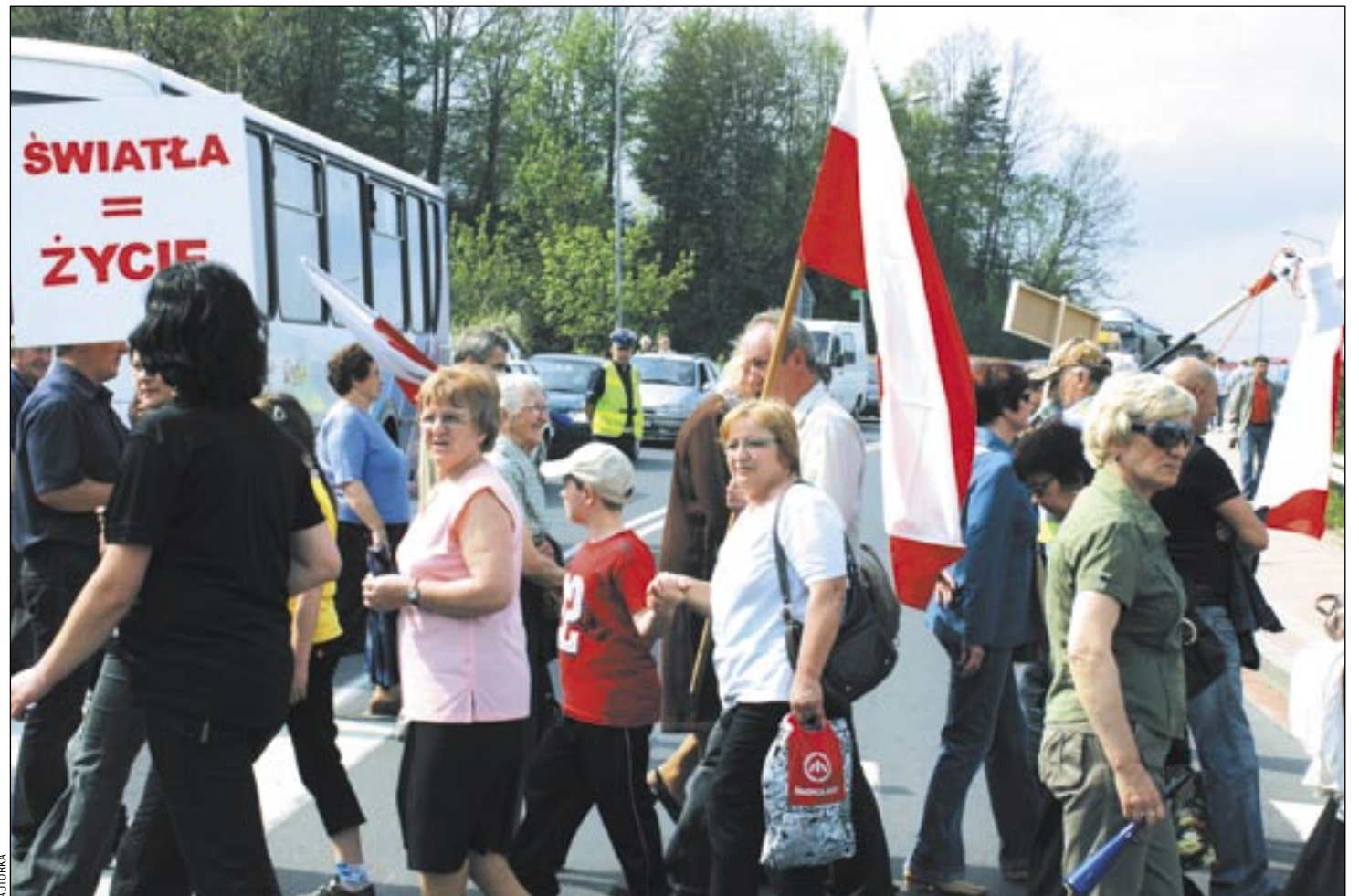
Dla mieszkańców Zagórze światła na tym skrzyżowaniu to sprawa życia lub śmierci. W proteście uczestniczyli solidarnie bez względu na wiek, status społeczny i zapatrywania polityczne.