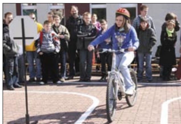
W dniu otwarcia miasteczko ruchu drogowego przy szkole w Strachocinie tętniło życiem. W przyszłości dzieci z pewnością będą chętniej uczyły się przepisów ruchu drogowego i zdobywały karty rowerowe. I o to chodzi!

Trzecie – po Besku i Kostarowcach – miasteczko ruchu drogowego powstało przy Zespole Szkół w Strachocinie.