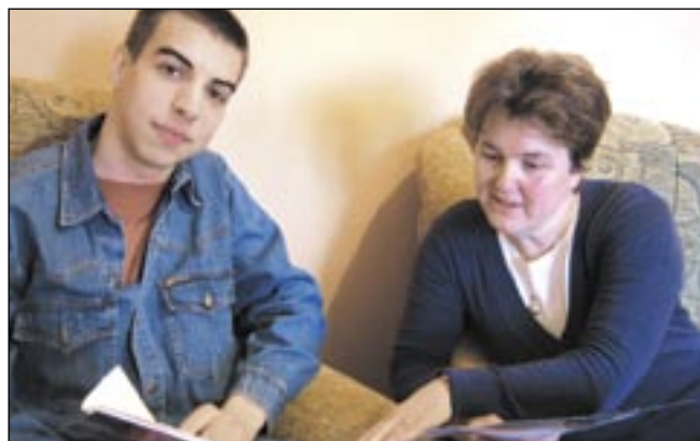
Laureat olimpiady, zwycięzca konkursów, stypendysta Krajowego Funduszu na Rzecz Dzieci. Na zdjęciu – z profesorką Wojtowicz.

Chłopak ma świetne pióro. W ubiegłym roku, podczas kwalifikacji do etapu okręgowego Olimpiady Literatury i Języka Polskiego, napisał jedną z najlepszych prac na Podkarpaciu; podobnie było w tym roku. – Zgłębiając temat apokryfów w literaturze dawnej i współczesnej, nawiązał nawet współpracę