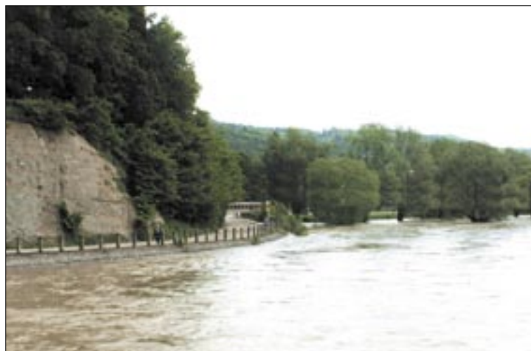
Tak wysokiego poziomu wody w Sanie dawno nie było. Przed dwoma tygodniami sięgał on podczas kulminacji 3,95 m, tym razem 4,39 m.

Intensywne opady deszczu, jakie niebo zesłało nam od poniedziałku, ponownie postawiły na nogi powiatowe, miejskie i gminne zespoły zarządzania kryzysowego. Poziom wody w Pielnicy, Oslawie i Sanie podniosły się tak bardzo, iż we wtorek o godz. 23 ogłoszono alarm powodziowy w mieście oraz gminach Sanok, Zagórz i Zarszyn.