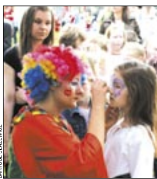
Taki makijaż chciała mieć każda dziewczynka.

Podczas pikniku dzieci zabawiła dwójka klaunów z teatru