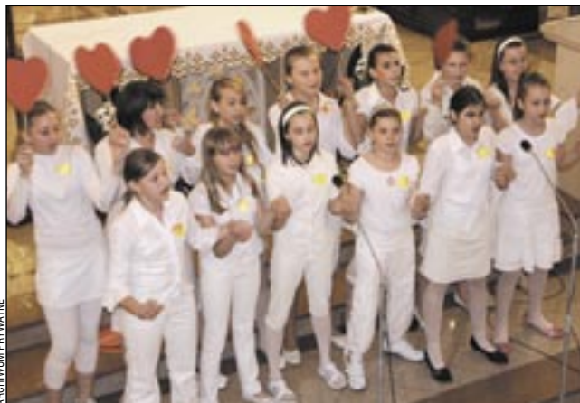
Udział w koncercie finałowym to wielkie przeżycie dla wszystkich wykonawców.

W niedzielę, w kościele parafialnym, odbył się koncert laureatów VI Konkursu Piosenki Maryjnej. Towarzyszyła im Diakonia Muzyczna oraz Chór św. Cecylii, działający przy parafii.