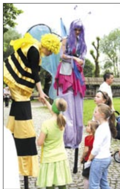
Urokiwa Pszczołka Maja i zwiewny Motylek były jedną z większych atrakcji.

Tradycji stało się zadość – impreza w skansenie nie mogła obejść się bez deszczu. Mimo kapryśnej pogody w niedzielnym Eko Plenerze – ekologicznej imprezie z okazji Dnia Dziecka – wzięło udział około 1500 osób.