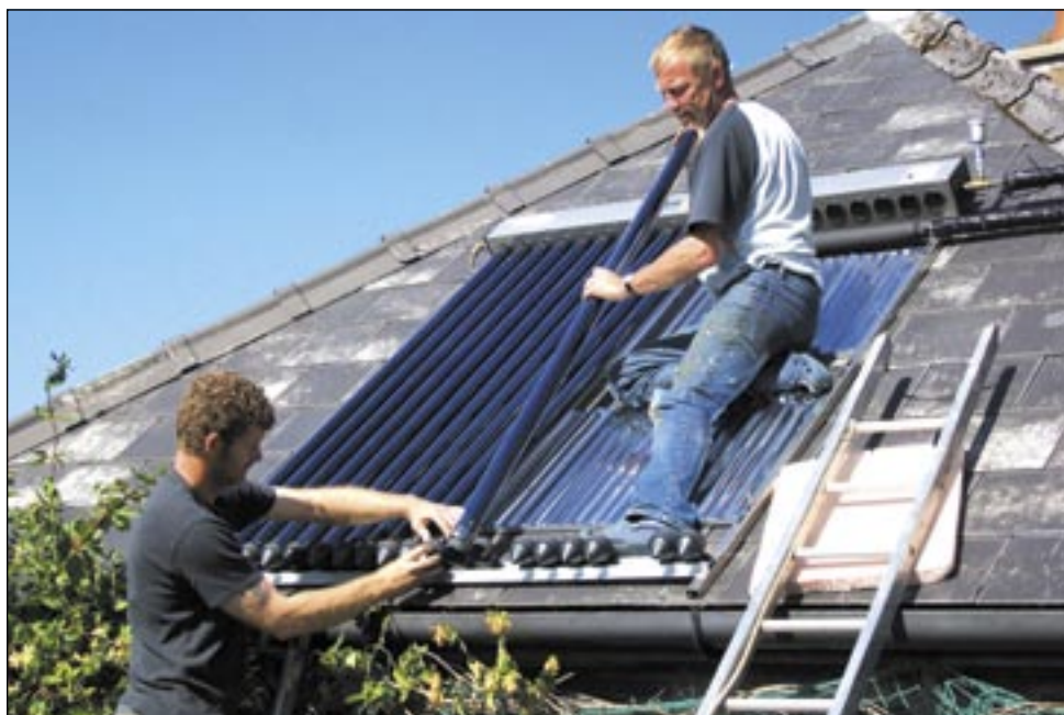
To, co dla jednych wydaje się banalnie proste, dla drugich urasta do rangi problemu... Na zdjęciu – montaż solarów.

Właściciel firmy zajmującej się sprzedażą i montażem solarów z terenu powiatu sanockiego (proszący o anonimowość) nie kryje zdziwienia. – Solary to dość lekkie urządzenia, które udźwignie każdy dach – stwierdza. Na domach prywatnych zakłada się zazwyczaj kilka paneli, na większych budynkach typu hotel kilkanaście, czasem wię-