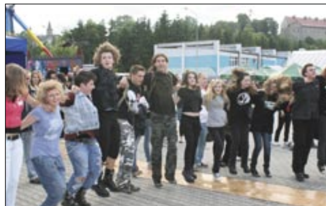
Spontaniczna zabawa była stałym elementem Juwenaliów.

Studenci Państwowej Wyższej Szkoły Zawodowej od czwartku do niedzieli mieli Juwenalia. Było trochę sportu, dużo muzyki i masę innych atrakcji. I wspólny mianownik imprez – dobra zabawa.