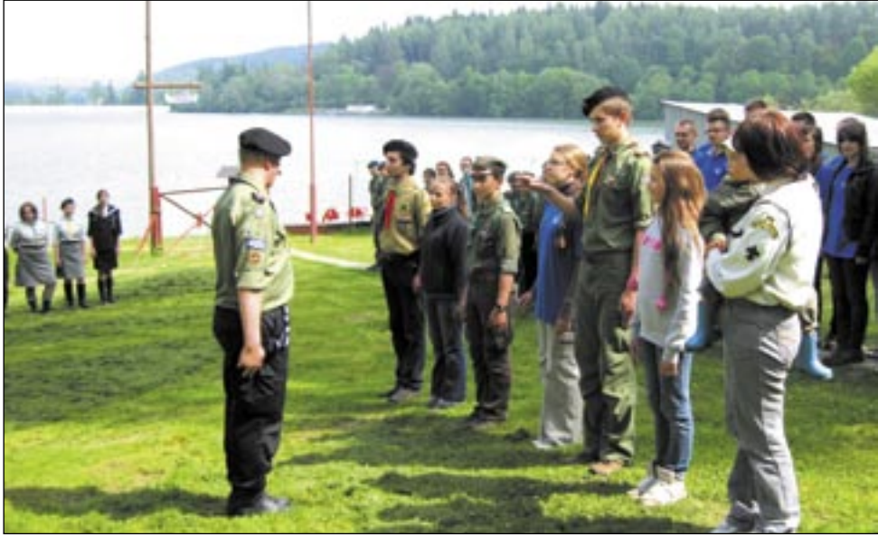
Niskie ukłony dla sanockich harcerzy, którzy już po raz dwudziesty pierwszy zorganizowali sympatycznego i pożytecznego „Florka”, zarażając swoim entuzjazmem ludzi z całej Polski

Już po raz 21. (brawa za wytrwałość!) sanoccy harcerze zaprosili rówieśników do udziału w Harcerskiej Akcji Ekologicznej FLOREK. Do realizacji zadań przystąpiły dwadzieścia trzy środowiska z całej Polski. Obok drużyn i miłośników przyrody z Podkarpacia, florkowe zadania realizowały także grupy z Łodzi, Warszawy i Poznania.