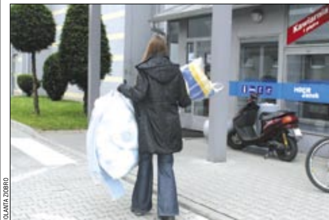
Powodzi nie widać już w telewizji, co nie znaczy, że problem zniknął. Ludzie pozostali sami ze swoimi dramatami i bezradnością – w zniszczonych domach, pozbawieni dorobku życia. Doświadczenie uczy, że na pomoc państwa specjalnie nie mogą liczyć. Dlatego tak bardzo ważna jest nasza solidarność, wrażliwość i pomoc, która będzie potrzebna poszkodowanym jeszcze bardzo długo. Punkt zbiórki darów w MOSiR będzie działał do odwołania akcji przez burmistrza.

Miasto, przy pomocy sponsorów, zorganizowało też „zieloną szkołę” dla trzydziestu gimnazjalistów i ich opiekunów z Jasła. – Gościliśmy ich przez tydzień, zapewniając zakwaterowanie, wyżywienie oraz różne atrakcje – mówi wice-