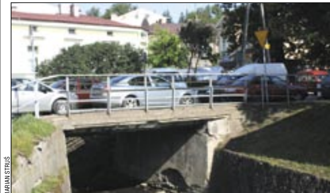
Wydaje się, że wcale nie trzeba powodzi i wielkiej wody, aby most na Konarskiego wpadł do potoku. Odpukać w żardzewiałą barierkę mostu!

ry został podmyty podczas powodzi. A prowadzi przezeń główna droga do szpitala powiatowego, wielu instytucji i zakładów pracy oraz na osiedle domów prywat-