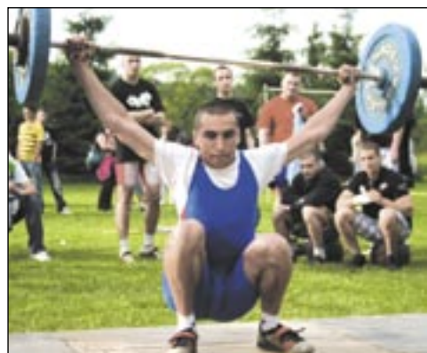
W Tarnawie Dolnej. Znowu dali tam pokaz podnoszenia ciężarów, były też zawody w trójboju siłowym dla kobiet.

Sztangści kontynuują współpracę ze szkołą w Tarnawie Dolnej. Znowu dali tam pokaz podnoszenia ciężarów, były też zawody w trójboju siłowym dla kobiet.