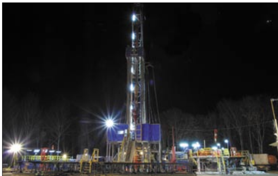
Podkarpackiej „nafty” czar. Na zdjęciu: urządzenie wiertnicze krakowskiej spółki wiertniczej PniG w okolicach Pakoszówki.

– To brzmi bardzo groźnie. Podstawą do działalności na naszym rynku jest uzyskanie koncesji, wydawanych przez Ministra Środowiska. Do tej pory na terenie Polski wydano 55 takich zezwoleń, a wśród ich posiadaczy są