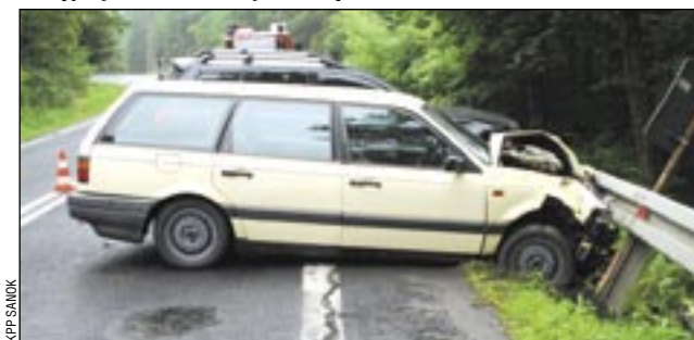
Dwa autka zderzyły się ze sobą i obydwa bardzo ładnie ustawiły się przy barierze. Dobrze, że była... /jot/

Ze sporymi utrudnieniami w ruchu musieli liczyć się kierowcy, którzy w poniedziałkowe przedpołudnie poruszali się drogą krajową Sanok-Lesko. Ich przyczyną był wypadek, do którego doszło tuż przed godz. 9 w Zagórze. W wyniku zderzenia dwóch samochodów osobowych droga przez godzinę była całkowicie zablokowana, a przez kilka następnych ruch odbywał się wahadłowo.