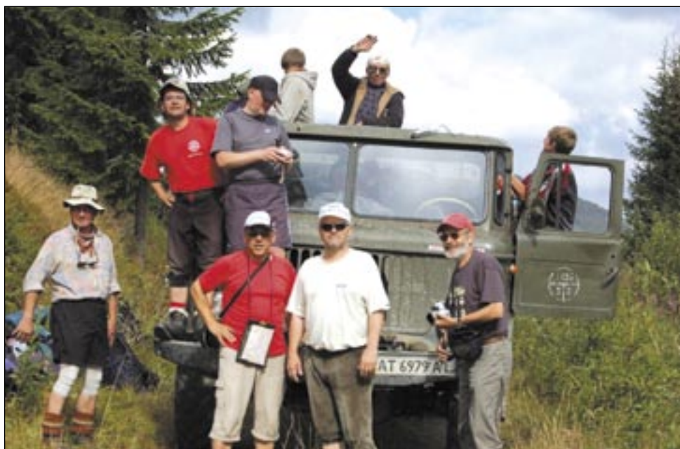
W rejonie gór Czywczyn. Integracja z ukraińskimi jagodziarzami nie nastęrczała żadnych trudności – ochoczo przyjęli nas na pakę „gruzawika” z wojskowego demobilu.

granicy wędrujemy na wschód. Dochodzimy do pozostałości – przecinającej grań Karpat – bitej drogi zbudowanej w czasie I wojny światowej. Jest to tzw. droga Mackensena. Zaczyna padać deszcz i spada temperatura. Na szczęście wchodzimy już na Ruski Dział, zbliżając się do ruin dawnej serowarni i strażnicy granicznej – w okolicy musi być woda. Źródło odnajdujemy kilkaset metrów niżej, obok czynnej baczki. Szybki posiłek i można iść spać. Wiatr targa namiotami, ale zmęczenie szybko przywołuje sen.