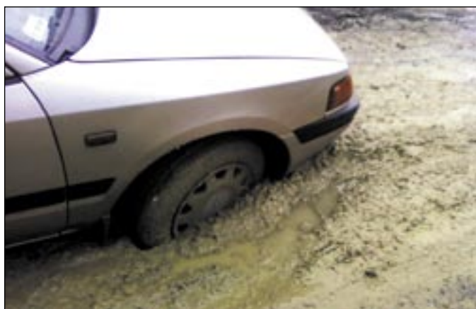
Zatamianie się „jezdni” podczas przejazdu mieszkanki Stróży przelazła czarę goryczy. Ludzie mówią: dość! To już nie jest tylko problem niszczenia samochodów, ale też zdrowia i życia użytkowników drogi.

– I to właściwie jest cały komentarz. Nie rozumiemy, jak można tak totalnie lekceważyć