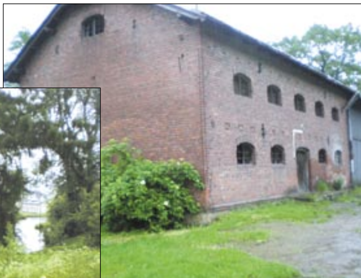
Na działce, gdzie ma powstać tzw. otaczarnia, stoi stary, wpisany do rejestru zabytków spichlerz. W bezpośrednim sąsiedztwie działki znajduje się zabytkowy park ze starodrzewem i stawami rybnymi.

Mieszkańcy protestowali najpierw indywidualnie – chodzili do gminy, pisali pisma. W końcu na zebraniu wiejskim jednogłośnie podjęli uchwałę wyrażającą stanowczy sprzeciw w sprawie budowy wytwórni asfaltu. – Mielismy wiele zastrzeżeń do raportu.