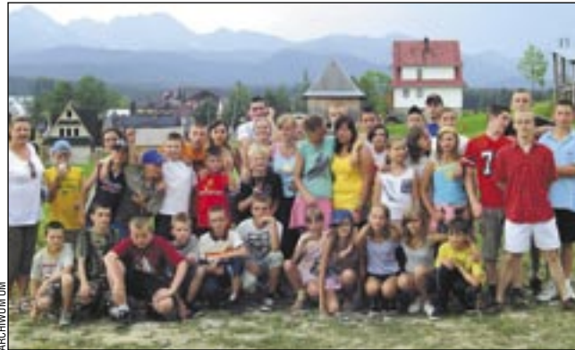
Wypoczynek, pozytywne zajęcia, możliwość nawiązania nowych znajomości – uśmiechnięte twarze młodych uczestników kolonii i obozów są najlepszą rekomendacją dla organizatorów

Młodzież – oprócz zabaw, wycieczek, dyskotek, wyjść na basen i innych rozrywek – brała udział m.in. w zajęciach z psychologiem ukierunkowanych na rozwiązywanie problemów osób w tym wieku. Po nich pojechali na wypoczynek do Murzasichli młodzi, uczniowie szkół podstawowych. Z dwóch turnusów skorzysta siedemdziesięcioro dzieci, które również będą uczestniczyły w programie profilaktycznym, dotyczącym m.in. odpowiedzialności, umiejętności radzenia sobie ze stresem, sztuki komunikacji.