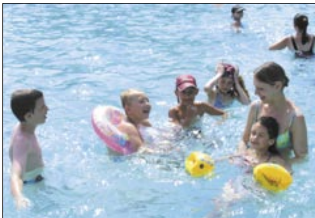
W taki sposób dzieci z przyjemnością kąpią się w basenie.

Codziennie na uczestników kolonii czeka drugie śniadanie oraz dwudaniowy obiad, który wydawany jest w stołówce „U Stasi”.