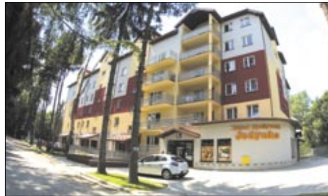
Budynek Elcomu już tętni życiem. Pierwsi lokatorzy wprowadzili się na Boże Narodzenie. Działa sklep PSS-u, kręcą się dzieci.