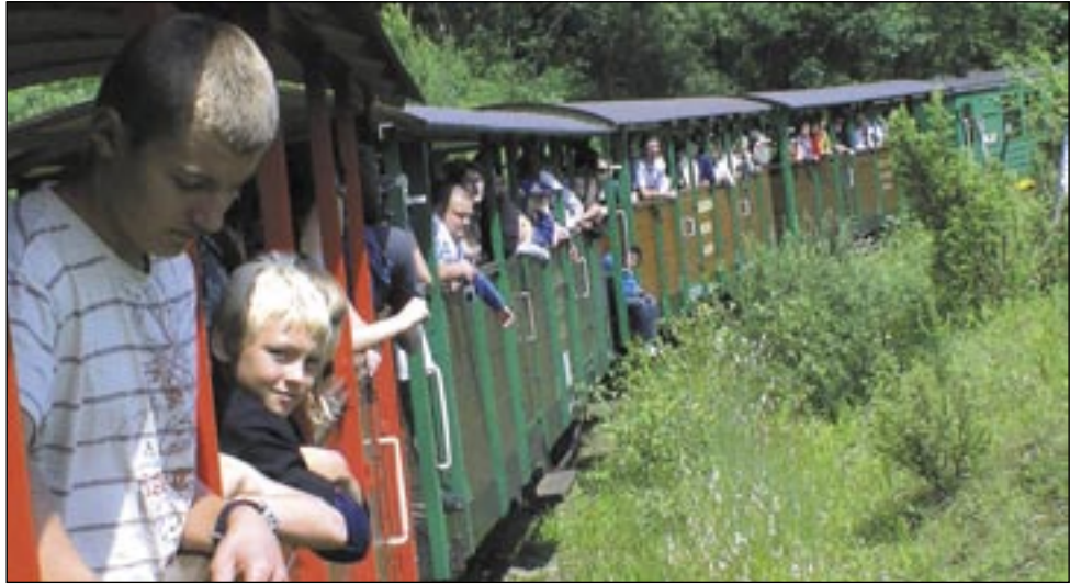
Przejazd bieszczadzką ciuchcią stanowił jedną z wielu atrakcji przygotowanych przez organizatorów wypoczynku.

To kolejna już akcja podjęta przez gminę Bukowsko na rzecz powodzian. Kolejna po zbiórce darów i paszy dla zwierząt z zalanych gospodarstw. W dodatku zorganizowana bez rozgłosu, wielkich fanfar i błysku fleszy. Tym większe uznanie należy się jej organizatorom, dla których najpiękniejszym podziękowaniem był uśmiech i radość małych kolonistów. /joko/