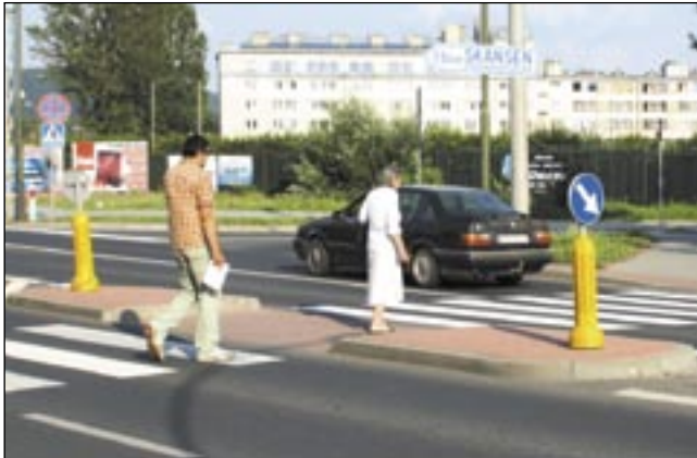
Pieszy nie jest świętą krową na drodze. Podobnie jak kierowców obowiązują go przepisy ruchu drogowego.