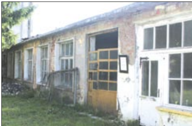
Warsztaty zamieniły się w ohydny rudery, z którą wreszcie coś trzeba zrobić!