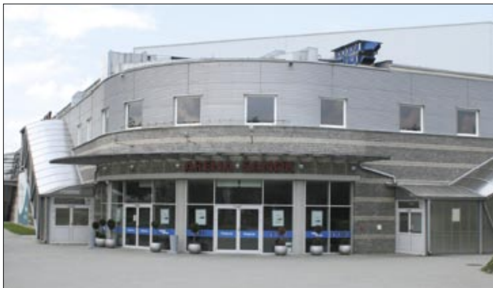
Wszyscy nam zazdroszczą ARENY, a tymczasem my zazdrościmy jej przybyszom, którzy z pieniędzmi w garści są lepszymi klientami i spychają nas na aut.

o tym w Sanoku Ministerstwo Sportu i Turystyki”. Czyżby nie wiedział, że OSSM powołał Polski Związek Hokeja na Lodzie, który wystąpił z wnioskiem do ministerstwa o uruchomienie dotacji na ten cel z Funduszu Rozwoju Kultury Fizycznej na sport powszechny? A dzięki skutecznym działaniom burmistrza