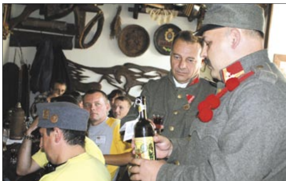
W karczmie wszyscy czują się dobrze. Z miłośnikami cesarza Franciszka Józefa na czele, którzy co rok odwiedzają to miejsce.

Inne specjalty, jakimi pochwalić się może ten lokal, to m.in. chrzanica podana na boczku z ziemniakami (7,5 zł) i hreczanyki, czyli kotleciki z mięsa mie-