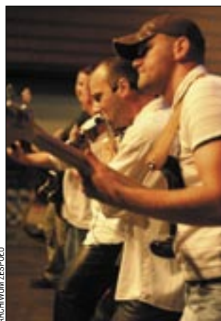
Redlin na scenie to wulkan energii, który porywa do tańca każdą publiczność.

W sobotę (od godz. 14) na plenerowej scenie wystąpią m.in. zespół folklorystyczny „Bieszczadzki Dom”, folkowe „Berdo” i „Źródło Karpat” z Ukrainy. Gwiazdą wieczoru (ok. godz. 20) będzie zespół „Redlin” – jedna z najlepszych grup folkowych w Polsce. Repertuar 6-osobowego zespołu obejmuje folkowe rytmy z całego świata – od szlagierów typu Kalinka czy Sokoły, po Skrzypka na dachu, Czardasza Montiego, aż po brawurowo – a’la Pavarotti – wykonane „O sole mio”. Profesjonalizm oraz niezwykła żywiołowość muzyków gwarantuje publiczności nie tylko sporą porcję