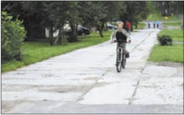
Miejmy nadzieję, że casus ulicy Didura stanie się przyczynkiem do poważnej dyskusji na temat inwestycji drogowych, a przede wszystkim skończenia raz na zawsze z praktyką remontowania ulic po kawalku.

Prowadząc tam sklep, również spotykam się z problemami komunikacyjnymi, również Pani Redaktor Ziobro minęła się z prawdą na temat długości asfaltu położonego na ulicy Rataja oraz roku jego wykonania – położono 60 metrów asfaltu i została wprowadzona do budżetu 2009 roku, jak również została wykonana w 2009 roku, nie pomijam faktu, że mieszkałam przy tej ulicy. Obecne zainteresowanie dzielnicą Dąbrówka Pana Rad-