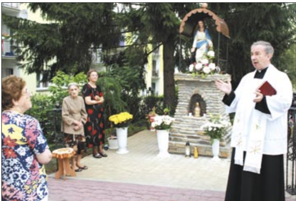
Dzięki zaangażowaniu ludzi dobrej woli, w centrum miasta powstał piękny obiekt małej architektury – kapliczka, będąca nawiązaniem do poprzedniczki z lat 50.