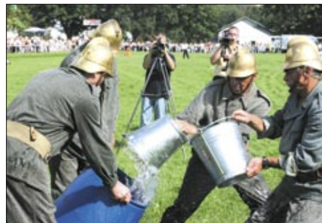
Napełnienie przy pomocy wiader 100-litrowej beczki wymagało nie lada wysiłku.

Równie duże emocje towarzyszyły drugiej konkurencji, którą stanowiły strażackie ćwiczenia bojowe. Napełnienie beczki wodą, bieg przez mostek i tunel, ręczne pitowanie kłody drewna, rąbanie kłocków do zablokowania sikawek, pompowanie wody i strącenie „płomieni” na makiecie budynku dostarczyło niebywałych emocji. Presja czasu i opór materii przysporzyły niektórym druhom niemałych problemów. Jedni mieli kłopoty z racz-