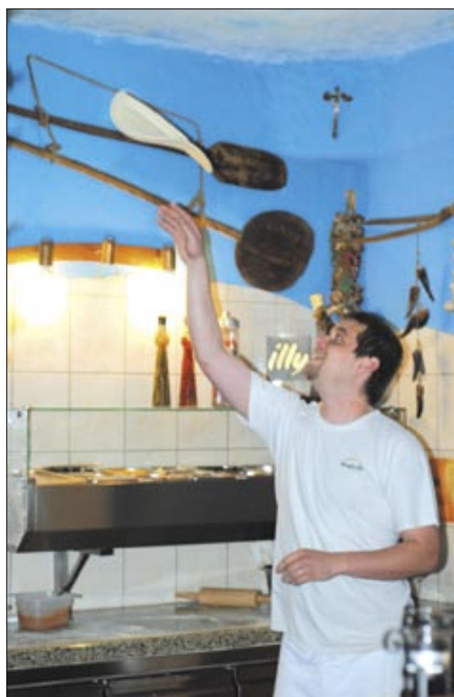
W „Xavito” skosztować można pizzy, która przyrządzana jest według włoskiej receptury.

Dla fanów kuchni włoskiej lokal przygotował również lasagne mięsno-warzywną i spaghetti. Jeśli chodzi o dania meksykań-