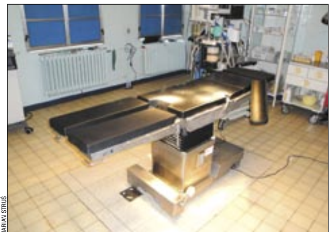
Tak wygląda nowoczesny stół operacyjny. Wszystkim życzymy, żeby mieli okazję oglądać go tylko na zdjęciu w „TS”.