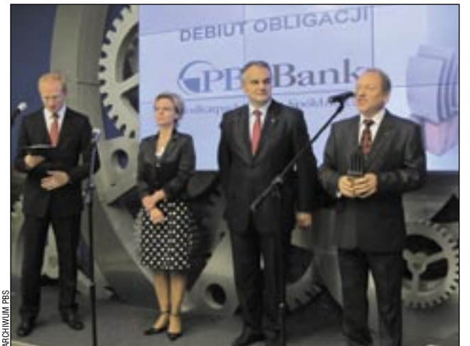
Wicepremier Waldemar Pawlak nie krył zadowolenia z udanego debiutu Banków Spółdzielczych na rynku obligacji.