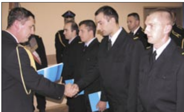
Odznaczenia i awanse dla strażaków sanockiej PSP z okazji ich dorocznego święta.