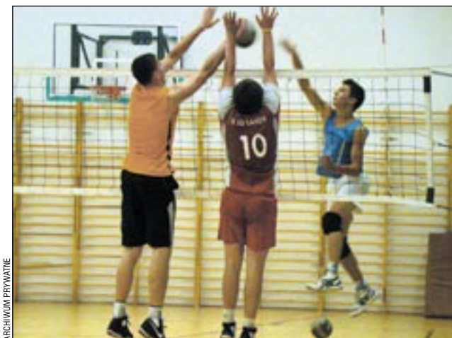
Siatkarze TSV Mansard trenowali na pełnych obrotach.

Drużyna TSV rozegrała 5 sparingów – w różnych składach, a także w nowych ustawieniach. Jednym z rywali byli czarni Radom, czyli Mistrzowie Polski Juniorów. Po bardzo zaciętym pojedynku TSV przegrało 1:3. W pozostałych meczach padły wyniki: 3:1 i 0:3 z Unią Skierniewice oraz 3:1 i 3:2 z Sokołem Strzyżów.