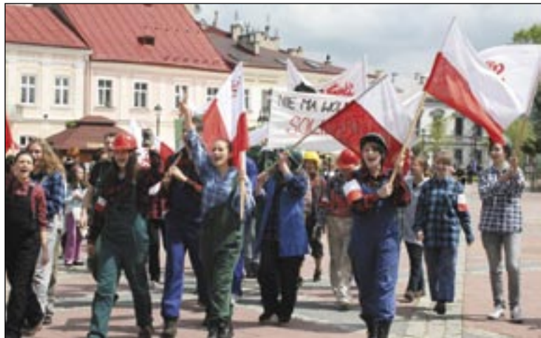
To było 30 lat temu. Wcale nie tak dawno, chociaż wielu młodych ludzi z niedowierzaniem słucha opowieści o tamtych czasach. Przywróciła je młodzież szkolna w Paradzie Niepodległości, ukazując walkę „Solidarności” z komuną.