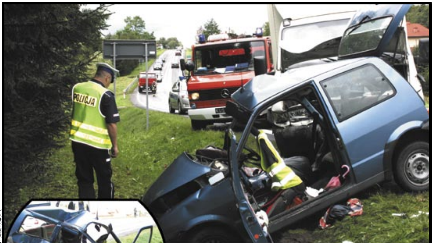
Obraz zmiądzzonego fiata CC szokuje, uświadamiając ogrom tragedii, jaka się wydarzyła.