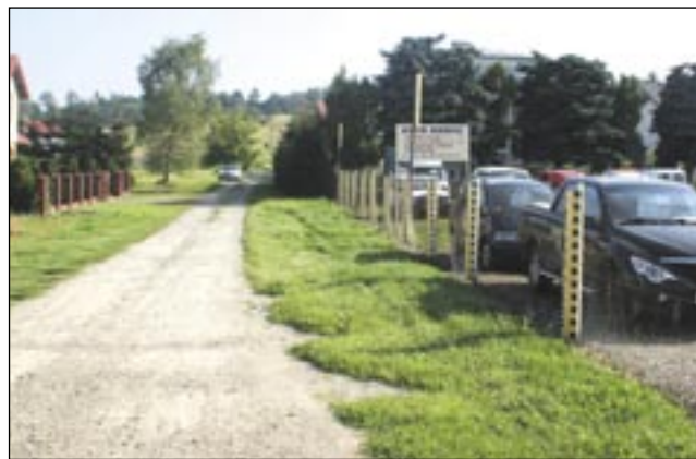
Ulica jaka jest każdy widzi. Czy widzieli ją także ci, którzy w głosowaniach decydowali co należy z nią zrobić?

Właściciel, niezależnie od tego, czy jest to osoba fizyczna, czy gmina, ma prawo dysponować swoją własnością. Gmina, której przysługuje prawo własności nieruchomości, uprawniona jest do gospodarowania tym mieniem w sposób dowolny w granicach zakreślonych prawem. To gmina, w oparciu o określone przepisami prawa regulacje dokonuje wyboru, czy daną