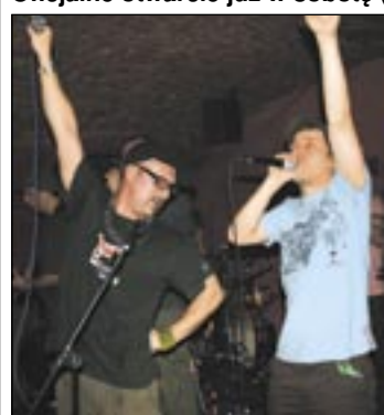
VAVAMUFFIN grał już w „Panice”.

Po trwającej osiem miesięcy przerwie, spowodowanej remontem, działalność wznowia Klub „Pani K.”. Oficjalne otwarcie już w sobotę (4 bm.).