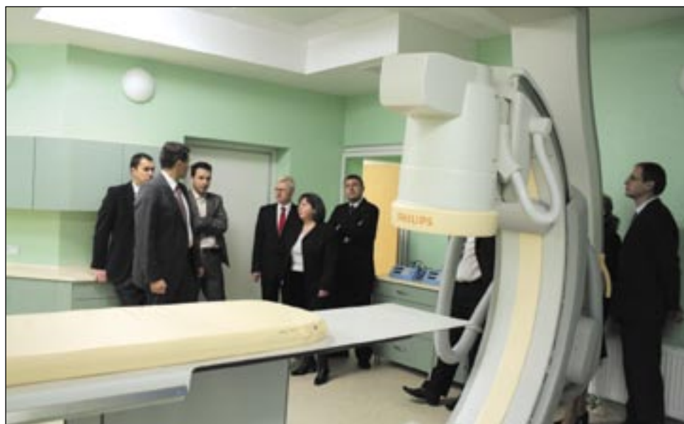
Trudno zrozumieć dlaczego usługi wykonywane na takim sprzęcie mają kosztować w Sanoku mniej niż w Warszawie i dlaczego mają być reglamentowane, skoro są zabiegami ratującymi życie. Stąd już tylko krok, żeby zniechęcić się do inwestowania w nowoczesne urządzenia i aparaturę.