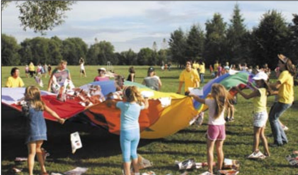
Różnorodne gry i zabawy – tego nie zabrakło na finale lata podwórkowego.

Świetna zabawa, nowe znajomości, mile spędzony czas – właśnie to zyskały dzieci uczęszczające na zajęcia. Cieszyły się one dużym zainteresowaniem, co było widać podczas finału trzeciej edycji sanockiego lata podwórkowego. Dzieci, które przybyły, zmagaly się w wielu konkurencjach oraz skorzystały z ciekawych atrakcji.