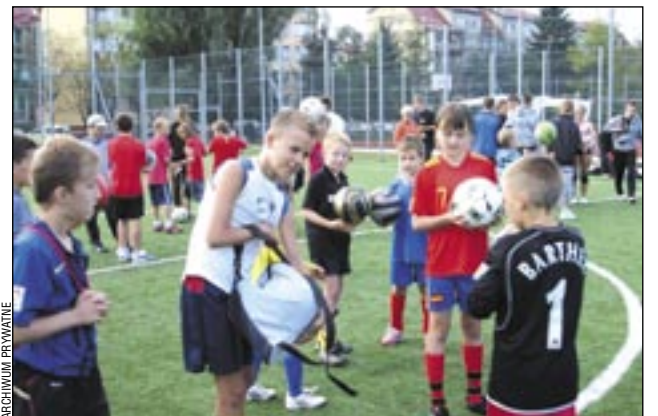
Turniej był świetną imprezą integracyjną dla dzieci i młodzieży.

– Nasza impreza trwała ponad sześć godzin, rozgrywki zakończyły się tuż przed zapadnięciem