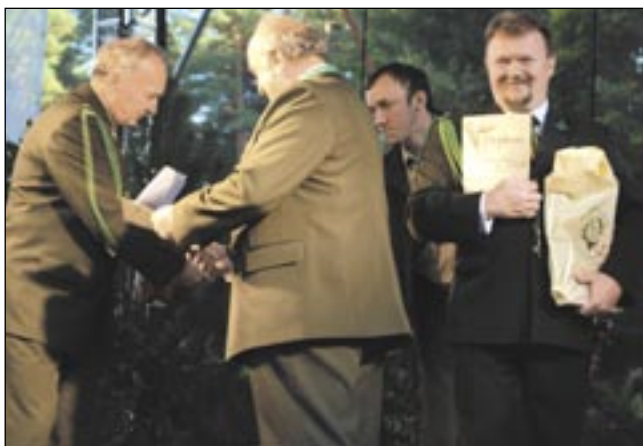
Podczas XII Rykowiska zostało rozegranych wiele konkurencji, a osoby, które stanęły na podium, mogły liczyć na dyplom i nagrodę.

Jak co roku, już od 12 lat, na zakończenie wakacji odbyło się Rykowisko Galicyjskie. W niedzielę, 29 sierpnia, na zagórkim Zakuciu nie zabrakło myśliwych, którzy zjechali się z całego Podkarpacia, a nawet z Olsztyna, Śląska i... Austrii.