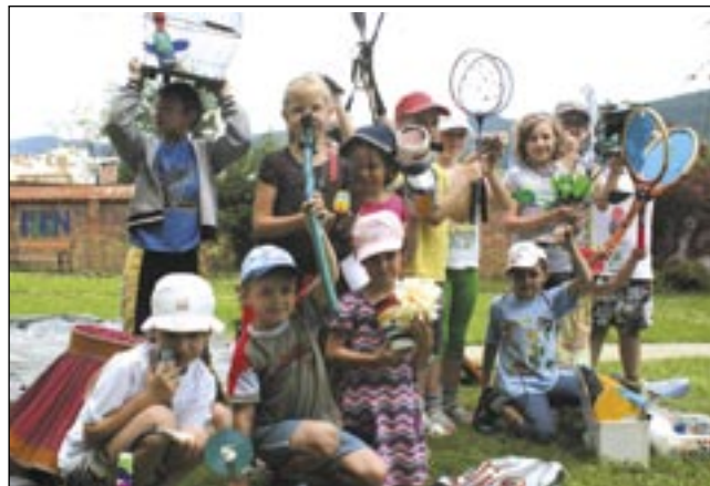
Dzieci bardzo lubią zajęcia organizowane przez BWA.

Zapisy na zajęcia w godzinach otwarcia galerii (telefonicznie lub osobiście). (b)