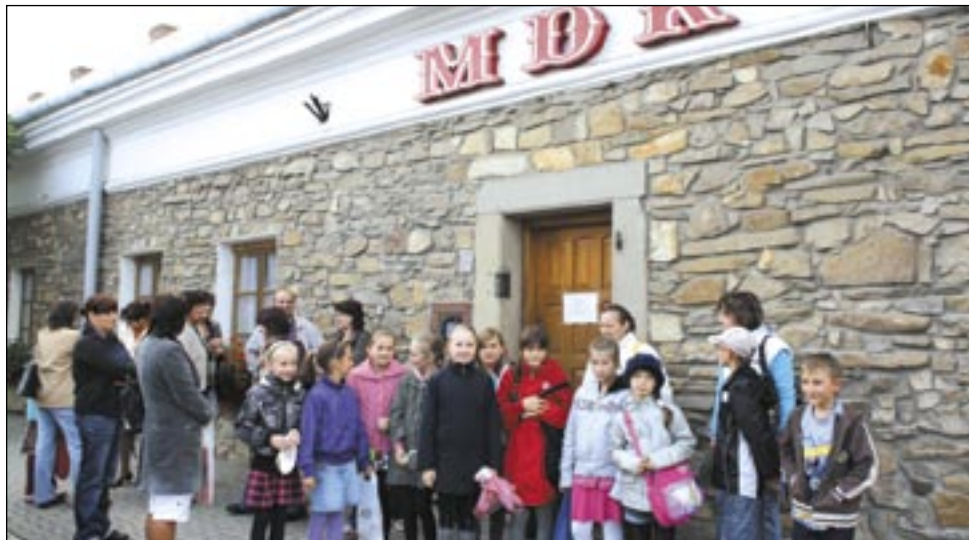
Najbardziej poszkodowanymi w konflikcie okazały się dzieci. Zamiast próby tańca zaserwowano im kartkę z wyjaśnieniem, że z przyczyn formalnych zajęcia nie odbędą się. Zrozumieli z niej, że dziś nie potańczą, nie rozumieli tylko co to znaczy „z przyczyn formalnych”.

Pani Dyrektor pyta, czy mogą one zniszczyć renomę i dobre imię tak dobrze prosperującej placówki. Z pewnością i na szczęście nie, bo na to dobre imię pracowała przez wiele lat cała grupa osób,