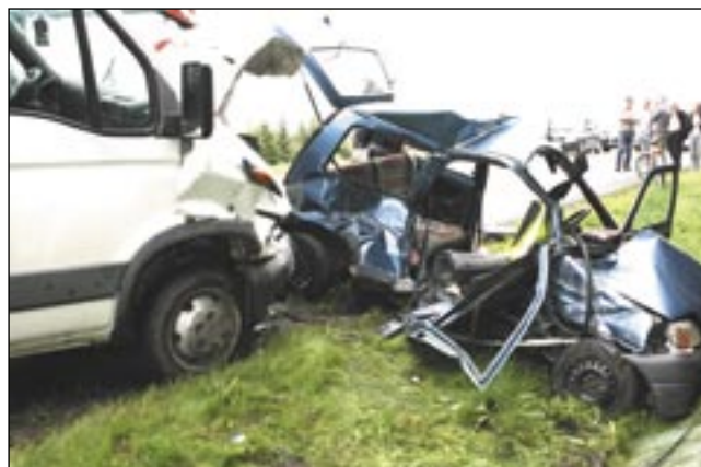
Tak wyglądało Cinquecento po wypadku.