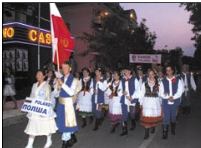
Słowa SANOK i POLSKA były na ustach turystów oglądających uliczne parady.

Nie brakowało też czasu na plażowanie, opalanie i kąpiel w morzu o temperaturze sięgającej 30 stopni. – Pobyt w Bułgarii to był też swoisty wypoczynek, ponieważ jest tam przepiękna plaża i ciepłe morze. Dziewczyny pięk-