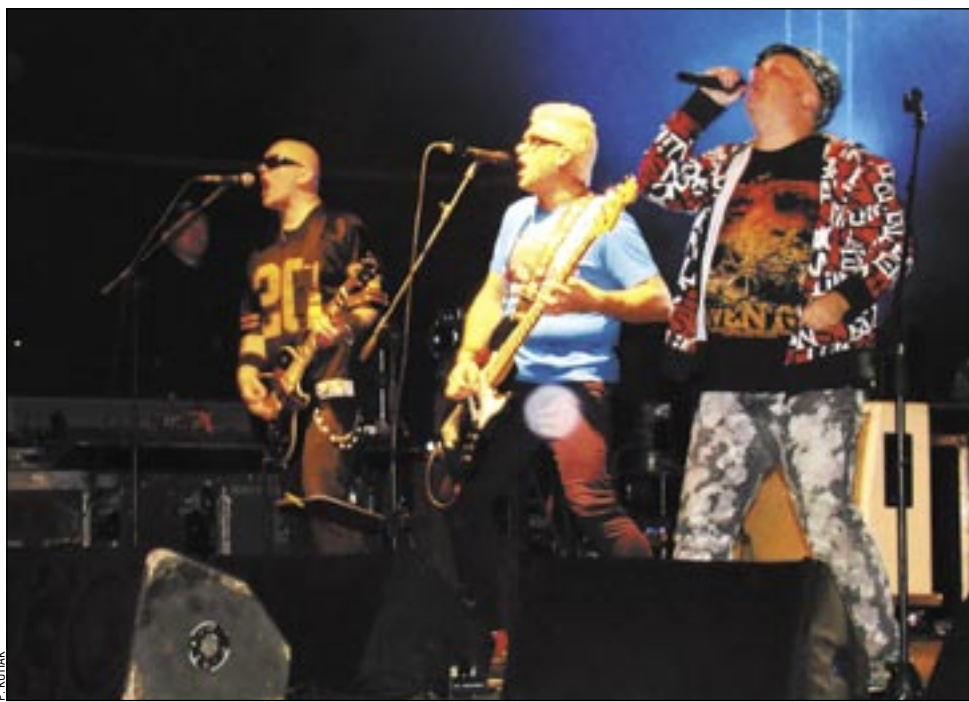
Grupa BIG CYC zaprezentowała w Sanoku „rock jajcarski” w ekologicznym wydaniu.

Niestety, na początku XXI wieku człowiek nadal nie ma wpływu na pogodę i nic nie wskazuje na to, by sytuacja miała się kiedyś zmienić. Dlatego też wszelkie imprezy plenerowe obarczone są sporym ryzykiem, bo deszcz i chłód potrafią skutecznie odstraszyć publiczność. A niedzielna aura bardziej przypominała tę z końca jesieni, niż kalendarzowe jeszcze lato. Dlatego też parking przy „Arenie” długo świecił pustkami, na pierwsze koncerty przyszło zaledwie kilkadziesiąt osób. Najpierw wystąpiła dziecięca grupa MARAKASY, a następnie zespół RADIOFONIA