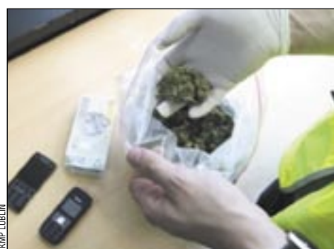
Narkotyki były zapakowane w foliowe worki.