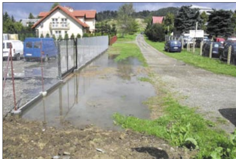
Jeśli tak mają wyglądać sanockie ulice, to można by jeszcze kilkanaście nowych utworzyć. Włęcz ulic, to i miasto poważniej wygląda. Na zdj. ul. ks. A. Szypuły.

W dalszej części Pani Naczelnik pisze, że od strony ul. Krakowskiej od wielu lat istnieje nieformalny zjazd w ulicę ks. Szypuły