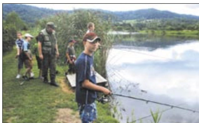
Na stawie w „Sosenkach” młodzież uczyła się łowienia pod okiem działaczy LOP-u.