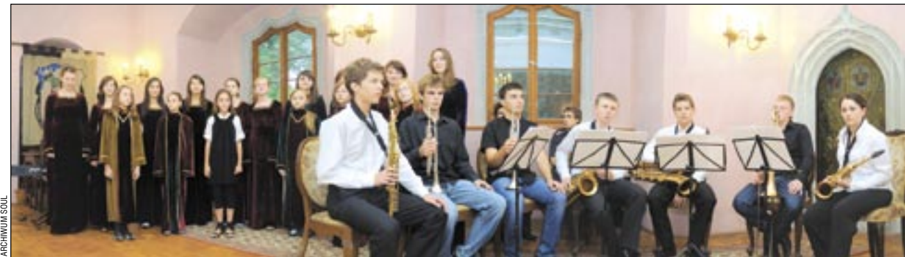
Reprezentacja Sanoka była szczególnie liczna, stanowiąc ponad połowę 40-osobowej grupy uczestników.