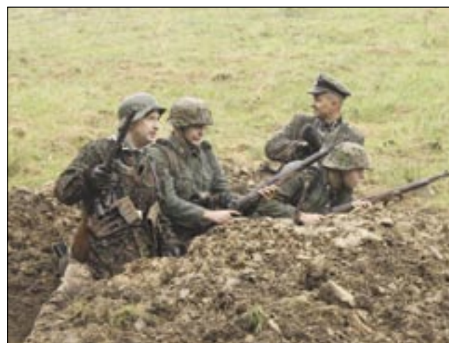
Żołnierze w okopach