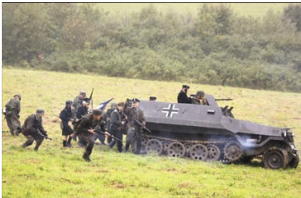
Atak nieprzyjaciela zmusił żołnierzy do wycofania się, co gorsze, jedyna droga odwrotu prowadziła przez pole minowe.