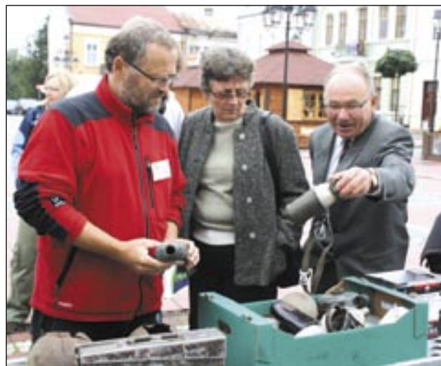
Plecaki, manierki, menażki i różne inne elementy wyposażenia żołnierza z czasów I wojny światowej wzbudzały zainteresowanie uczestników II Galicyjskiej Giełdy Staroci. Kupujących było niewielu.

Wdzięczni członkowie i sympatycy fundacji