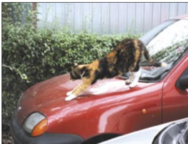
Mrrr... Jak miła jest poranna gimnastyka! Nie wiem tylko, co powie na to facet od tego czerwonego autka... Ale nic mnie to nie obchodzi! Mógł nie parkować w niedozwolonym miejscu!

Teraz czekamy, jaki los spotka studzienkę kanalizacyjną. Samo jej odkrycie niewiele zmieni, może jedynie doprowadzić do jakiejś tragedii. Może więc zostanie zasypana? Będziemy się temu przyglądać. red.