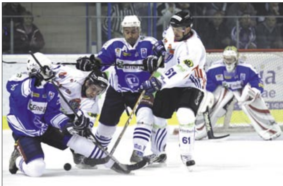
Mecz ze Stoczniovcem okazał się ciężką przeprawą. Do rozstrzygnięcia potrzebna była dogrywka, przez co zespół Ciarko KH stracił pierwszy punkt w sezonie.