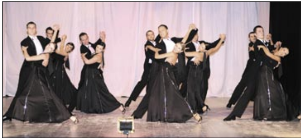
Popisowy walc „Dinozaurów” potwierdził, że – mimo dodatkowych lat i kilogramów – wciąż znajdują się w świetnej formie.

To był najpiękniejszy czas – wiele podróży, emocji i niezapomnianych przyjaźni, które trwają po dziś dzień. Taniec nas ośmielił i ułatwił nawiązywanie kontak-