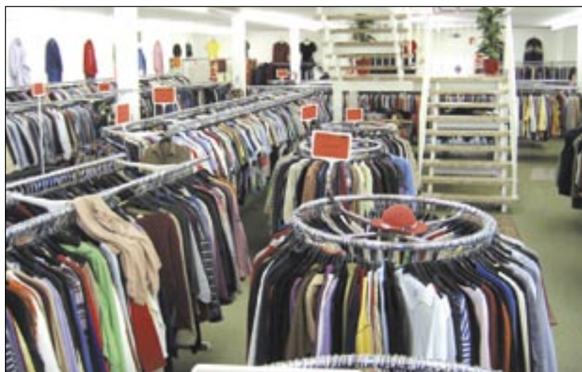
Szmateksy coraz bardziej przypominają normalne sklepy, odbiegają od niech jedynak cenami. Dla wielu osób to jedyna szansa na skompletowanie garderoby.

cownica otwiera kratę. Ale wstępu dla kupujących jeszcze nie ma. Pozostało 15 minut. Czas wydaje się wiecznością. Ktoś w tłumie mówi sam do siebie – Jeszcze chwilkę.