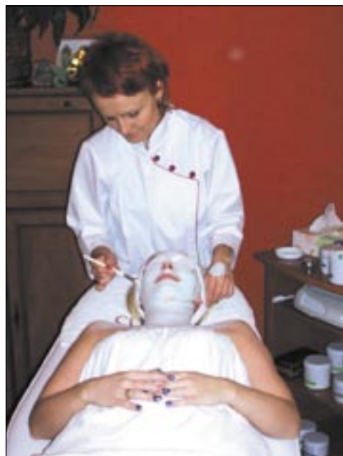
Coś dla ciała i ducha. Piękna skóra i odrobina relaksu.

Działa ono podobnie jak laser. Przy jego pomocy można usunąć ślady po bliznach, przebarwienia, zlikwidować rozszerzone naczynia krwionośne, a nawet efekty fotostarzenia. Dla utrzymania zgrabnej sylwetki wspomaganiem są masaż przy użyciu podciśnienia. A w sezonie letnim i świątecznym zainteresowaniem cieszą się zabiegi poprawiające kolorystykę skóry. Natomiast kiedy kończy się okres urlopowy, dużą popularność osiąga zabieg arbuzy z aromaterapii, służący nawilżaniu naskórka po intensywnym opalaniu. Ale warto zatroszczyć się też o kondycję ducha. Odprężenie dają masaże kamieniami, stemplami ziołowymi czy czekoladą.