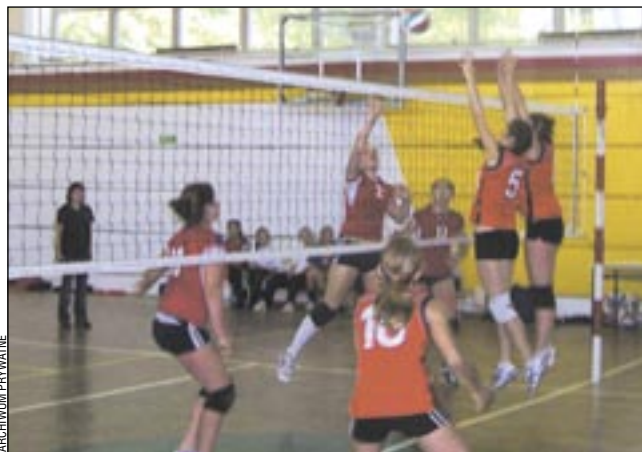
Turniej w ośrodku „Jawor” zakończył się wygraną Sanoczanki.