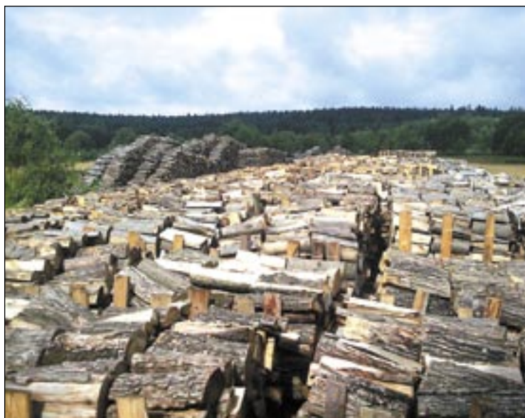
Zanim zamówimy drewno, powinniśmy wiedzieć, co chcemy kupić. Sprzedawane luzem jest tańsze od układanego, ale w 1 mp będzie go mniej o około 25 procent.

Nam również – mimo wielu prób – nie udało się skontaktować z właścicielem firmy z Uher-