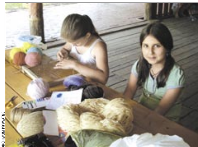
Dzieci w Tyrawie Wołoskiej miały wiele różnych zajęć.

Sanok miał „Lato podwórkowe”, a Tyrawa Wołoska akcję „Przyjemne z pożytecznym”. O wakacyjną ofertę dla dzieci i młodzieży zadbał Gminny Ośrodek Pomocy Społecznej.