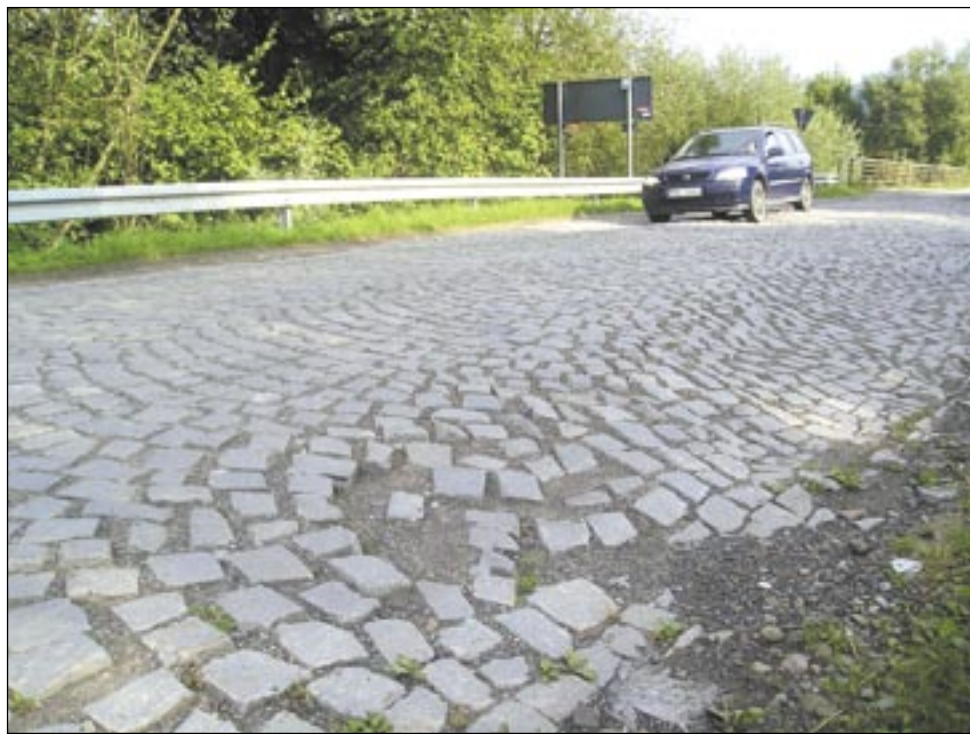
Jazda po kostce brukowej w Załużu zaczyna już przypominać sport ekstremalny.

Mieszkańcy Załuża wciąż nie mogą nakłonić powiatu do remontu drogi, ale być może wyręczą ich okoliczności. W lecie doszło tam bowiem do kilku incydentów – na dziurawej kostce brukowej dwóch kierowców urwało miski olejowe, a z szambiaraki wylały się fekalia.