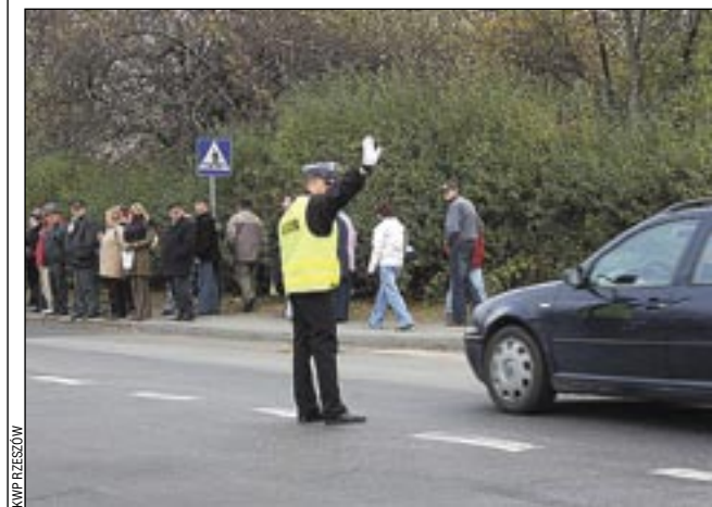
W najbliższych dniach i kierowców, i policjantów czekają trudne chwile.

Cmentarz w Zagórz-Wielopolu (znajdujący się przy drodze W-892) – do parkowania wykorzystany będzie przyległy parking oraz pobocza dróg dojazdowych. /k/