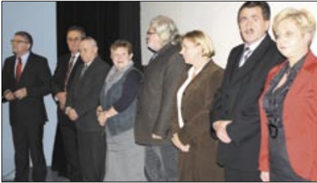
Prezentacja kandydatów do rady miasta przebiegała w iście amerykańskim stylu. Dobra muzyka, ciepłe słowa promotorów, efektowne wejście na scenę, uśmiechy do publiczności. Gdzie oni się tego wszystkiego nauczyli?

Nie zgodził się z krytyką niektórych konkurentów, że nie potrafił współpracować z powiatem, że pograżył miasto w długach, że nie zajmuje się budownictwem socjalnym i komunalnym. – Dowodem współpracy są chociażby wspólnie wyremontowane drogi i chodniki czy sukcesywne wspomaganie szpitala. 35-procentowy wskaźnik zadłużenia, przy dopuszczalnych 60 procentach, zadaje kłam takim opiniom. A że dług rośnie, jest to dowód, iż miasto inwestuje, rozwija się. W zakresie budownictwa socjalnego przygotowujemy siostrzany obiekt przy ul. Okulickiego. Przy ul. Konarskiego mamy działkę pod budowę budynku komunalnego i też myślimy, jak wystartować z budową – tłumaczył burmistrz. Wskazał też na zarzuty, którym fakty akurat przeczą. – Sanok posiada jeden z najwyższych w województwie procentów aktualizowanych planów zagospodarowania przestrzennego, a nie najniższych,