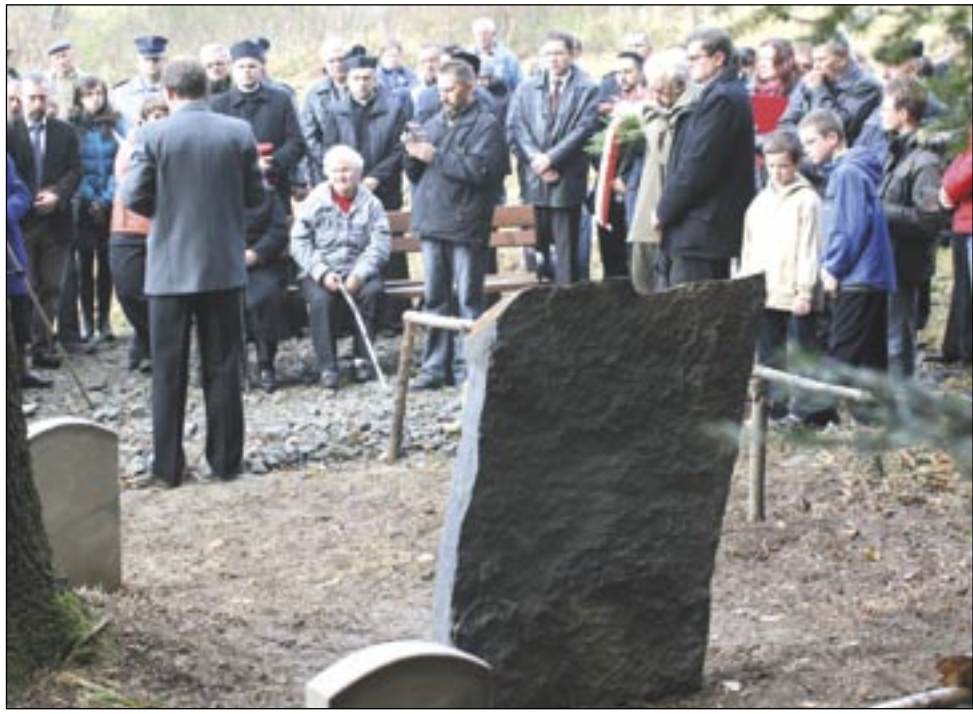
„Tu spoczywa 31 obywateli polskiej narodowości żydowskiej, kobiet, mężczyzn i dzieci, mieszkańców Poraza, Niebieszczan, Morochowa, zamordowanych wiosną 1942 r. przez hitlerowców. Niech pamięć ludzka nigdy nie będzie wybiórcza.”