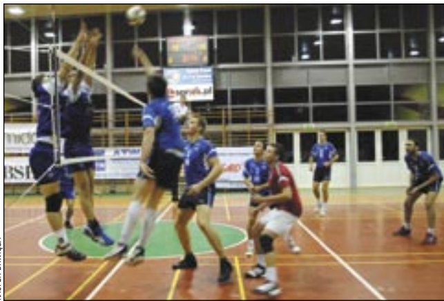
Na razie idzie jak po grudzie, ale wkrótce blok rywali zacznie kruszeć.

Siatkarze TSV Mansard sezon rozpoczęli źle, i – niestety – na razie nie mogą się przełamać. Od pierwszych piłek meczu z AZS widać było, że punkty nie przyjdą łatwo, zdobywali je głównie po zepsutych zagrywkach rywali. To w ogóle był mecz marnowa-