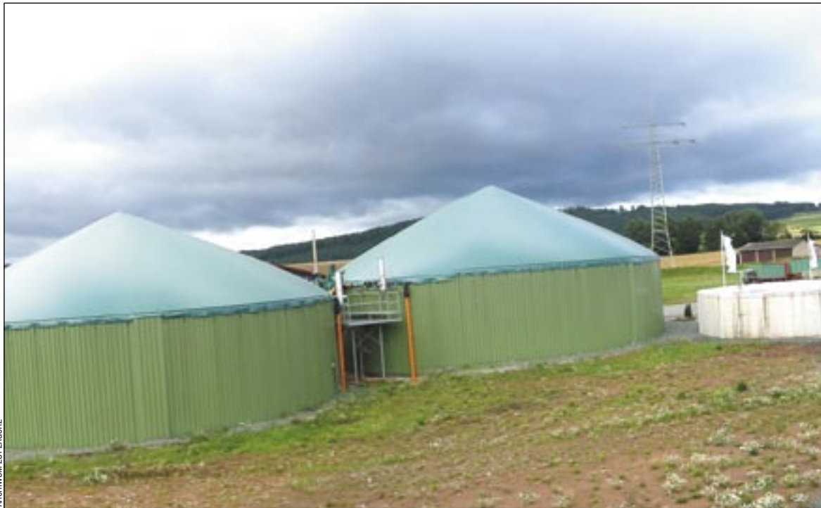
W Chinach jest już ponoć milion biogazowni, w Niemczech kilka tysięcy, natomiast u nas zaledwie około dziesięć. Być może ta jedenasta powstanie właśnie w Zagórz...

– W Niemczech są tysiące biogazowni, doskonale się tam sprawdziły. W naszym kraju fatalną reklamę zrobiła im nieudana inwestycja w Liszkowie, gdzie popełniono kilka rażących błędów. Już w trakcie budowy nastąpił cały szereg zmian warunków, w których miała funkcjonować, potem nie nawiązano odpowiedniej współpracy z rolnikami. Pamiętajmy jednak, że w Polsce działa kilka innych biogazowni – z pozytywnym skutkiem i ku zadowoleniu społeczności lokalnych.