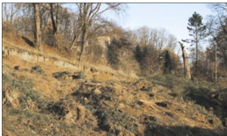
Obszar osuwiska jest rozległy.