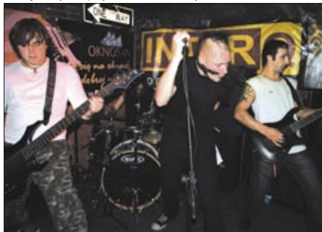
Grupa KAMIKADZE TR dała czadu w „Rudera”.

Tym razem w klubie „Rudera” mieliśmy akcent północno-wschodni – zagrała estońska grupa KAMIKADZE TR, której muzyka łączy w sobie wiele stylów.