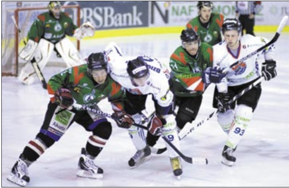
Drugi atak (Gruszka 93, Dziubiński 9 i Malasiński 89) jest coraz groźniejszy i udowadnia, że potrafi wziąć na swoje barki ciężar wyniku. Tak trzymać.

Kary: 4-18 (w tym 10 min za niesport. zach się Zapały). Sędziował: Paweł Meszyński.