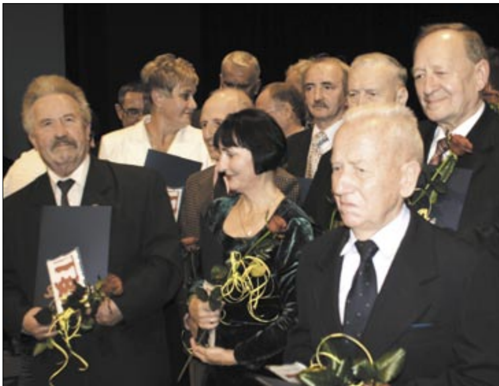
Choć drogi twórców i członków „Solidarności” porzochodziły się, większość pozostała wierna jej ideałom, służąc Polsce i człowiekowi.

Po ogłoszeniu stanu wojennego, „S” podjęła próbę oporu. 14 grudnia rano rozpoczął się strajk w Autosanie (następnego dnia jego organizatorzy, wbrew obietnicom dyrekcji, zostali dyscyplinarnie zwolnieni). W Stomilu część załogi zaspas-