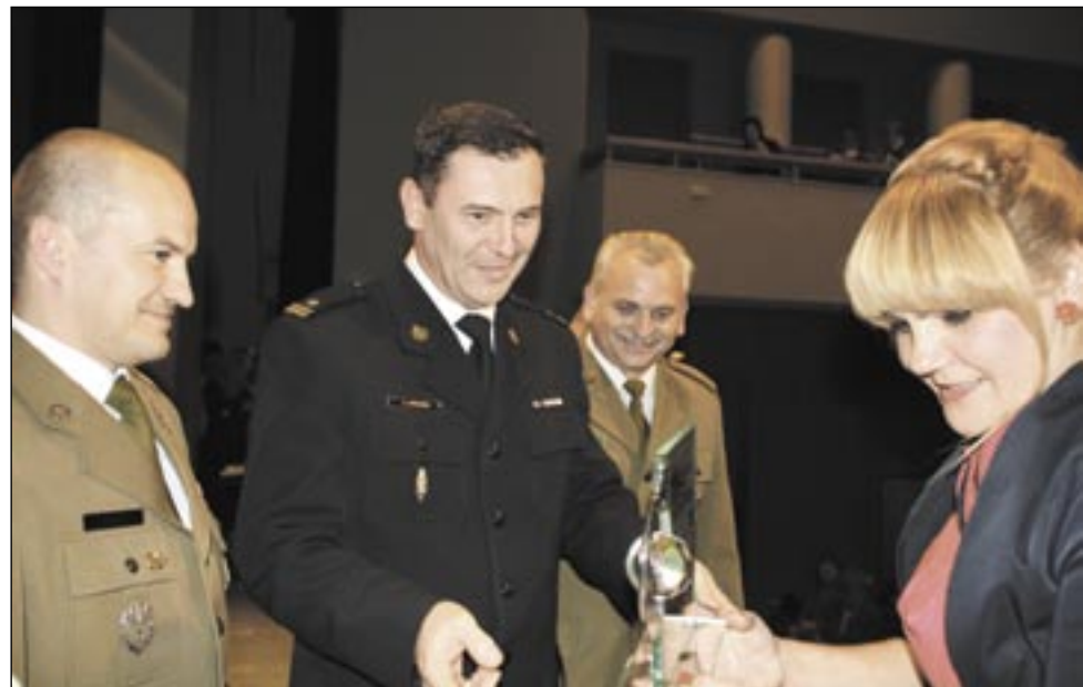
Jubilatka pędzi do przodu niczym superexpress. Któż by jeszcze dwa lata temu pomyślał, że utworzy Liceum Profilowane z takimi innowacjami jak: edukacja proobronna, ochrona granic, kształcenie ogólnopolicyjne, czy przeciwpożarowe. Brawa dla Szkoły, brawa dla służb mundurowych!

mechanicy samochodowi, aparatowicze przetwórstwa mięsa, potem: piekarze i cukiernicy, malarze i kominarze, złotnicy i kolejarze, handlowcy i technicy organizacji usług gastronomicznych, wreszcie technicy usług fryzjerskich, krawcy, a ostatnio specjaliści kształcący się w ramach Liceum Profilowanego w dziedzinach: edukacja proobronna, ochrona granic i kształcenie ogólnopolicyjne. Ta szeroka gama zawodów to dowód na zmieniające się zapotrzebowanie ze strony lokalnego przemysłu i sfery usług.