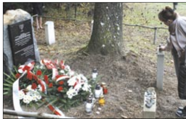
Wiele osób nie kryło wzruszenia, zapalając znicze i kładąc wielkie kamyki na żydowskich macewach...