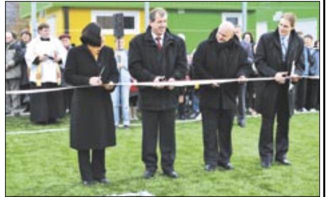
Na otwarciu kolejnego Orlika w gminie Sanok.

morządowców i muszę stwierdzić, że Sanok nie najlepiej wygląda na tle innych porównywalnych z nami miast. Wydaje mi się, że potrzebujemy innej aktywności i promocji niż w tej chwili mamy. Sanok powinien mieć ambicje do liderowania w naszym regionie. Jak do tej pory próbujemy tylko doganiać inne ośrodki. Szans, które stoją przed nami, nie powinniśmy marnować, bo drugiej takiej okazji na rozwój możemy już