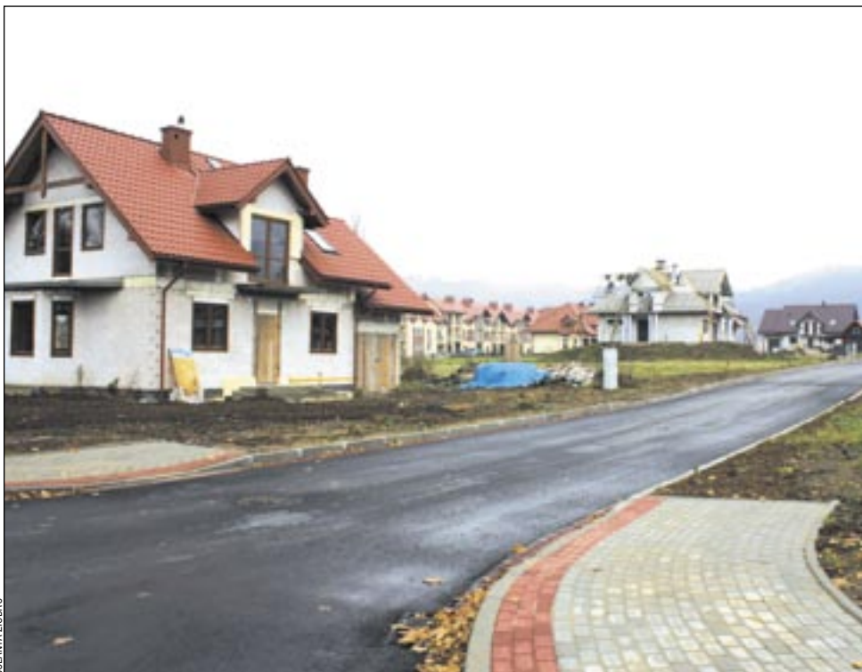
Kilka lat temu część terenów przy ulicy Wyspiańskiego miasto chciało sprzedać jednej ze spółdzielni. Na szczęście tak się nie stało. Dziś jest to bardzo atrakcyjny teren budowlany i inwestycyjny, a nowe osiedle z siecią nowych dróg prezentuje się wyjątkowo okazale.