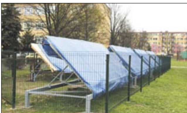
Solary przy Domu Dziecka to na razie atrapy. Montaż utknął w martwym punkcie, gdy okazało się, zakupionych elementów nie ma.

Wyrażam pogląd, że mogła Pani tuż po sesji zamieścić szczegółową relację z jej przebiegu, a nie jak to Pani czyni w chwili obecnej. Uważam, że kampania wyborcza udziela się nie tylko kandydującym, ale nie pomija też osób, które z racji zawodowej nie powinny być w nią zaangażowane. W sprawie rzekomych nieprawidłowości, które Pani przedstawia, również nie będę