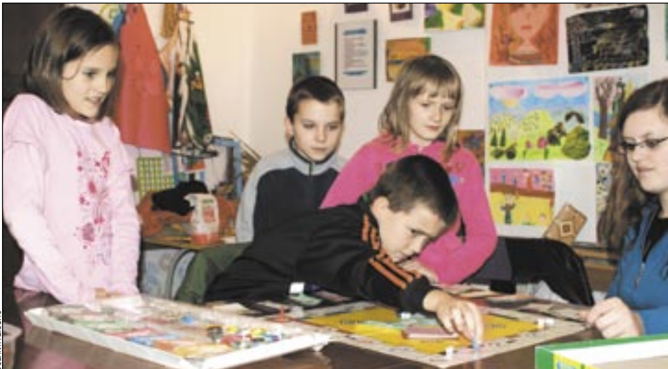
MDK tętni życiem. Na szczęście dzieci są poza sprawami i konfliktami dorosłych – bawią się, uczą, przyjemnie i pożytecznie spędzają czas.

W efekcie publicznej już dyskusji doszło do zwołania Rady Pedagogicznej MDK, z udziałem starosty Wacława Krawczyka, a następnie kontroli, prowadzonej przez pracowników Starostwa Powiatowego. Trwała od 2 września do 28 października. Wyniki były szokujące, gdyż ujawniono szereg przestępstw przeciwko wiarygodności dokumentów i obrotowi gospodarczemu. Ujawniono, że np. spisywano umowy o pracę z fikcyjnym wymiarem czasu pracy, natomiast wynagrodzenie wypłacano zgodnie z rzeczywistym, a różnica była „pobierana w kasie przez inne osoby” (jak ujęto to w zawiadomieniu). Praktyki takie stosowano pod groźbą utraty pracy. Falszowano też dokumentację płacową poprzez fałszowanie podpisów oraz zmuszanie pracowników