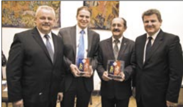
Z Marszałkiem Województwa, Wojewodą Podkarpackim i Przewodniczącym Sejmiku.

Publikacja sfinansowana przez Komitet Wyborczy Platforma Obywatelska RP.