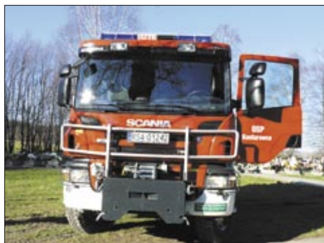
Scania może zabrać „na pokład” ponad 5 tys. litrów wody.

Dwa miesiące po Niebezpiecznych wóz gaśniczo-ratunkowy otrzymała Ochotnicza Straż Pożarna w Kostarowcach. To scania za prawie milion złotych!