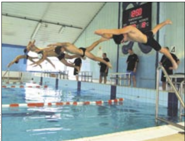
Dobry skok to podstawa udanego wyścigu.