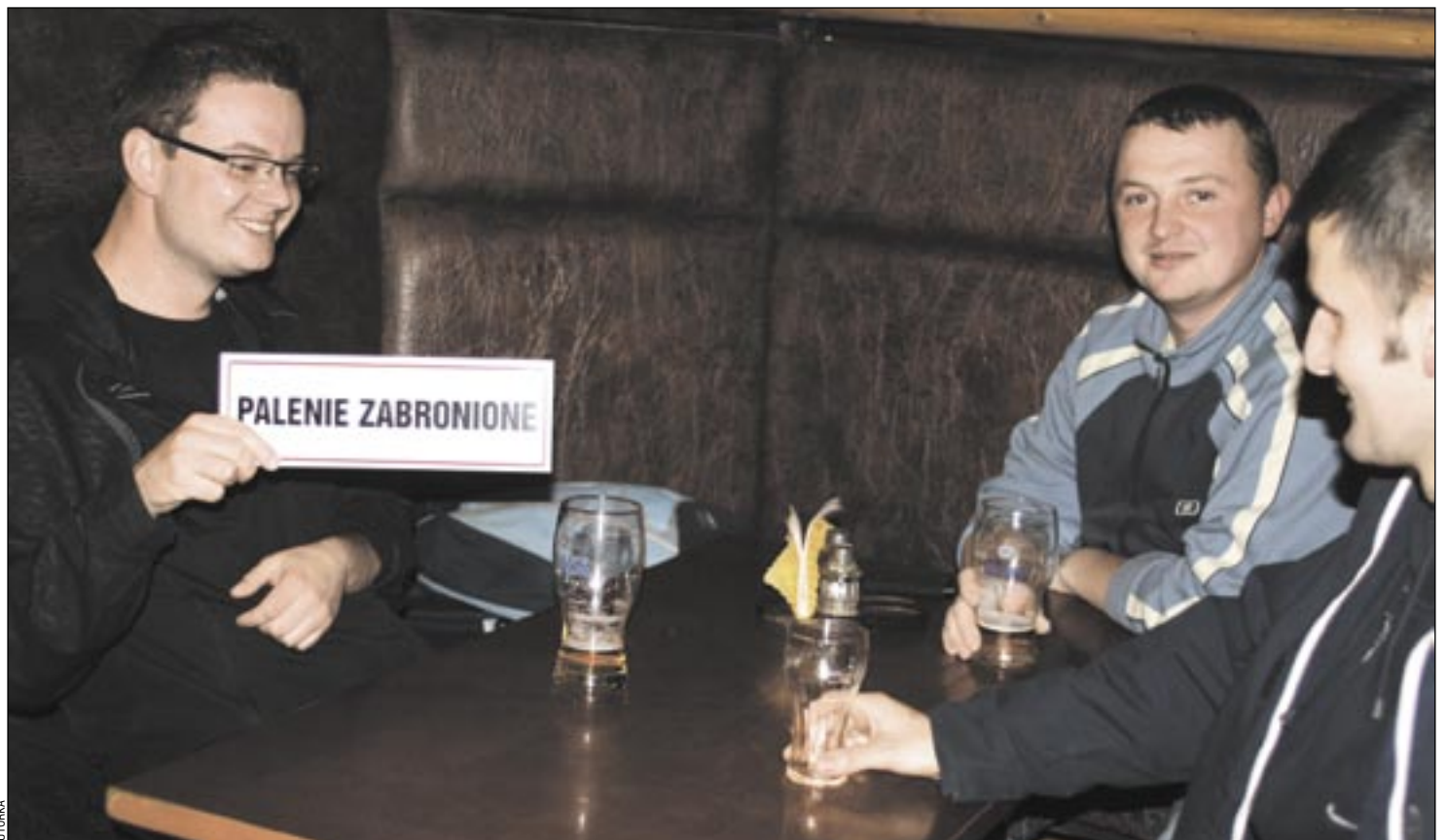
Bierny palacz, wdychając dym tytoniowy, otrzymuje potężną dawkę ponad 4 tys. toksycznych środków chemicznych, z których 40 jest rakotwórczych

lokalowe, a niewielu stać na taki wydatek jak przeszklona kabina dla palaczy. Są, zresztą, sposoby na obejście ustawy. Wystarczy założenie tzw. klubu palacza – goście przy wejściu podpisują deklarację członkowską i... palą do woli.