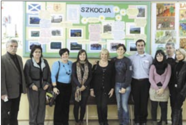
Żadna z sanockich placówek edukacyjnych nie może pochwalić się tak rozwiniętą współpracą „ze światem” jak SP3. Na zdjęciu – pamiątkowa fotka na tle gazetki poświęconej Szkocji.