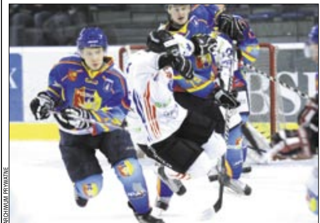
Tak na dobre walka zaczęła się w trzeciej tercji. Jej wynik (5-1 dla Ciarko KH) najlepiej mówi, kto walczył lepiej i odważniej. A kibice sanoccy mogli sobie zaśpiewać: „Górale na hale...”