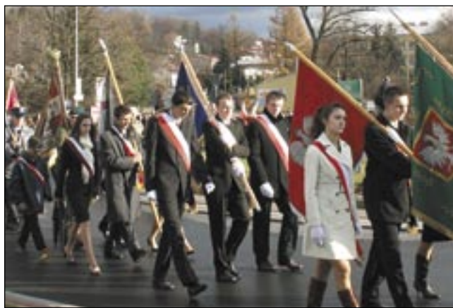
Młodość, patriotyzm, święto – brakuje tylko uśmiechu...