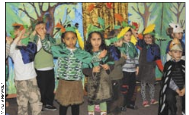
„Ekologiczna” część artystyczna również wypadła wspaniale

Świetną okazją do edukacji poprzez zabawę było rozstrzygnięcie piątego już konkursu plastyczno-technicznego „Nasze rady na odpady” w Przedszkolu nr 3. Przy tej okazji dzieci pochwały się imponującym wynikiem: 1139 kg zebranej makulatury w ramach akcji „Ratuj naturę – zbieraj makulaturę”.