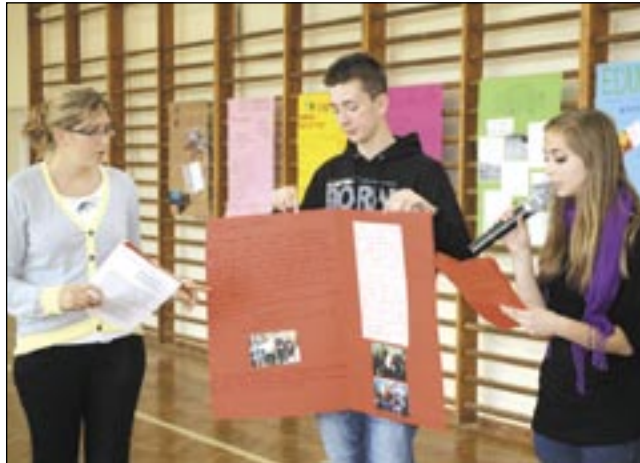
Prezentacja jednego z zespołów „gry miejskiej”.

Uczestnicy zostali podzieleni na grupy monitorujące konkretne dziedziny życia miasta, takie jak: transport, sport i rekreacja, pomoc