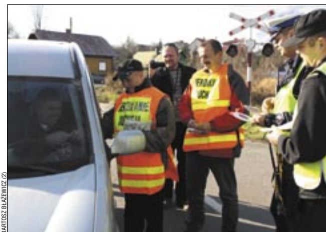
Zatrzymywani kierowcy otrzymywali ulotki i gadzety.

W 2010 roku na przejazdach w Polsce zdarzyło się 179 wypadków. Zginęły 22 osoby, a 39 zostało rannych. Najczęstszą przyczyną wypadków na przejazdach kolejowo-drogowych są błędy kierowców: brak reakcji na znak STOP, omijanie słomem zamkniętych rogatki, wjeżdża-