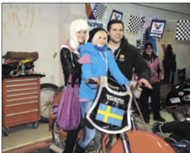
Dziewczętom podobały się nie tylko motory w parku maszyn, ale także ci, którzy nimi jeżdżą, walcząc na lodzie. Jak zauważyliśmy, chętnie pozowali z nimi do zdjęcia członkowie ekipy szwedzkiej.