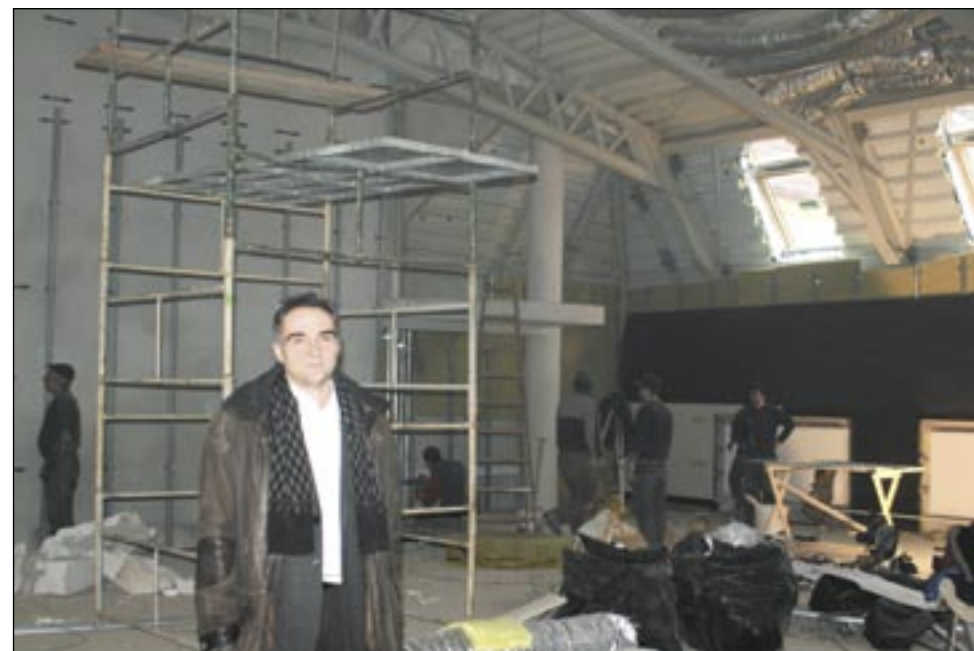
Sala tańca, która przypomina dziś jeszcze plac budowy, w ciągu najbliższych kilku tygodni zamieni się w prawdziwą „salę balową”. Buciki do tańca można już szykować!

Można ją zwiedzać od poniedziałku do piątku w godz. 13-19, do 5 lutego. W tym dniu o godz. 11 odbędzie się ogłoszenie wyników konkursu i wręczenia nagród laureatom. Z racji jubileuszowego charakteru imprezy organizatorzy zadbali o dodatkowe atrakcje w postaci wystawy fotograficznej „Latanie nad Bieszczadami” oraz kiermaszu i pokazowi niezwykłych modeli – także latających – przygotowanego przez Zbigniewa Zajacę z Krosna, przedstawiciela sklepu Hobby Model. /k/