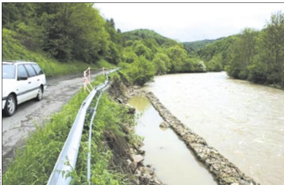
Zawaliła firma, powiat musiał oddać pieniądze... Oby w tym roku naprawa drogi poszła bardziej sprawnie i skutecznie!

Mimo pięknej pogody, prace od początku się ślimaczyły. – Wykonawca miał problemy z pozyskaniem materiałów określonych w projekcie oraz podwykonawca-