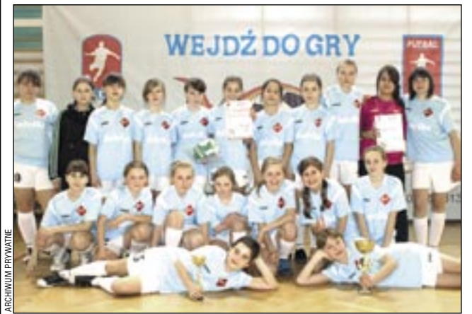
Zwycięska drużyna futbolistek z Trepczy.

Zima nie przeszkadza w działalności Gminnej Szkołki Piłkarskiej. Chłopcy i dziewczęta ostro trenują, a sprawdzianem tej pracy jest ich udział w turniejach halowych. Ostatnio uczestniczyli w Rzeszowie w 11 edycji turnieju „ORŁY CUP”.