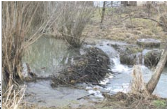
Tama bobrów znajduje się dokładnie na wysokości klubowych zabudowań.

Trudno w tym momencie wyrokować, czy bytowanie bobrów może zagrażać pobliskim ogródkom działkowym. Jak dotąd nikt nie zgłaszał nam problemów, które miałyby powstawać na skutek wylewania wody z potoku, spowodowanego przez tamę i zwalone drzewa. Więcej okaże się wiosną, gdy śniegi zaczną topnieć. Lub gdy bobry żyjąc