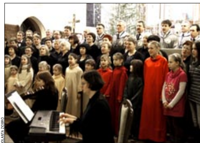
Wspólne koleďowanie w kościele Najświętszego Serca Pana Jezusa na Posadzie.