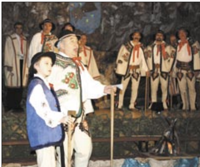
W rolę góralskich pasterzy, których gwiazda prowadzi do betlejemskiego żłóbka, znakomicie wcielił się członek chóru „Gloria Sanociensis. Zarówno starsi bacowie, jak i młodzi juhasi.

W drugiej części przeniesiśmy się do Betlejem, gdzie w grocie, na sianku leżało Dzieciątko. Pokłon przyszedł Mu oddać trzej królowie, a także sanoczanin. Jakże pięknie i wzruszająco zabrzmiały śpiewane