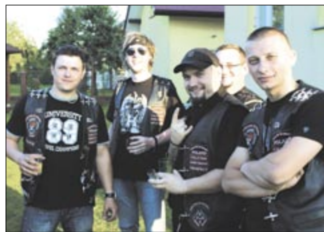
Członkowie „Pirates of Roads” w strojach służbowych.

Oczywiście mała i duża „Pęta” to najczęstszy kierunek weekendowych wypadów, ale nie stronią też od dłuższych tras. Często, wraz z zaprzyjaźnionymi klubami z Krosna, Rzeszowa czy Przemyśla, jeżdżą na tradycyjne zloty,