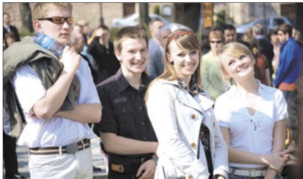
W Sanoku odbędzie się już szesnasty „SMAP”. Do Sanoka może przyjechać nawet kilka tysięcy młodych ludzi.

W ten sposób, po starym roczniku „dzieci kwiatów” czy generacji „no future”, rośnie nam kolejne pokolenie: „popularnych inaczej”. Czyli właśnie – „popólarnych”. Obłędnie.