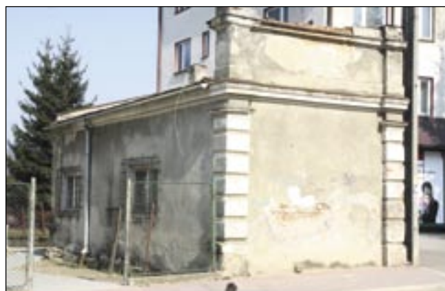
Jaki to zabytek? Toż to zwykła rudera...

– obecnie samochód do przewozu niepełnosprawnych trzyma tam Poradnia Psychologiczno-Pedagogicz-