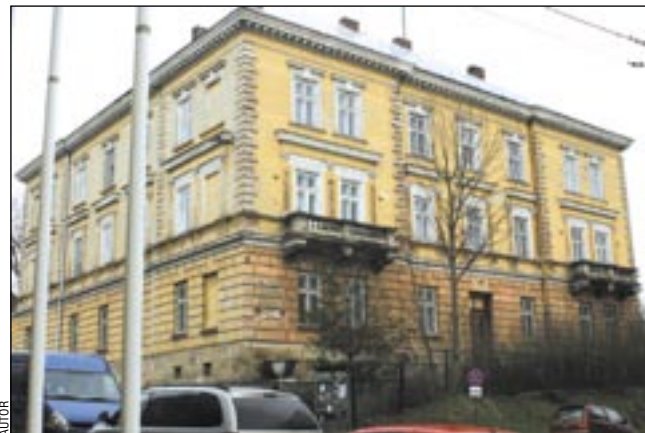
Budynek jest rzeczywiście okazały. Dobrze by było, aby jego właściciel zrobił z niego właściwy użytek.

Temat budynku po KP Policji nie może być dłużej odkładany. Wszak to 5 lat już mija od czasu, kiedy został przekazany Powiatowi Sanockiemu. W konkretnym celu, wskazanym nie przez kogo innego, a przez władze tegoż powiatu. Pięć lat stoi i niszczeje. I to jest wielka porażka samorządu powiatu poprzedniej kadencji. Nowa władza nie może odłożyć tej sprawy w czasie. Musi zmierzyć się z nią. Bez wątpliwości, że na forum internetowym ktoś napisze, iż buduje dla siebie pałac. Po pierwsze nie dla siebie, a głównie dla mieszkańców, którzy w XXI wieku chcieliby mieć łatwiejszy dostęp do urzędu i być