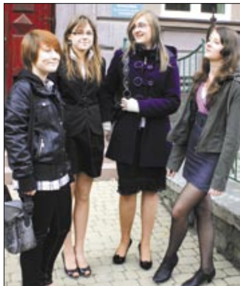
Gimnazjalistki z „Dwójki” – mimo trudnego testu humanistycznego – ogólnie były zadowolone.

Ostatnie dni były wyjątkowo gorące dla uczniów kończących gimnazja. We wtorek pisali test humanistyczny, w środę – matematyczno-przyrodniczy, w czwartek – językowy. Wyniki dwóch pierwszych (ostatni nie jest jeszcze w tym roku zaliczany do ogólnej punktacji) będą miały istotny wpływ na to, czy gimnazjalistom uda się dostać do wymarzonej szkoły średniej.