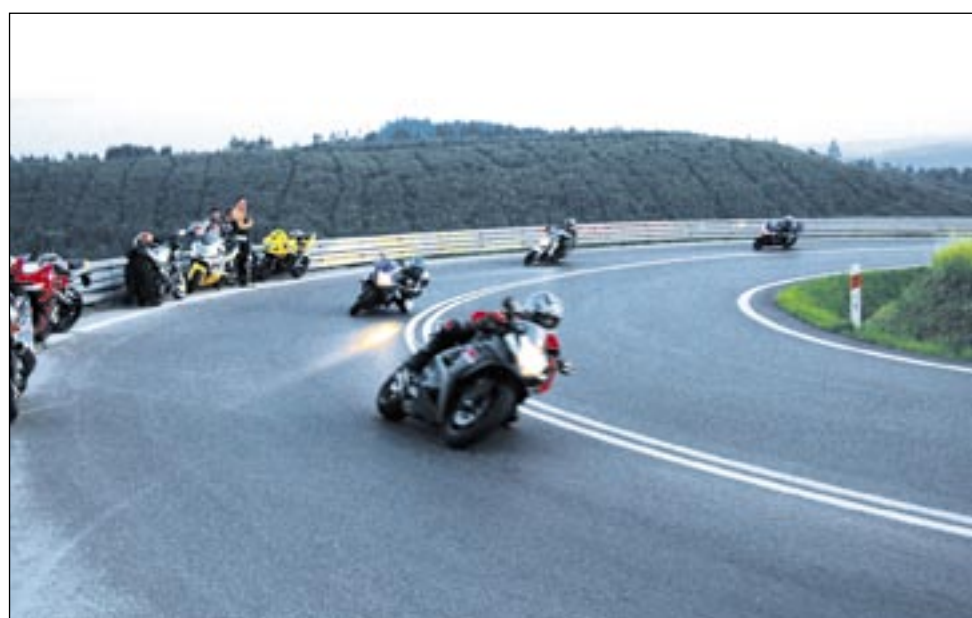
„Voodoo Riders” często jeżdżą po serpentynach Gór Słonnych.

w Bieszczady, by samemu przekonać się, że motocykle wracają do łask. I to nie jako zwykły środek lokomocji, ale przede wszystkim hobby łączące ludzi, którzy kochają przysłowiowy „wiatr we włosach”.