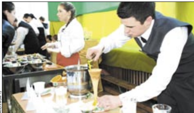
Do najbardziej kolorowych i smakowitych w ubiegłym roku należało stoisko „Ekonomika”, na którym uczniowie serwowali beزالkoholowe drinki.

zentując swoją ofertę. W tej sytuacji nie widzę powodu, aby moi uczniowie mieli jeszcze raz to oglądać, tym bardziej że formuła Giełdy nie jest najlepsza – wszyscy przekrzykują się wzajemnie i w tym rozgardiaszu niewiele słychać. Pierwsze edycje były OK, ale następne już nie. Proponowaliśmy organizatorom, aby zmienili formułę. Nie bojkotuję tej imprezy, ale uważam, że na coś powinni się zdecydować – albo niech będzie dobrze przygotowana Giełda, albo niech szkoły same się pro-