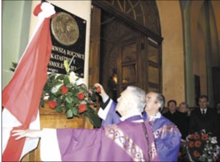
Oślonięcie pamiątkowej tablicy w przedsionku kościoła farnego.

Sanoczanie uczcili 71. rocznicę zbrodni katyńskiej i 1. rocznicę tragedii pod Smoleńskiem. W intencji ofiar odprawiona została msza święta, złożono kwiaty pod Krzyżem Katyńskim w farze – a wcześniej na Cmentarzu Centralnym – i wmurowano pamiątkową tablicę w przedsionku kościoła.