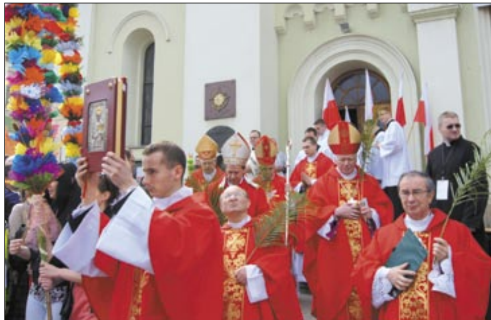
Młodzież przyjechała do Sanoka na trzydniową celebrację Niedzieli Palmowej. Na zdjęciu – uroczysta procesja wyruszająca spod kościoła farnego.