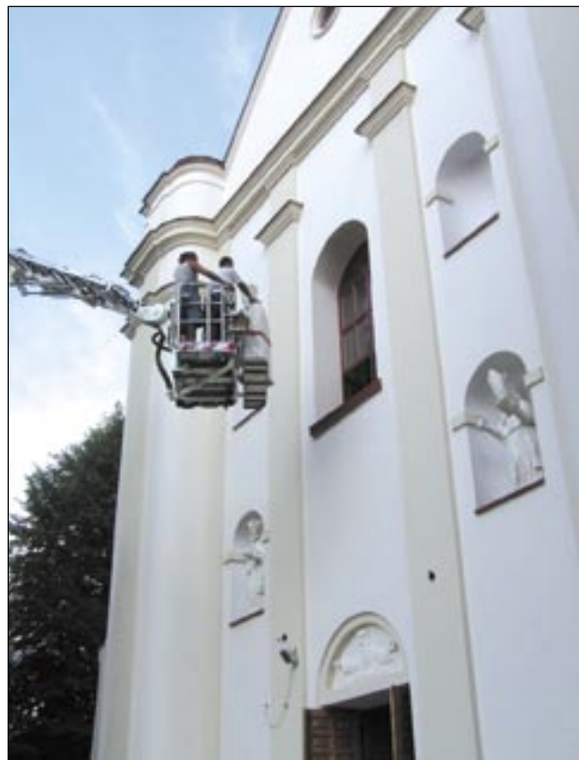
Kościół w Tyrawie Wołoskiej jest jednym z najcenniejszych zabytków sakralnych w okolicy. Pierwsze wzmianki o nim pochodzą z 1546 r. Prowadzona sukcesywnie od 3 lat renowacja świątyni powoli przywraca jej dawny blask.