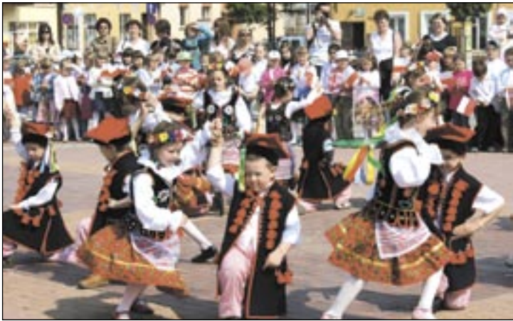
PRZEDSZKOLAKI Z BIAŁO-CZERWONĄ - to program, jaki zaprezentują na sanockim Rynku najmłodszy obywatele. To trzeba koniecznie zobaczyć! Zapraszamy w ich imieniu w piątek, 29 bm. o godz. 13.

Wcześniej, bo 28 kwietnia (czwartek) o godz. 11 na sanockim Rynku odbędzie się III Młodzieżowa Parada Niepodległości. O godz. 12 jej