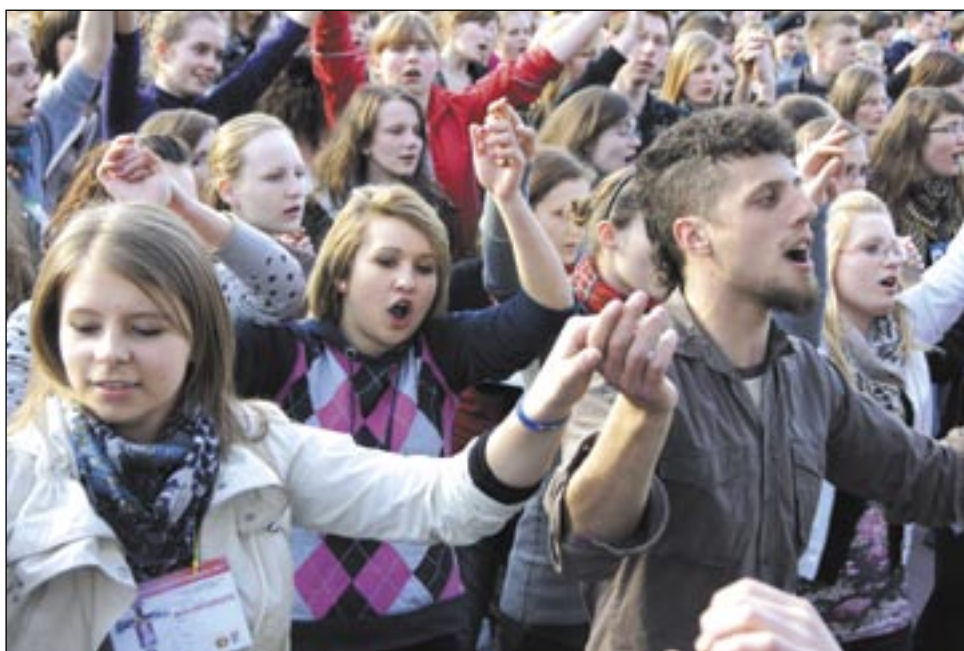
Świat zmienia się w szalonym tempie, ale natura ludzka pozostaje ta sama. Młody człowiek zawsze pyta o sens życia, dąży do ideałów. A te, w każdej epoce, są takie same: Prawda, Dobro, Piękno.

Najbardziej przejmującym momentem była adoracja krzyża w kościele pw. Chrystusa Króla. Nie wszystkim udało się wejść do środka; setki osób pozostały na zewnątrz, trwając na dwugodzinnej modlitwie. Głoszący Słowo Boże biskup Adam Szal przekonywał młodych słuchaczy, iż przeżyć życie prawdziwie i pięknie oraz osiągnąć cel – wieczność – można tylko w jeden sposób: zostając uczniem Chrystusa. A to oznacza: zapomnieć o sobie, zaakceptować krzyż i uczynić z Boga swojego „numer jeden”. – Droga, na którą