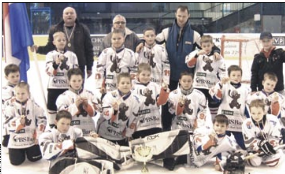
Młodsza drużyna Niedźwiadków z dumą prezentuje złote medale, wywalczone w Tychach.

–Naprawdę niewiele zabrakło do wygrania obu kategorii wiekowych. Ale najważniejsze, że pokazaliśmy kawałek dobrego hoke-