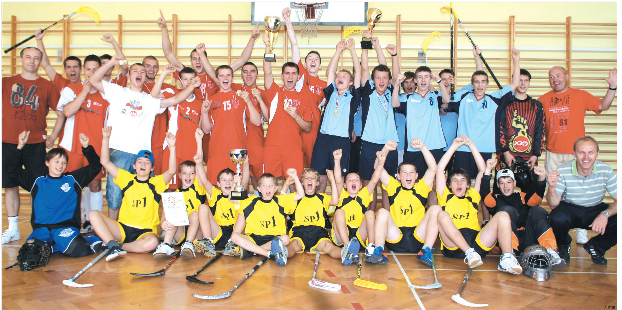
Radość wielka, bo i sukces niebywały. W Elblągu nasi unihokeiści wygrali co tylko się dało, zdobywając dla Sanoka wszystkie trzy puchary. Z lewej drużyna ILO, z prawej G1, a poniżej SP1.