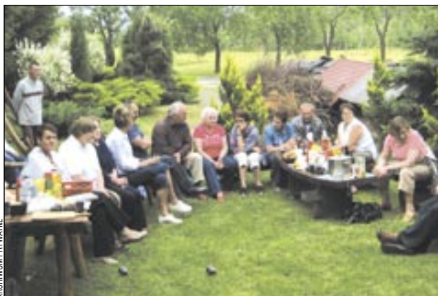
Takie spotkania z pewnością na długo pozostaną w pamięci!