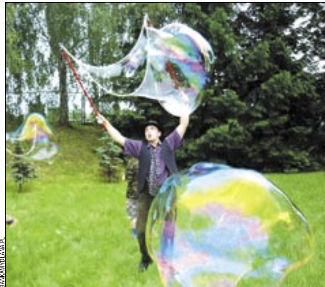
Jedną z atrakcji happeningu będą ogromne bańki mydlane.

„Twórczy Ludzie - Ludziom” to tytuł happeningu, na który w dniach 23-24 czerwca zapraszają sanocki „Bazar Sztuki” oraz zagórska Galeria BGTK. Przedsięwzięcie ma charakter społeczny.