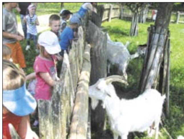
Majówkę zakończyło wspólne ognisko z kiełbaskami.

Od czego można zacząć poznawanie świata, jeśli nie od miejsca, w którym się urodziliśmy. Ładny kolorowy i piękny jest Sanok – orzekły dzieci, wypowiadając się na temat swojego miasta.