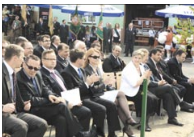
Pierwszy rząd zarezerwowany był dla gości honorowych imprezy.