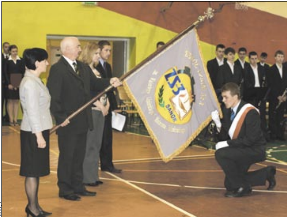
Uczniowie ZS3 ślubowali na sztandar, przekazany przez delegację z Autosanu.

Głównym punktem uroczystości było nadanie szkole imienia protoplastów dzisiejszego Autosanu, które nosić będzie od przyszłego roku szkolnego. Połączono to ze ślubowaniem uczniów i wniesieniem nowego sztandaru przez delegację z Autosanu, poświęconego przez ks. Piotra