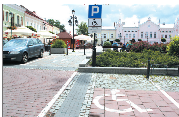
W mieście trwa prawdziwa walka o każdy skrawek, na którym można zaparkować. Za zaanektowanie miejsca dla niepełnosprawnych można dostać jednak mandat do 500 zł.