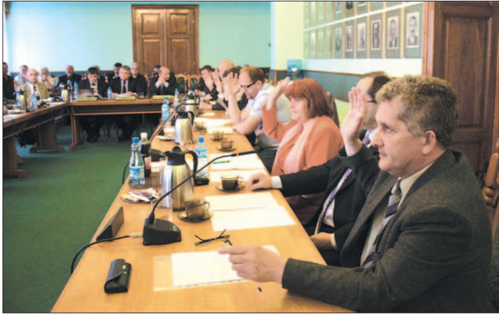
Radni sami zastanawiali się czy w powietrzu znajdują się jakieś fluidy, które usposabiają wszystkich tak życzliwie do siebie i pogodnie.

A w kuluarach jeden z radnych tak podsumował wydarzenie sesyjne: „21 głosów za udzieleniem absolutorium. To opozycja puściła „oczko” do burmistrza!”