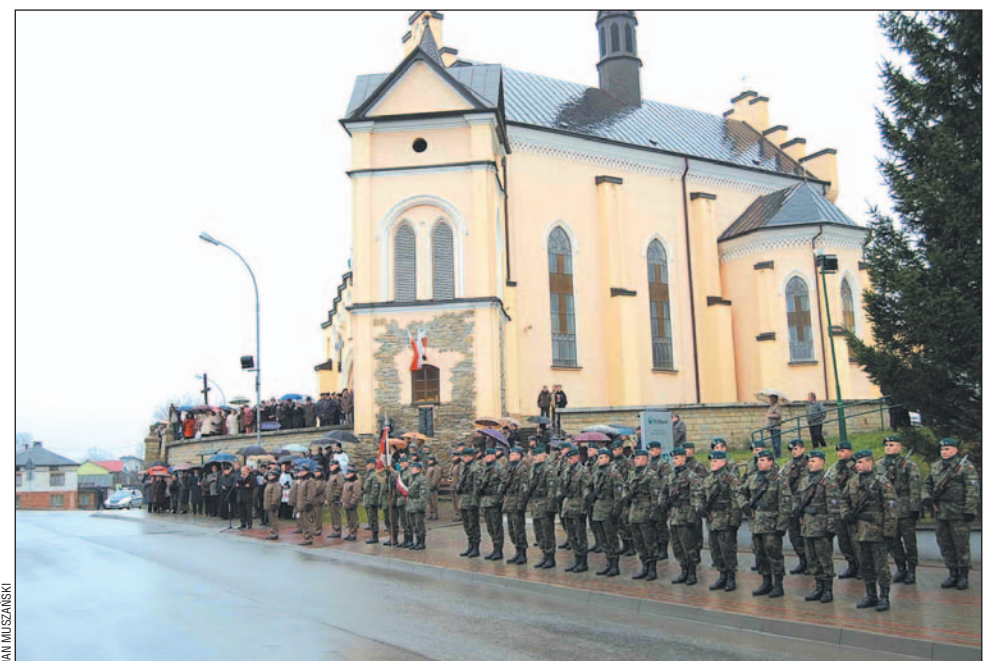
Neogotycki kościół pw. Podwyższenia Krzyża Św. jest jednym z najcenniejszych zabytków w gminie.

(W oparciu o „Parafia Bukowska ma już 650 lat” Katarzyny Hnat, „Bukowskie spółdzielcze dzieje” Kazimierza Rakoczego oraz „Gmina Bukowsko zaprasza” Jana Muszańskiego).