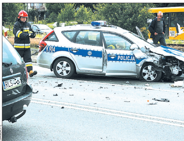
Dla policyjnej „kijanki” zderzenie okazało się znacznie bardziej bolesne niż dla passata...

Ze wstępnych ustaleń wynika, że kierowca passata, wyjeżdżając z podporządkowanej ul. Lisowskiego, wymusił pierwszeństwo na policyjnym radiowozie jadącym na sygnalach. Policjanci nie zdolali wyhamować, w wyniku czego doszło do zderzenia, w którym zdecydowanie bardziej ucierpiało policyjne kia. Funkcjonariuszy i kierowcę volkwagena przebadano na alkomacie. Wszyscy byli trzeźwi. Normalny ruch na wspomnianym odcinku przywrócono około godz. 13.30. /k/