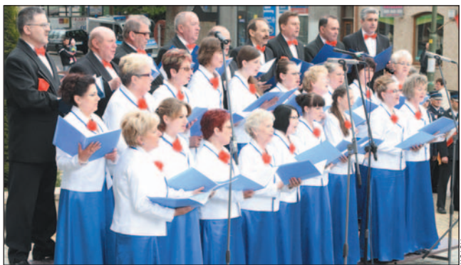
Chór „Gloria Sanociensis” podczas tegorocznego występu pod pomnikiem Tadeusza Kościuszki z okazji święta 3 Maja.

odpowiedzialność utrzymania tego, co z takim trudem zostało zdobyte. Miniony rok pokazuje, że potrafimy to robić – mówi w sprawozdaniu prezes Towarzystwa. Przypomniał dwie premiery: „Kole-dowe wieczory”, czyli jasełka oraz specjalny program związany z beatyfikacją Jana Pawła II. Sanoczanie pamiętają też ich występ podczas uroczystości 3 Maja pod pomnikiem Tadeusza Kościuszki.