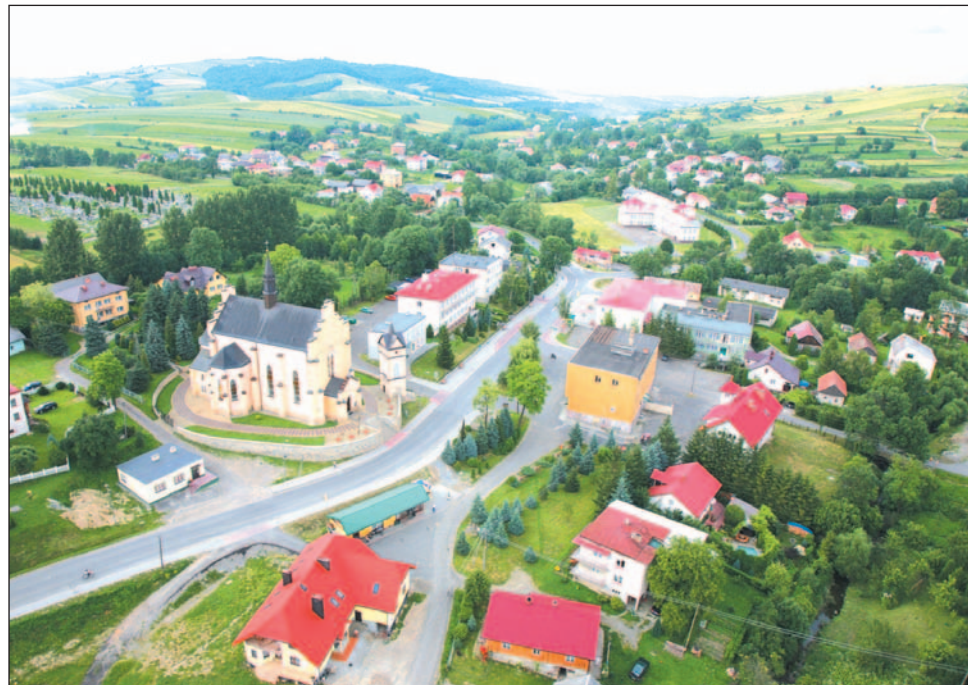
Oglądane z tej perspektywy Bukowsko nabiera dodatkowych walorów.