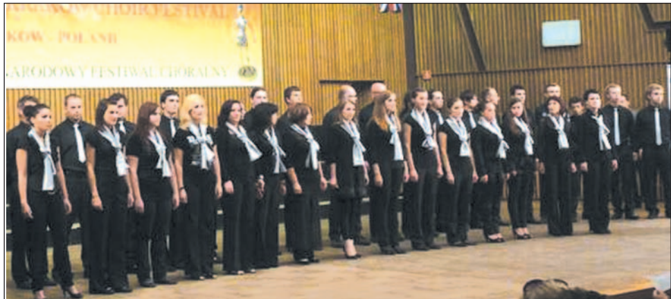
Gdyby oceniano nie tylko śpiew, ale i prezentację, „kameraliści” z sanockiej PWSZ mieliby szansę na kolejną nagrodę...