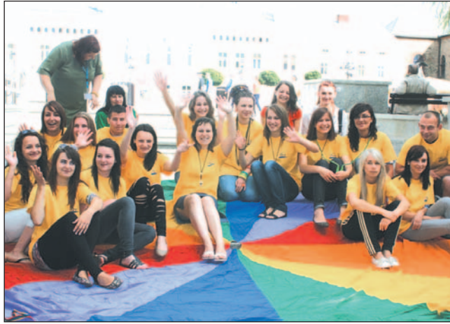
Silna Grupa pod Wezwaniem, czyli Wychowawcy Podwórkowi AD 2011.

Miejscowa dziatwa, która wakacje spędza w domu, nie będzie się nudzić. Zadbali o to Urząd Miasta, organizując kolejną edycję Sanockiego Lata Podwórkowego. Czwarta odsłona tej niezwykle udanej akcji, której pomysły „kupili” już wiele samorządów w Polsce, zainaugurowana została w miniony poniedziałek odprawą prowadzących zajęcia wychowawców podwórkowych.