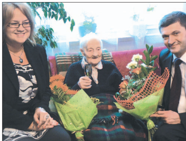
Jubilatkę odwiedzili m.in. przedstawiciele KRUS-u i USC.