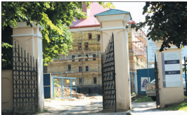
Sanocki zamek z 50-tysiącami turystów rocznie jest na trzecim miejscu na Podkarpaciu – po Łańcucie i MBL – pod względem liczby odwiedzających. Głównym magnesem dla turystów polskich jest malarstwo Beksińskiego.