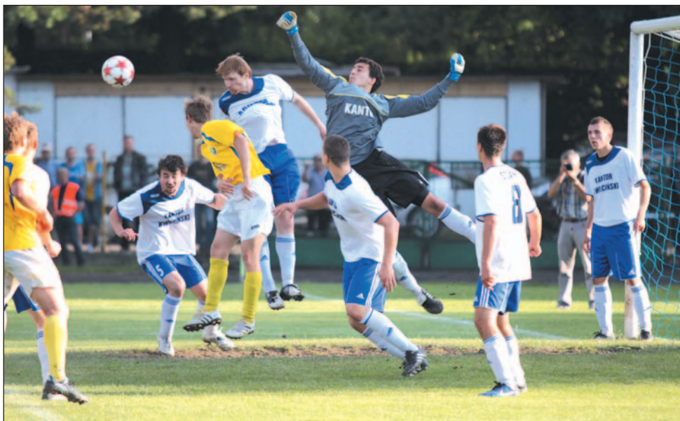
I co z tego, że w drugiej połowie pod bramką Turbii było gorąco! Cztery bramki okazało się o jedną za mało, aby awansować w Pucharze Polski do dalszych gier. Przegrany mecz w Turbii (3-0) będzie długo się snić po nocach stalowcom.