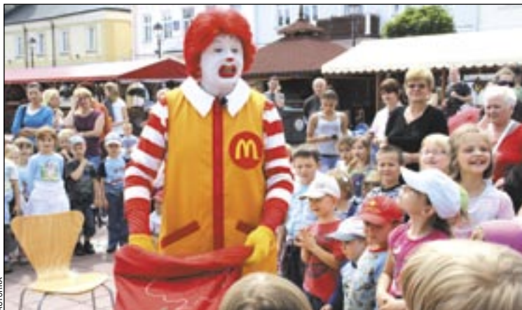
Wstrząsające wręcz informacje na temat fastfoodów np. okresu trwałości, składu, skutków spożywania, można znaleźć wszędzie i nie podlega żadnej dyskusji, że dzieci należy trzymać od nich z daleka. Dlatego zaproszenie przedszkolaków na spotkanie z clownem z McDonalda to nieporozumienie.