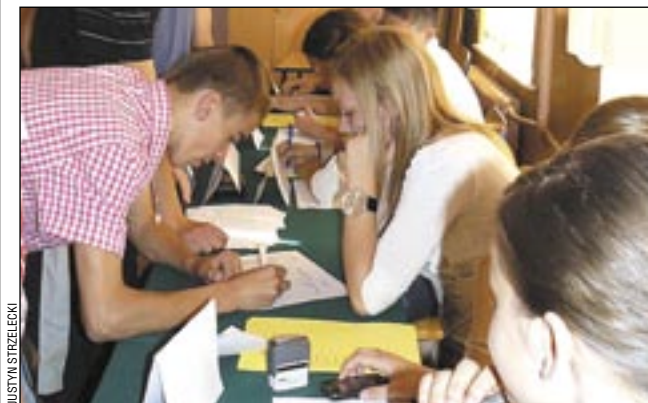
Zagórz jest pierwszą gminą w okolicy, która ma swoją młodzieżową radę. Brawo!