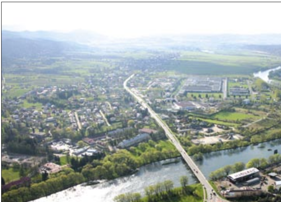
Olchowce – dzielnica dość spokojna, w której jednak nie brakuje najróżniejszych potrzeb.

Członkowie rady liczą, że wkrótce w Olchowcach zarozi się od obiektów sportowych, które nieco zmienią krajobraz dzielnicy. Przede wszystkim powstać ma boisko wielofunkcyjne przy Szkole Podstawowej nr 6. W planie jest także budowa kolejnego, pomiędzy lasem a plebanią, o co bardzo zabiega nowy proboszcz miejscowej parafii. – Potrzebny jest również gruntowny remont boiska i placu zabaw, znajdujących się w pobliżu „Domu Strażaka”.