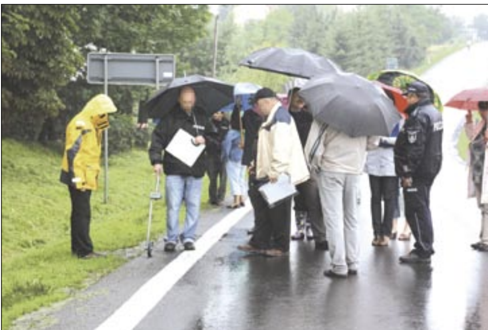
Fatalna pogoda nie ułatwiała badań i pomiarów – smagani deszczem uczestnicy eksperymentu spędzili na miejscu zdarzenia prawie dwie godziny.

Eksperyment wymagał określonych działań logistycznych, w przeprowadzeniu których po-