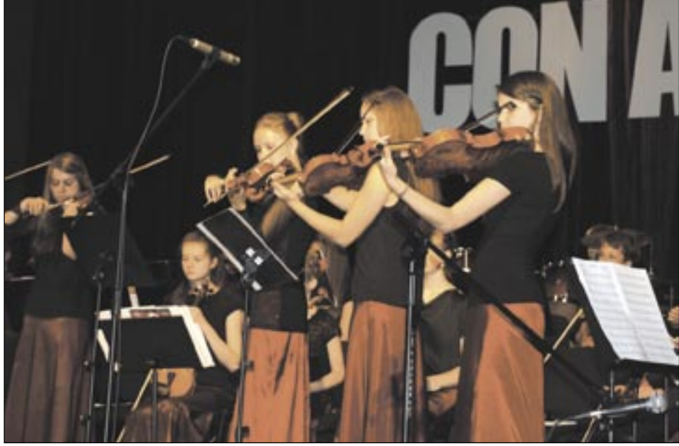
Piękna muzyka, elegancja strojów i uroda skrzypaczek stanowiły znakomitą oprawę jubileuszowego koncertu.

Jubileuszowy koncert zespołu kameralnego Con Amore zgrupował w sali widowiskowej SDK tłumy widzów. I nic dziwnego, jako że okazja była wyjątkowa – 10-lecie zespołu, który wpisał się już na stałe w pejzaż miasta, wzbogacając jego życie kulturalne.