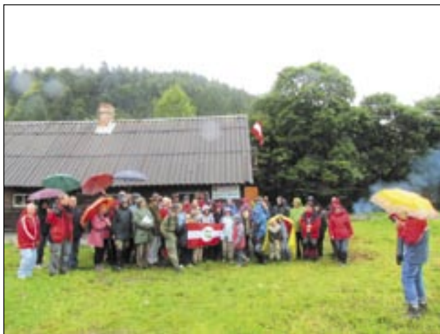
Dzielnicy piechurzy dotarli nad Jeziorka Duszatyńskie, uważane za jedno z ciekawszych miejsc w Bieszczadach.