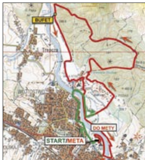
Trasa wyścigu Hobby.

Już w przyszłą niedzielę (17 lipca) czwarty rok z rzędu zagości u nas Maraton Rowerowy CYKLOKARPATY. Jego stali uczestnicy, głównie kolarze z Podkarpacia, przyjadą walczyć o punkty, a dla miejscowych cyklistów będzie to świetna okazja, by wziąć udział w prawdziwym wyścigu górskim.