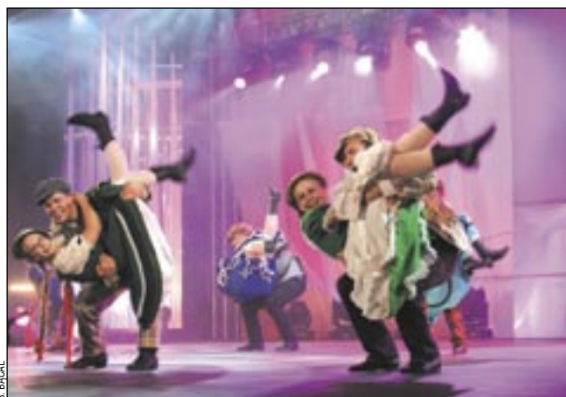
Do tej pory Światowy Festiwal Polonijny odbywał się głównie w Rzeszowie, teraz zagości również w Sanoku.

– Podczas wakacji mamy wprowadzić swój tradycyjny „Kermes Karpaccich Smaków”, ale zdecydowaliśmy się na organizację jeszcze jednej imprezy w podobnym klimacie. „Niedziela Polonijna w Gminie Sanok” będzie miała znacznie szerszą formę promocji gminy i Ziemi Sanockiej,