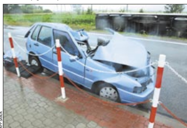
Kierowca fiata uno nie miał szans – zginął na miejscu...

Ze wstępnych ustaleń wynika, że kierowca fiata – włączając się do ruchu z prywatnej posesji – najprawdopodobniej nie ustąpił pierwszeństwa poruszającej się po drodze głównej ciężarówce z naczepą. Tir uderzył w bok fiata, po czym zjechał do rowu i przewrócił się. Siła uderzenia była ogromna – zakleszczonego kierowcę fiata wydostano ze środka dopiero po przecięciu karoserii. 75-letni mężczyzna zginął na miejscu w wyniku odniesionych obrażeń. Kierujący ciężarówką 49-latek był trzeźwy. W chwili wypadku na drodze pa-