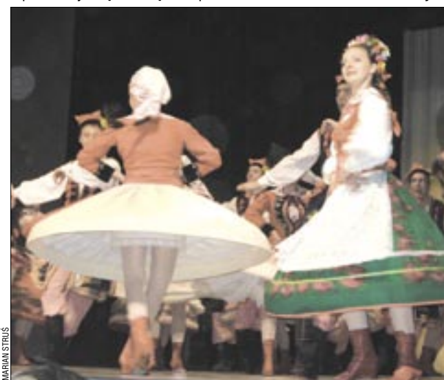
Sanoczanie kochają tańce ludowe. W SDK mogą je oglądać dzięki ZTL Sanok, w skansenie zobaczą zespoły z całego świata.