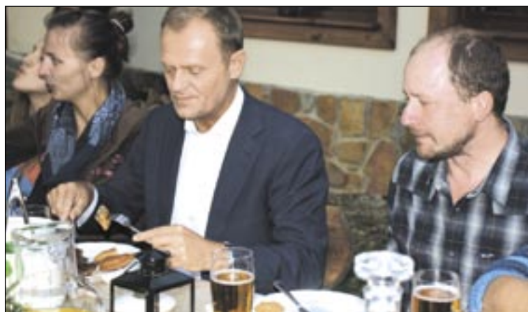
Smakowite regionalne potrawy i sympatyczne rozmowy o turystyce w Bieszczadach, o koniach i aktywnym wypoczynku, a to wszystko na świeżym powietrzu w scenerii otaczających gór. Czy może być coś piękniejszego? Na zdj. premier Donald Tusk, obok gospodarz pensjonatu Kulbaka Krzysztof Francuz.

Na następny dzień był jeszcze jeden kontakt z organizatorami wypadu premiera w Bieszczady. – Tym razem to już my pytaliśmy, a chodziło o kolację i śniadanie, na ile osób mamy je przygotować i jakie wybrać menu. I znów zaskoczenie. – Jeśli to państwa gościom nie będzie przeszkadzać, premier zaprasza ich do wspólnej kolacji. Goście zjeżdżali się w sobotę przez cały dzień. Od nas dowiadywali się,