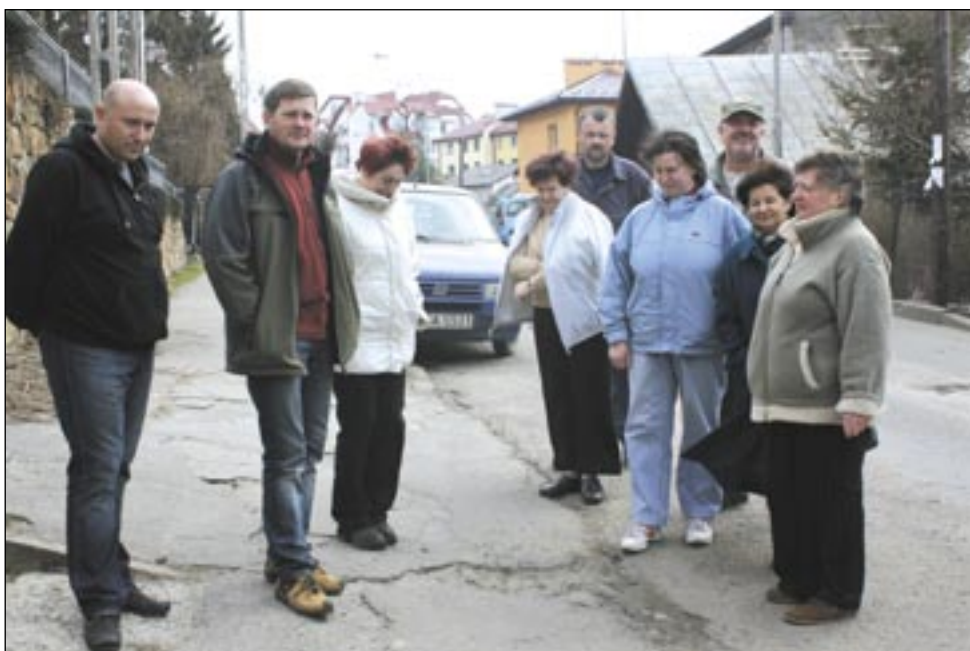
Mieszkańcy ulicy Matejki doczekają się wreszcie remontu swojej ulicy.