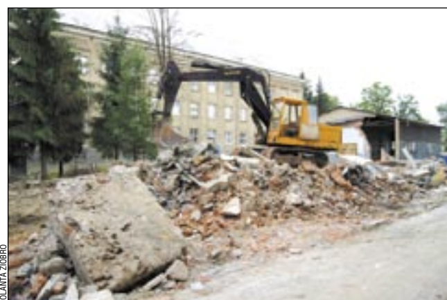
Po wakacjach z dawnych warsztatów pozostanie tylko wspomnienie...

Męską decyzję – o rozbiórce – podjęły dopiero obecne władze powiatu. – Zrealizowaliśmy po prostu to, co uchwalono sześć lat temu. Nieruchomość doprowadzono do takiego stanu, że nie