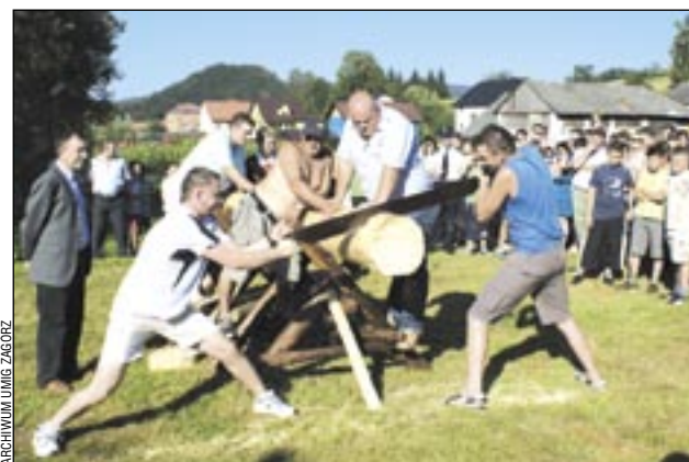
Tu liczy się nie tylko siła, ale i zgodna współpraca.

Ciekawie zapowiada się V Festyn Rekreacyjno-Sportowy, który odbędzie się w najbliższą niedzielę (24 bm.) na stadionie LKS w Łukowem. Mnóstwo konkursów dla małych i dużych, atrakcyjne nagrody, występy artystyczne, zabawa ogrodowa i pokaz sztucznych ogni to najważniejsze punkty bogatego programu, jaki przygotowali organizatorzy.