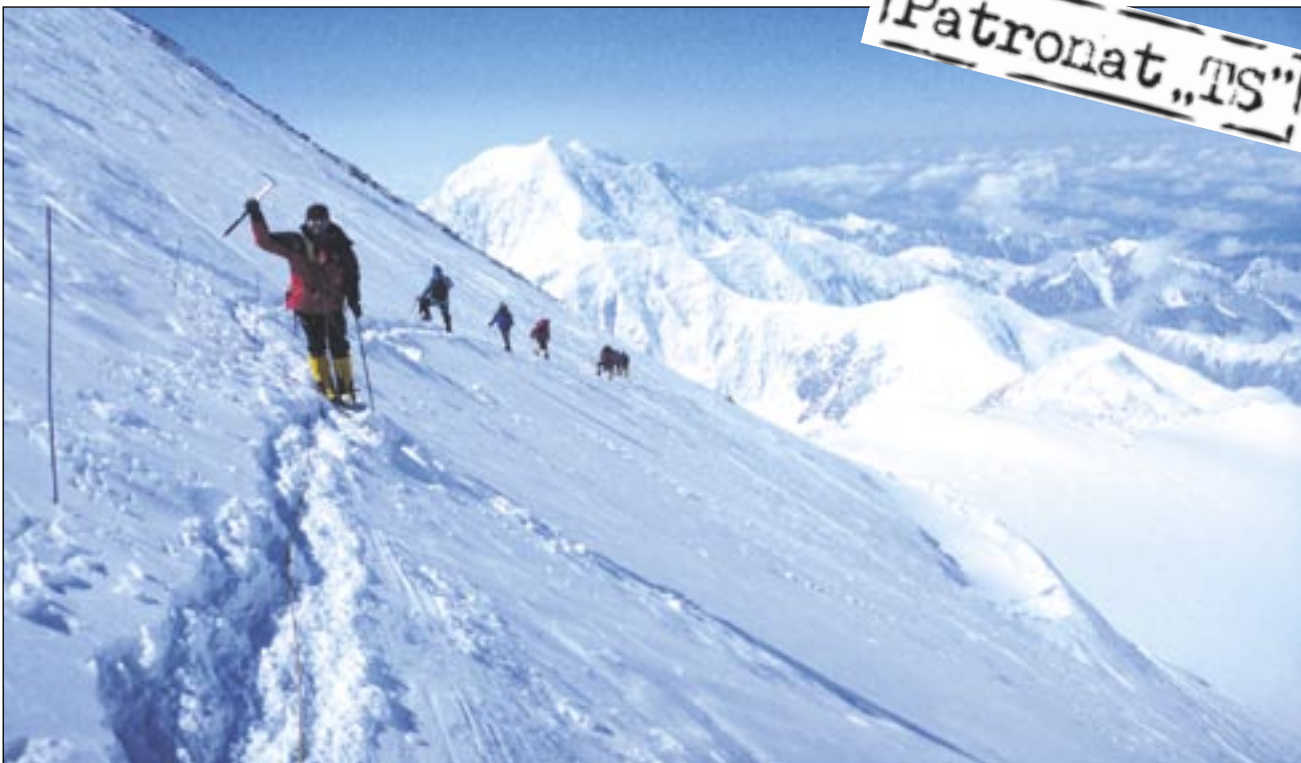
- Atak szczytowy. Największy wysiłek i pełna mobilizacja. W zasięgu wzroku cel: McKinley i możliwość popatrzenia na Ziemię z wysokości niedostępnej większości śmiertelników – 6192 metrów nad poziomem morza.