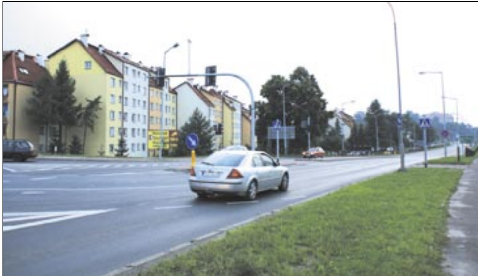
Odległość między blokami a drogą jest bardzo mała, dlatego hałas, który dochodzi z ulicy, jest wyjątkowo uciążliwy.

wach. Zagadnienie jest jednak złożone. Dla wszystkich dróg krajowych, na których ruch przekracza 16 400 pojazdów na dobę, wymagane jest sporządzenie map akustycznych, opartych na szczegółowych badaniach dźwięku. – Odcinek drogi krajowej nr 28, przebiegający przez miasto Sanok, został objęty obowiązkiem opracowania map akustycznych w pierwszej kolejności. Mapy te zawierają wszystkie niezbędne informacje o stanie środowiska akustycznego oraz stanowią pod-