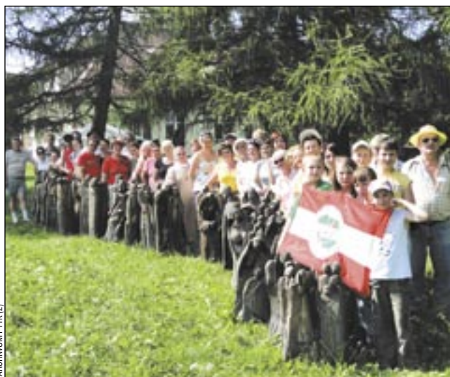
Zachwyt wzbudziła rzeźba zatytułowana „Exodus”, którą uwieczniono na wspólnym zdjęciu wszystkich uczestników wycieczki.