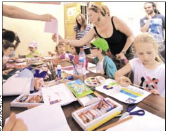
Ciekawe techniki, świetni instruktorzy, obok mamusia... Nic dziwnego, że warsztaty w Bazarze tak bardzo przypadły dzieciom do gustu.

Kolejne zajęcia odbędą się w sierpniu. W programie m.in. dwa spotkania poświęcone technice batik (2 i 9 sierpnia), ekoplastyce (16 sierpnia), ekspresjom muzyczno-rytmicznymi (23 sierpnia) i biżuterii modelinowej (30 sierpnia). – Mamy już właściwie komplet, ale