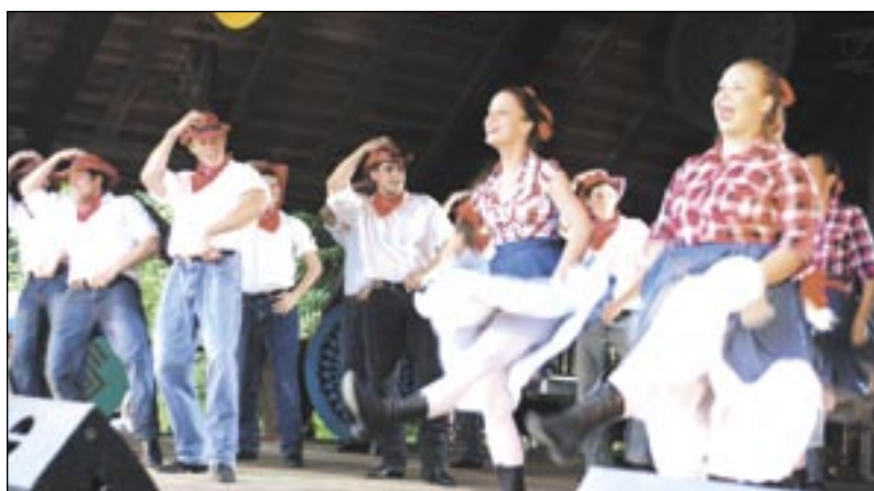
Podczas kowbojskiego „Cotton Eye Joe” w wykonaniu chicagowskiej Polonii nogi same rwały się do tańca.

i proziaki, równie szybko znikają smakowite serniki, jabłeczniki i makowce. – Próbowałem pierogów z kapustą. Pyszne! Takie same robiła moja babcia – podkreślał młody tancerz z chica-