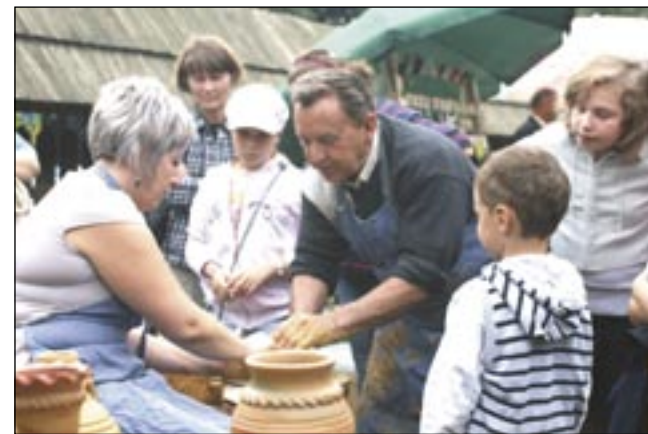
Mistrz garncarski z Medyni Głogowskiej chwalił swą uczennicę, choć terminowanie nie było wcale łatwe...