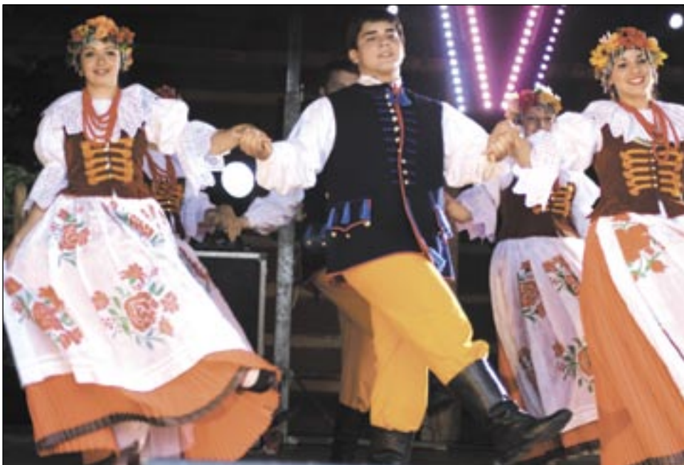
Tancerze kanadyjskiego zespołu Polonez zachwyceni bogactwem strojów, znakomicie prezentując się m.in. w tańcach śląskich.

Koncertowi, w przerwie którego wystąpiła kapela „Kamraty”, towarzyszył kiermasz rękodzieła oraz swojskiego jadła, serwowanego przez kilkanaście KGW z gminy Sanok. Wzięcie miały gołąbki ziemniaczane, pierogi