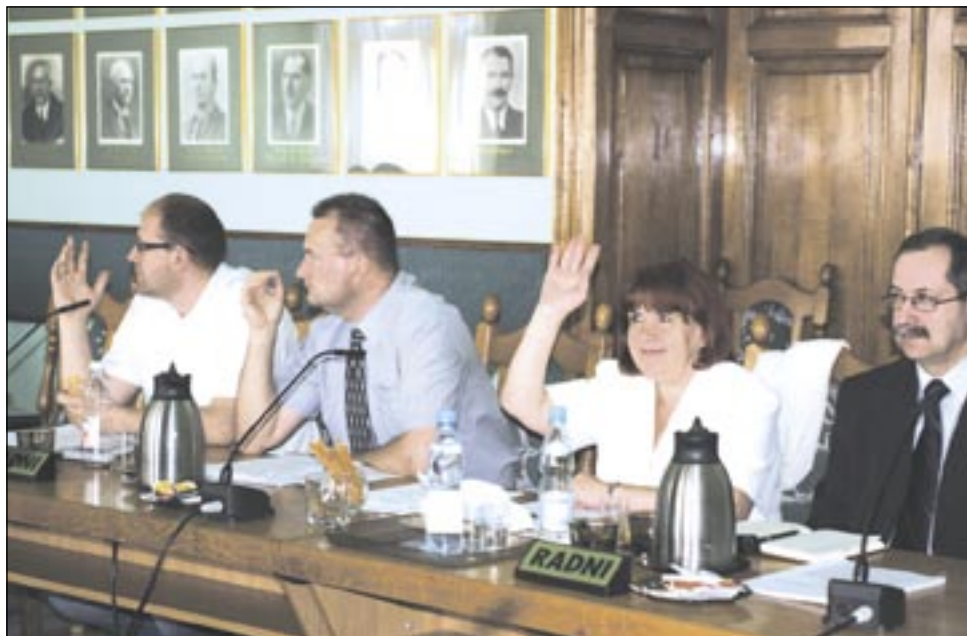
Najpierw opinie komisji, potem dyskusja nad projektem uchwały, zgłaszanie wniosków, aż wreszcie głosowanie. I kolejny punkt porządku obrad. Podczas ostatniej sesji (21 lipca) ten porządek zawierał 32 punkty. Ich omawianie zajęło radnym ponad siedem godzin!