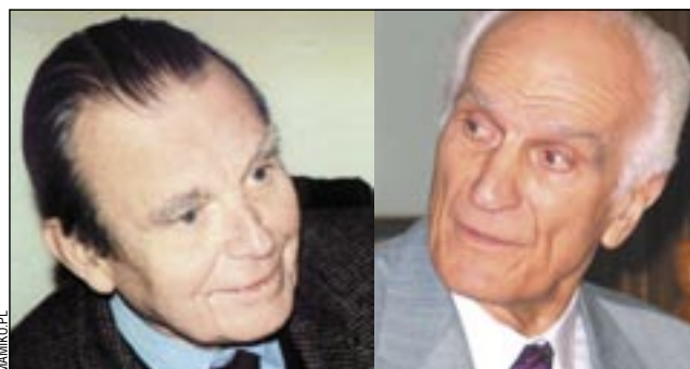
Czesław Miłosz i Marian Pankowski.

łosz. Późniejszy noblista co prawda nie skrytykował wszystkich aspektów powieści, a nawet kilkakrotnie podkreślał walor artystyczny języka autora („jego rzadki dar słowa trzeba cenić”); jednak pewne jego negatywne sformułowania były dość dosadne. Miał zresztą tego świadomość, skoro kończył swój tekst słowami: „Skutek tej recenzji będzie prawdopodobnie ten, że Pankowski przysięgnie mi dogonną nienawiść”.