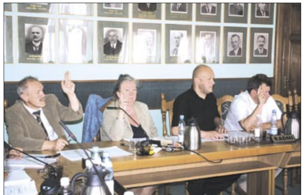
Nawet w koalicyjnym gronie nie wszyscy głosują tak samo. I słusznie, do gdyby tak było, z sesji wiałoby potworną nudą.

Obecnie w mieście istnieją 4 samorządowe przedszkola publiczne, a od 1 września br. będzie działać 11 oddziałów przedszkolnych w 4 szkołach podstawowych.