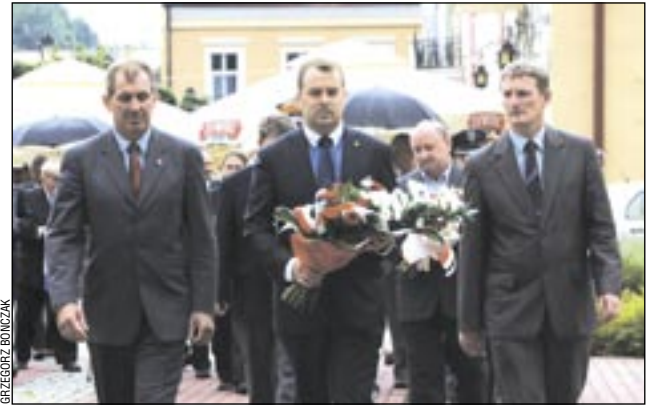
W pierwszym szeregu szli przedstawiciele powiatu i gminy.

Kwiaty i znicze pod pomnikiem „Synom Ziemi Sanockiej” – w ten sposób władze samorządowe i organizacje kombatanckie uczciły Święto Wojska Polskiego.