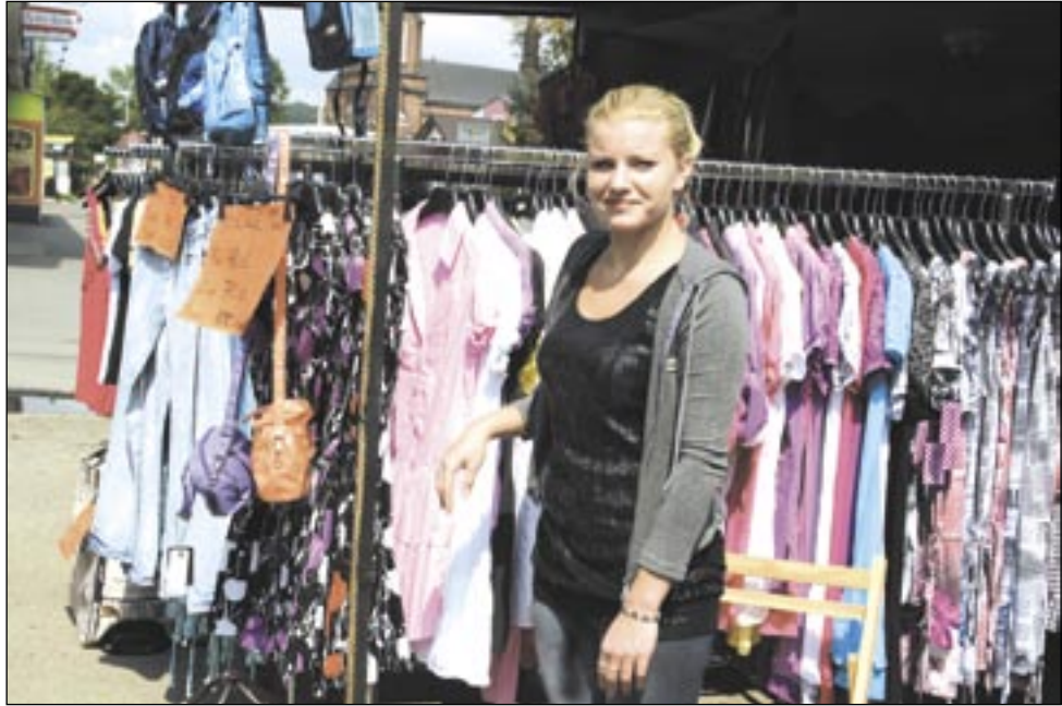
Przez najbliższy rok targowisko przy Lipińskiego będzie funkcjonowało w spartańskich warunkach.

Stowarzyszenie Kupców i Przedsiębiorców Miasta Sanoka „Zielony Rynek” chce gwarancji od władz miasta, iż po zakończeniu budowy targowiska przy ulicy Lipińskiego, handlujący – którzy w związku z inwestycją musieli opuścić plac – będą mieli prawo pierwszeństwa w zagospodarowaniu nowo powstałych stoisk.