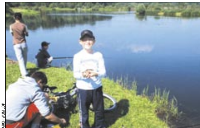
Młodzież bardzo polubiła kursy nad stawem w „Sosenkach”.

Podobnie jak przed rokiem, Liga Ochrony Przyrody i Społeczna Straż Rybacka znów organizują kursy wędkarskie dla dzieci i młodzieży. Chętnych było dwa razy więcej niż miejsc, a frekwencja na zajęciach jest stu procentowa.