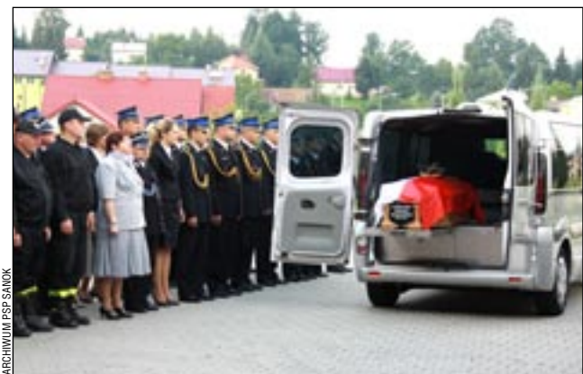
Przy dźwiękach „Ciszy” strażacy pożegnali swojego komendanta.