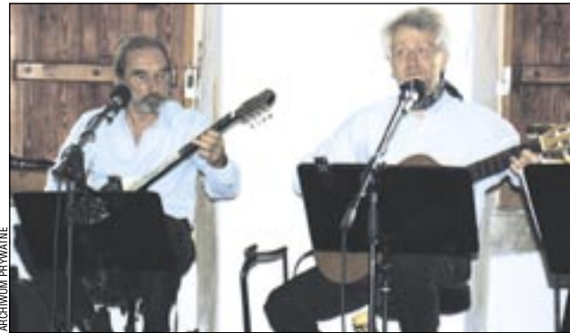
Muzykom z „Latającego dywanu” przyświeca szlachetny cel: remont cerkwi w Baligródzie.

To fragment piosenki, którą zespół „Latający Dywan” zagrał w sanockim zamku. Choć pochodzą z Mazowsza, są bardzo związani z Bieszczadami, co słychać w ich tekstach.