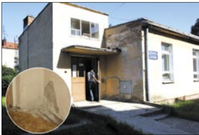
Budynek do jak najszybszej likwidacji...

Trudno powiedzieć, gdzie jest gorzej – na zewnątrz czy w środku. W ciemni odpadają płytki, ze ścian luszczą się farba, budynek jest zagrzybiony i zawilgoceny, przecieka dach. Do tego dochodzi nieogrzewana toaleta, na dodatek koedukacyjna. – To nie jest placówka, która nie ma żadnego znaczenia. Świadczyliśmy usługi dla całego miasta i wszystkich okolicznych gmin, to jest ponad 70 tys. mieszkańców – informuje jeden z pracowników. W środku mieszczą się dwie pracownie: mammografii oraz rentgenodiagnostyki. O skali problemu najlepiej świadczy fakt, że w ciągu jednego dnia z usług RTG korzysta nawet kilkadziesiąt osób. W obu pracowniach łącznie zatrudnionych jest 5 pracowników. Było ich więcej, ale po 2008 r. większość została przeniesiona do drugiej placówki przy ulicy 800-lecia. Ci, którzy zostali, muszą znosić tragiczne warunki przypisane wszystkim obiektom „skansenu” przy Konarskiego.