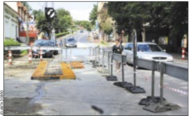
Piesi chodzą po ruchliwej drodze jak po deptaku. Oby nie doszło do tragedii.

przez nas projekt organizacji ruchu nie przewiduje takiego rozwiązania i musimy tego się trzymać, również ze względów bezpieczeństwa. – konkluduje naczelnik Stryjak. Ekipa potrzebuje miejsca na rozładunek, składowanie elementów i manewry sprzętem.