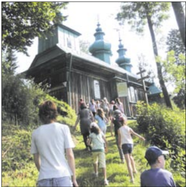
Uczestnicy „Słonecznej Przygody” podczas jednej z wycieczek.

Każdy z turnusów opierał się o inną tematykę. Pierwszy z nich nosił tytuł „Dziedzictwo kulturowe regionu”, stąd zajęcia w zamku, nauka pisania ikon czy wycieczka szlakiem starych cerkiewek. Dzieciaki były wyjątkowo zainteresowane historią dawnych budowli sakralnych, o których opowiadał przewodnik PTTK, z zapalem ćwiczyły pisanie ikon, poznając tajniki tej trudnej sztuki w pracowni przy ul. Franciszkańskiej. Drugi turnus promował zdrowy styl życia. Dzieci wzięły udział w spotkaniu z funkcjonariuszami policji, którzy ostrzegali najmłodszych przed niebezpieczeństwami, jakie mogą ich spotkać. Nad bezpieczeństwem i zaplanowaniem zajęć dla dzieci