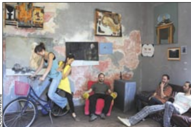
Klimat „Bazar Sztuki” spodobał się muzykom grupy KOREJN.

Galeria „Bazar Sztuki” nie ma wakacji. Ostatnio niecodzienny koncert zagrał tam zespół KOREJN z czeskiej Pragi.