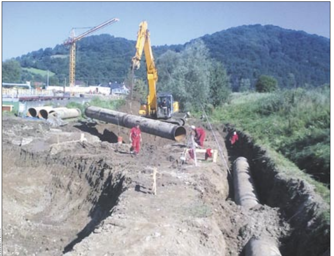
Za dwa lata Sanok będzie miał nowoczesną Oczyszczalnię Ścieków. Niestety, ekologia kosztuje i to strasznie dużo. Czy społeczeństwo będzie w stanie udźwignąć taki ciężar finansowy?

Z tematem radni zmierzają się już we wrześniu, podczas specjalnej debaty. – Za wzrastającą jakością trzeba coraz więcej płacić. Dotyczy to nie tylko gospodarki wodno-ściekowej, ale wszystkich dziedzin życia – nie ukrywa wiceburmistrz Borowczak.