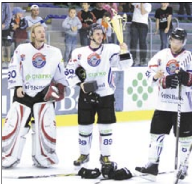
Bo puchar jest nasz, puchar nam się należy...