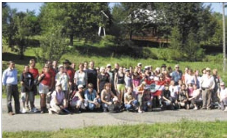
Uczestnicy ostatniej wyprawy ledwo się zmieścili w obiektywie fotografa...

Jak bardzo polubili sanoczanie – i nie tylko – niedzielne wakacyjne wycieczki PTTK, widać na podstawie frekwencji z ostatniej imprezy. Udział w niej wzięło blisko 80 osób (!): 60 z Sanoka i prawie 20-osobowa grupa mieszkańców gminy Nozdrzec i Dydnia.