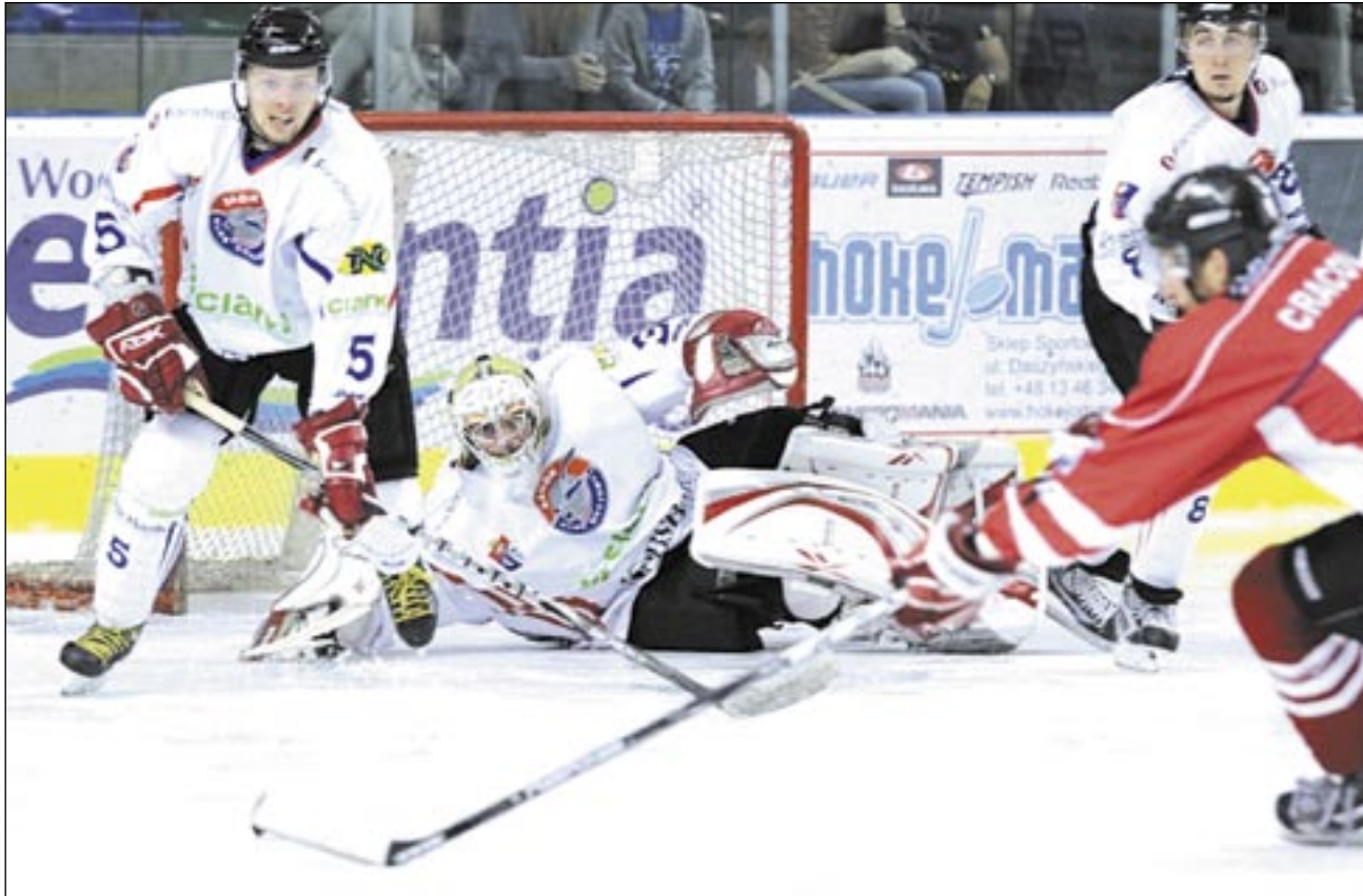
W ostatnim meczu Cracovia starała się zagrozić naszej bramce, ale niewiele z tego wychodziło. Mistrza Polski pokonaliśmy 4-1.

W ostatniej tercji wyżej notowani rywale wreszcie objęli prowadzenie. Ładnie pod poprzeczkę przymierzył Kapus, ale bramka została uznana dopiero po analizie zapisu wideo. Nie wiadomo dlaczego, bo go był ewidentny. Nie mając już nic do stracenia, gracze Ciarko PBS Bank postawili wszystko na jedną kartę. Pod koniec meczu, gdy znów graliśmy w przewadze, trwało prawdziwe obłędzenie bramki gości.