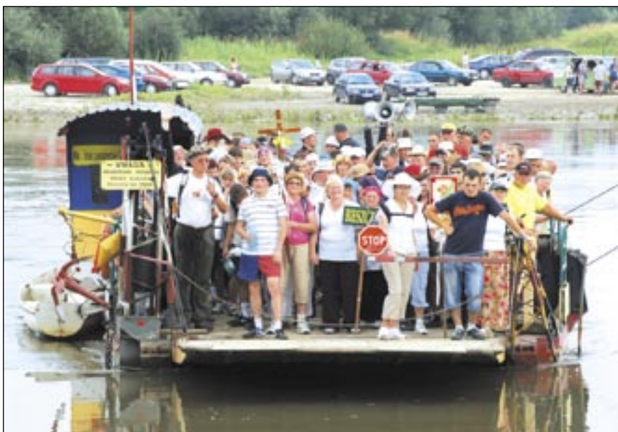
Każdego roku w „Bieszczadzkiej grupie” wędruje przynajmniej kilkunastu sanoczan

Bakcyła pielgrzymowania mogą połknąć nawet dzieci, dziś tak rozpieszczane, wydelikaczone, nienawykłe do wy-