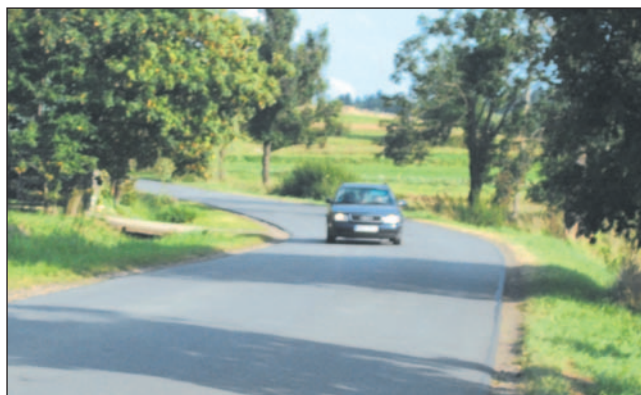
Dzisiaj w tym miejscu nie ma już śladu po niedzielnej tragedii...

– To straszne, że targnął się na swoje życie... Ale nic go nie tłumaczy... Tyle nieszczęścia sprowadził na te biedne dziewczyny... Spać nie mogę, jak o tym myślę... Codziennie modłę się, żeby z tego wyszły – dodaje ze łzami w oczach jedna z sąsiadek.