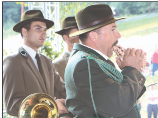
Mistrzostwa Galicji w naśladowaniu głosu jelenia z powodzeniem można by przekształcić w Mistrzostwa Polski, czy Karpat. Nasi, galicyjscy myśliwi ryczeć pięknie!

oparta, serwująca myśliwskie przysmaki, że palce lizać.