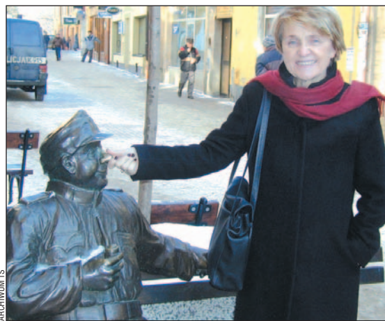
Sanocki Szewek kiedyś przyniósł szczęście Danucie Hübner. Komu teraz ona przyniesie?

Na niedzielne (4 września) spotkanie z uniijną komisarz Danutą Hübner organizatorzy zapraszają o godz. 19. do Muzeum Historycznego. Przewodnicząca Komisji Rozwoju Regionów spędzi na Podkarpaciu dwa dni, odwiedzając w tym czasie Rzeszów i Sanok. Przyjedzie na zaprosze-