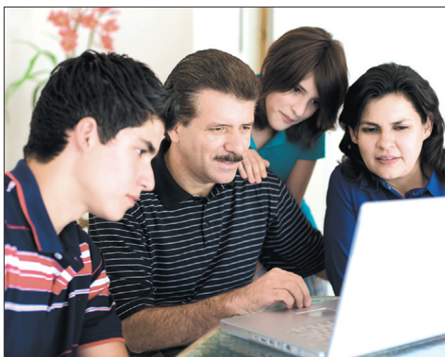
Realizowany przez miasto projekt to okno na świat dla większości jego uczestników.

Kolejnym etapem będzie przeprowadzenie szkoleń dla uczestników, dostarczenie sprzętu komputerowego oraz podłączenie Internetu do go-