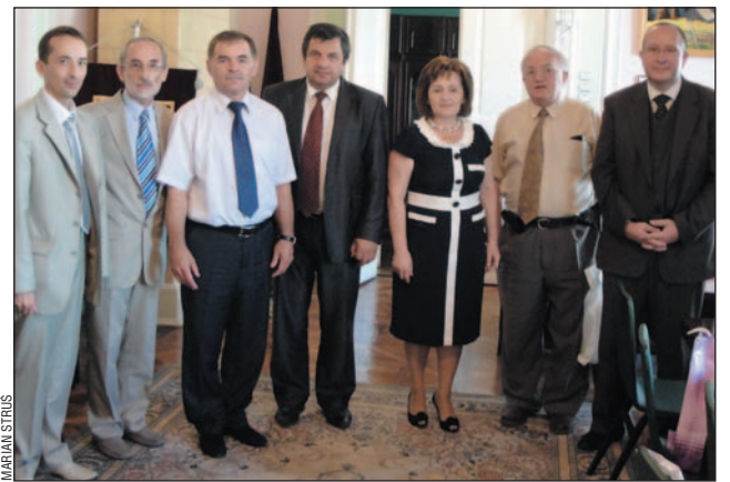
Co przyniesie współpraca Szpitala Specjalistycznego z Uniwersytetem Medycznym w Iwano-Frankowsku? Pamiątkowe wspólne zdjęcie podczas pierwszego spotkania w rektoracie ukraińskiej uczelni.