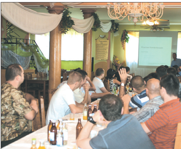
Większość słuchaczy stanowili „kryminalni”.

Ponad 50 funkcjonariuszy policji i straży granicznej z regionu oraz Prokuratury Rejonowej w Sanoku wzięło udział w dwudniowej konferencji poświęconej cyberprzestępczości i zagrożeniom występującym w sieci. Organizator – Komenda Powiatowa Policji w Sanoku – zaprosił do udziału specjalistów, którzy uczyli, jak skutecznie zapobiegać i walczyć z cyberprzestępczością.