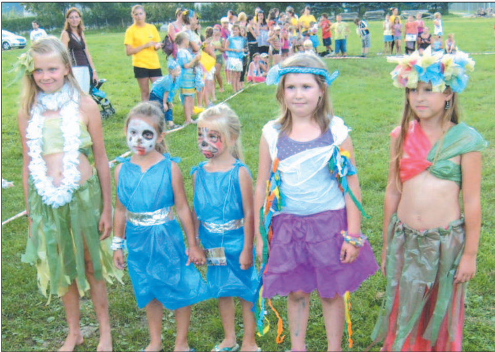
Finałowa impreza Sanockiego Lata Podwórkowego była niezwykle kolorowa. Tym bardziej, że większość dziewczynek paradowała z fantazyjnie pomalowanymi twarzami.

Ostatnie spotkanie wychowawców podwórkowych z podopiecznymi, mimo pożegnalnego charakteru, przebiegało w bardzo radosnej atmosferze. Atrakcją było co niemiara, bo każde podwórko przygotowało własny program. Podczas gry większość chłopców grała w piłkarskim turnieju dzikich drużyn, dziewczęta malowały, skakały przez skakankę, brały udział w konkursie na strój ekologiczny. Były też