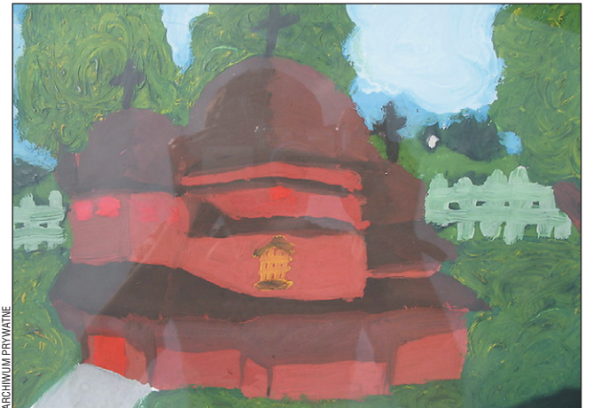
Jedna z konkursowych prac.

Po rozstrzygnięciu konkursu i wyborze 12 zwycięskich prac ich reprodukcje zostaną wydane w postaci pocztówek oraz limitowanych kalendarzy na 2012 rok.