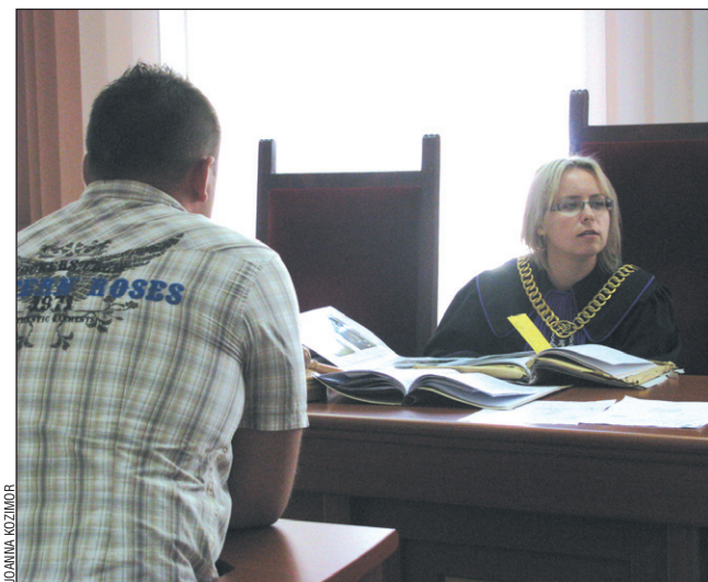
Zdaniem świadka, zepsuty bus stanowił ogromne zagrożenie na drodze, o czym przekonał się osobiście, z najwyższym trudem unikając czołowego zderzenia z omijającym go pojazdem.