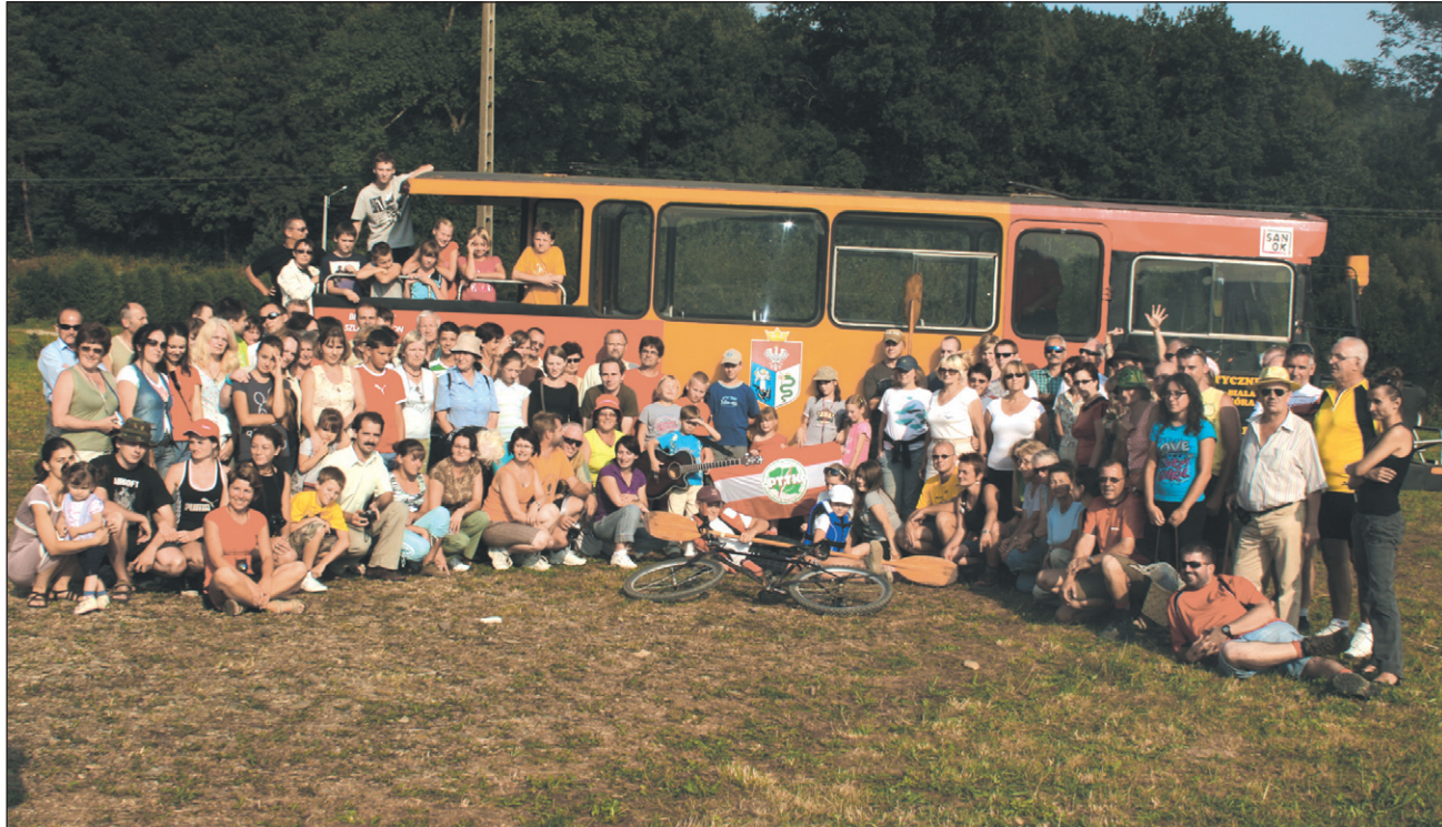
Cały tegoroczny cykl zakończono tak, jak każdą kolejną wycieczkę, czyli wspólnym zdjęciem. Za to jakim – uczestników było tylu, że ledwie mieścili się w kadrze!

czątek jeziora”. Potem były: „Przez Wiechę do Sanoka” (Pasma Wiechy), „W krainie Adama Didura” (Wola Sękowa i okolice), „Zielone wzgórza nad Soliną” (okolice Soliny) i „Doliną Sanu” (Zagórz – Bykowce). Frekwencja nie była jeszcze najwyższa, średnio wycieczki te miały po ok. 40 uczestników, za wyjątkiem tej ostatniej, na którą wybrało się zaledwie 9 osób.