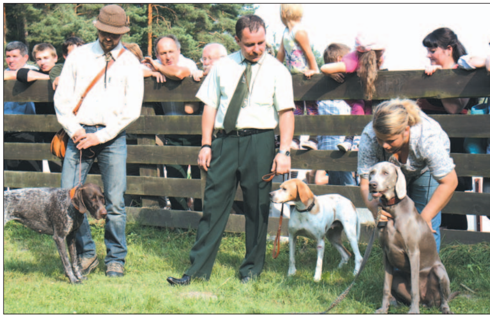
Psy używane do polowań zrobiły podczas XIII Rykwiska prawdziwą furorę. A już poza konkurencją był zwycięzca tego pokazu - wyżeł niemiecki o imieniu „Finka” (pierwszy z lewej) i jego trener. Niesamowite wprost posłuszeństwo w wykonywaniu poleceń i pełny profesjonalizm.

O tym, że nie myśliwskie jadlo i najsmaczniejsze nalewki są najważniejsze na Rykwisku, można było się przekonać w momencie, gdy zapowiedziano pokaz psów używanych do polowań. Wszyscy chcieli zobaczyć, jak zaprezentują się myśliwskie czworonogi. W pokazie wzięło udział kilkanaście psów wielu ras. Dominowały wyżyły – niemiecki, węgier-