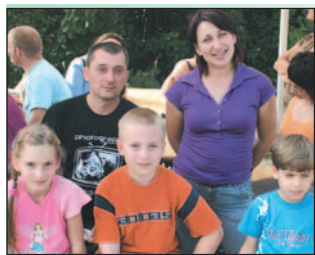
na forma spędzania wolnego czasu.

dziękowania i nagrody, wręczone nie tylko ludziom odpowiedzialnym za organizację imprez. Wyróżnieni zostali także najbardziej aktywni uczestnicy cotygodniowych wycieczek.