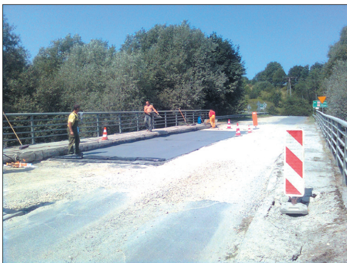
Kostka brukowa znika z drogi powiatowej w Zatużu.

Musieli minąć pół wieku, by mieszkańcy Zatuża w końcu doczekali się zerwania z drogi słynnej kostki brukowej, która spędzała im sen z powiek. Ale lepiej późno niż wcale – prace już trwają, a nowy asfalt ma być gotowy w połowie września.