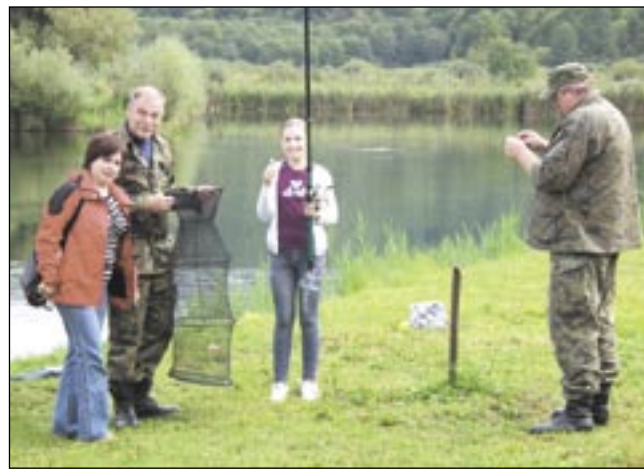
W zawodach „Bezpieczne wędkowanie” udział brali nie tylko chłopcy.

Kursy wędkarskie, organizowane przez Ligę Ochrony Przyrody, zakończono zawodami szałwиковymi pod hasłem „Bezpieczne wędkowanie”. Rozegrane zostały na stawie w „Sosenkach”.