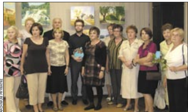
Wernisaż był dla wszystkich twórców wielkim przeżyciem.

Wystawa w „Puchatku” potrwa do 30 września. (jz)