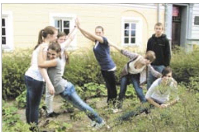
Efekt akcji to m.in. wiele stylizowanych zdjęć.

Tej akcji przyznajemy tygodnikowy znak jakości. Zespół Szkół nr 1 przygotował „grę miejską”, której celem było odszukiwanie miejsc związanych z wybitnym sanoczaninem Zdzisławem Beksińskim.