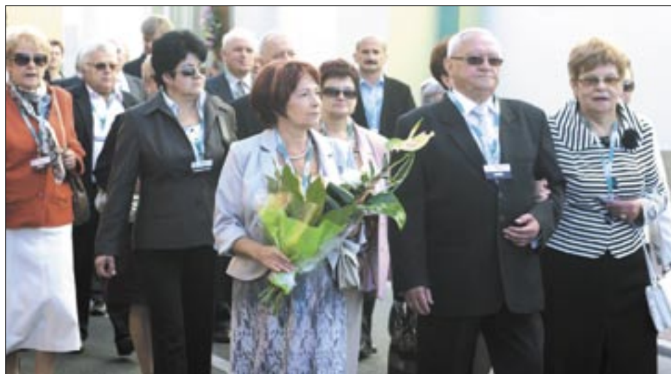
Choć przynależność do Cechu nie jest obowiązkowa, wielu sanockich rzemieślników szanuje dawne prawa i aktywnie działa na rzecz swojego samorządu.

Kondycja rzemiosła ściśle powiązane jest z kondycją gospodarki. Przykładowo, świetnie rozwijające się do niedawna budownictwo, z którym związanych jest 40 procent rzemieślników, w ostatnim czasie mocno podupadło. Ma to związek nie tylko z kryzysem, ale też ograniczeniem ulg i kredytów mieszkaniowych