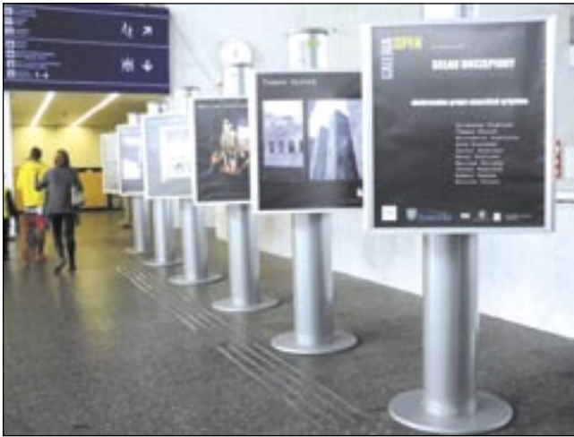
Dworcowy peron galerią sztuki? Dlaczego nie...

„Skład Doczepiony” to kilkunastu malarzy, fotografików i rzeźbiarzy, których łączy wielka potrzeba prezentacji swej twórczości. – „Skład” jest płynny i dynamiczny, nie ograniczamy się liczebnymi czy formalnymi