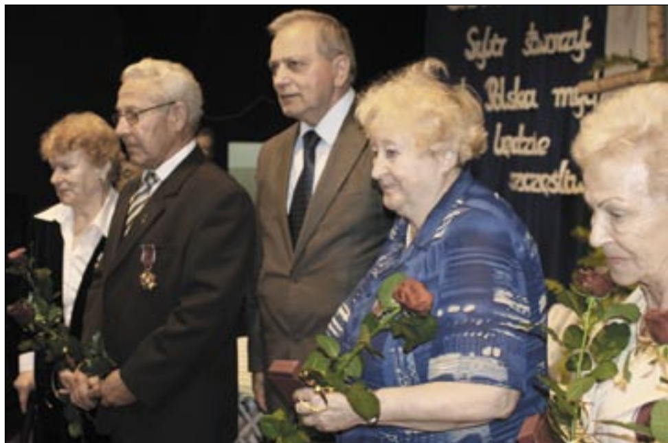
W Polsce żyje jeszcze 50 tys. Sybiraków, a sanockie koło Związku Sybiraków zrzesza 53 osoby. Na zdjęciu – uhonorowanie członków oddziału Złotymi i Srebrnymi Krzyżami Zasługi.

Choć mają po 80-90 lat i coraz mniej sił, wciąż dbają aby nie zginęła pamięć o setkach tysięcy Polek i Polaków, którzy – tak jak oni – doświadczyli piekła pacyfikacji Kresów Wschodnich i masowych deportacji. Większość wywiezionych do północnych regionów Związku Socjalistycznych Republik Radzieckich nie powróciła już do rodzinnego kraju, umierając na nieludzkiej ziemi.