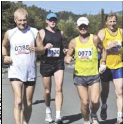
Weterani SGMM na trasie Koral Maraton.