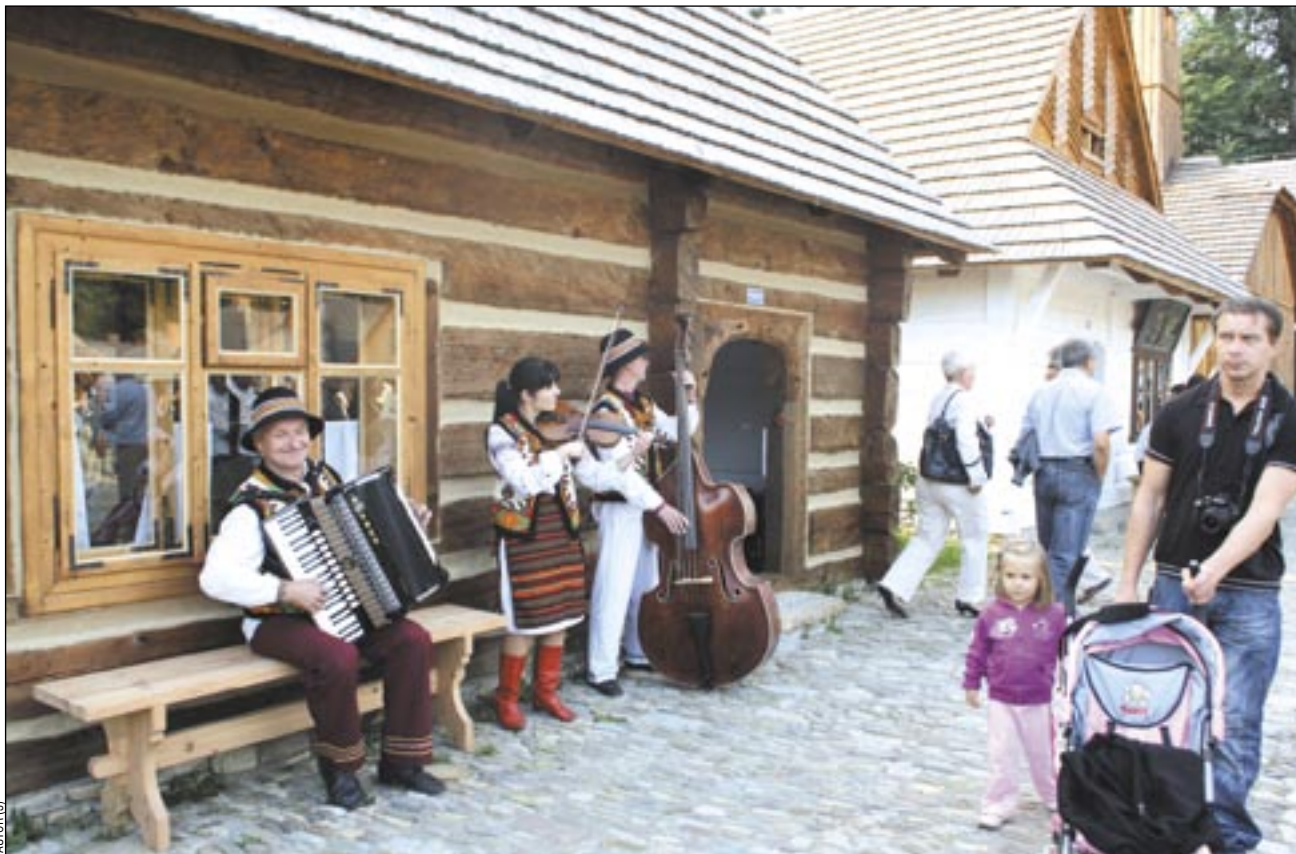
Kapela „Kremenaros” (na zdj.) swoją muzyką wytworzyła klimat idealnie wkomponowujący się w atmosferę miejsca. – Ona powinna tu zostać na stałe, na etacie – mówili zwiedzający.

ślisk, Jaćmierza, Niebylica, Birczy, Rybotycz, Sokołowa Młp., Brzozowa, Starej Wsi i Sanoka. Stanęły także przeniesione oryginalne budynki – dom żydowski z Ustrzyk Dolnych i remiza z Golcowej. Są tu m.in.: karczma, poczta, urząd gminny, apteka, sklep, trafika - monopol, a także warsztaty: kowalski, stolarski, fryzjerski, krawiecki, szewski,