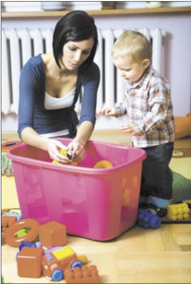
Wreszcie mogą liczyć nie tylko na legalne zatrudnienie, ale i ubezpieczenie.

Składki na ubezpieczenia społeczne (emerytalne, rentowe i wypadkowe) oraz na ubezpieczenie zdrowotne za nianię, która zarabia nie więcej niż wynosi minimalne wynagrodzenie w kraju (obecnie 1386 zł), pokryje ZUS z budżetu państwa. Rodzice pokryją składki w przypadku, gdy pensja niani przekroczy minimalne wynagrodzenie. Opłacą jednak składki tylko od kwoty, o którą pensja przekracza minimalne wynagrodzenie. Jeżeli więc opiekunka w umowie miałaby określoną pensję na poziomie 2 tys. zł,