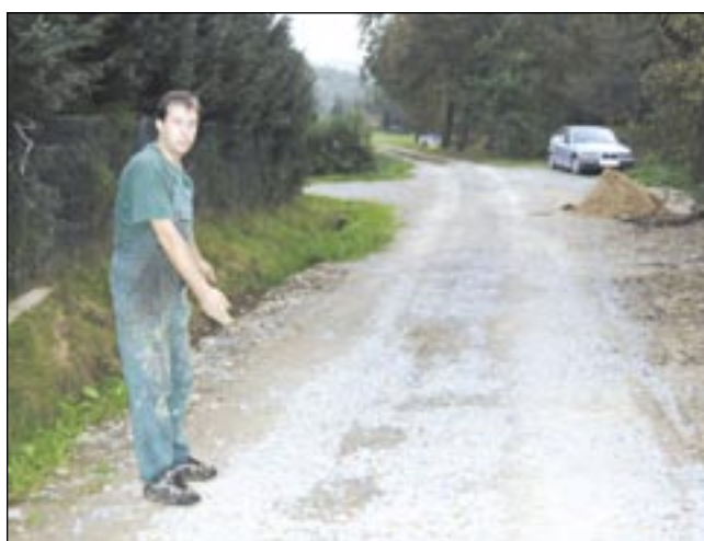
To miejsce było rozkopywane cztery razy w ciągu tygodnia! Tak „fachowcy” budowali tu kanalizację – mówi czytelnik.

– Prace prowadzono chaotycznie, bez jakiegokolwiek planu, raz na początku, raz w środ-