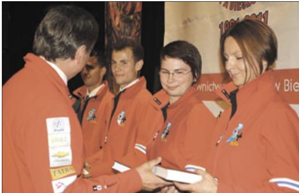
„Świeża krew” sanockiego jubilata. Po trzech latach kandydackiego sprawdzianu wreszcie „pasowanie na ratownika”, czyli złożenie przyrzeczenia ratowniczego. Wśród czwórki składającej je aż dwie kobiety. To więcej niż parytet!