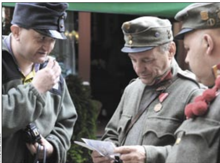
Moment wręczenia ważnego raportu z podpisem Najjaśniejszego Pana.

leotnie zaangażowanie i bohaterką postawę na pierwszej linii frontu przy organizacji Sanockich Spotkań Miłośników Austro-Węgier. Dyplom z nadaniem tytułu „Nadwornego Korespondenta C.k. Monarchii” za 5-letnią bohaterską postawę na pierwszej linii frontu, skąd z narażeniem życia relacjonował wydarzenia z Sanockich Spotkań, otrzymał autor