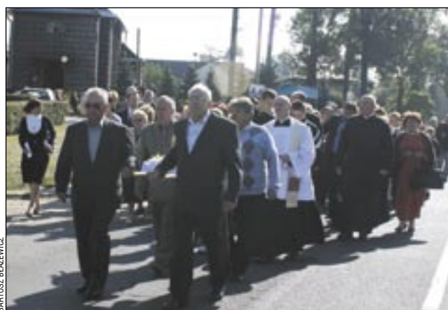
(b) Procesja z relikwiami przeszła od kościoła w Olchowcach do Zakładu Pielęgnacyjno-Opiekuńczego przy ul. Korczaka.

Szczegóły jubileuszu „Albertynów” w następnym numerze.