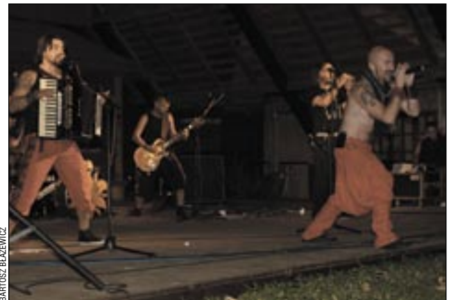
Muzykom grupy HAYDAMAKY nie przeszkadzał nawet przenikliwy chłód.