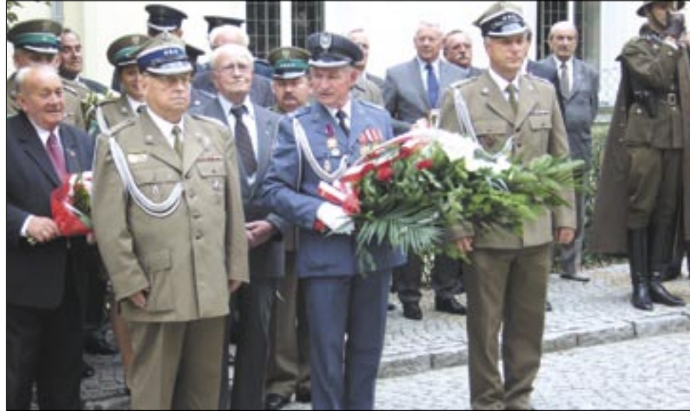
Wiele delegacji, wśród nich delegacja sanockiego koła Związku Żołnierzy Wojska Polskiego oraz współpracujące z nim związki i stowarzyszenia złożyły wiązanki kwiatów pod obeliskiem poświęconym żołnierzom 2 Pułku Strzelców Podhalańskich.

gdzie w okresie międzywojennym mieściły się koszary 2 PSP, wyruszył uroczysty pochód. Największą