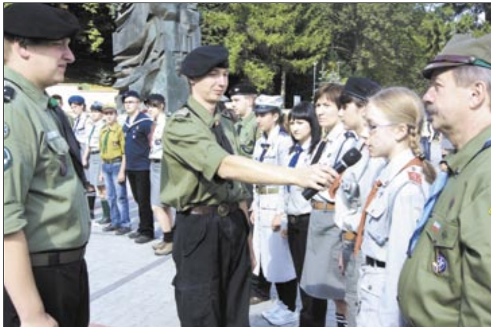
Ludzie z „pierwszej linii frontu” – drużynowi – meldują swoje drużyny podczas apelu na placu, który odąd nosi nazwę „Plac Harcerski”

Pokłońmy się sanockim harcerzom – organizacji, która od stu lat uczy młodych ludzi życia w duchu służby Bogu, Polsce i ludziom, motywuje ich do życia w prawdzie, uczciwości, bez nałogów, zachęca do braterstwa i pogody ducha. Jeśli ktoś nie wierzy, że w naszych czasach to jeszcze „działa”, niech posłucha młodych i sędziwych uczestników Zlotu z okazji Stulecia Sanockiego Harcerstwa, poogląda zdjęcia i wystawy w Domu Harcerza, zajrzy do kronik i programów pracy. Choć świat się zmienia, skautowskie idee wciąż są atrakcyjne dla młodych!