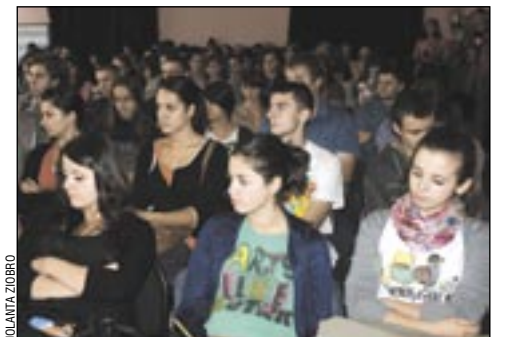
W Polsce 30 procent młodzież nie wie nic o Katyńiu. A politycy wyrzucają historię ze szkół... Na zdjęciu – uczestnicy sesji.

Cisza i skupienie młodych ludzi, którzy z okazji Dnia Podziemnego Państwa Polskiego – święta obchodzonego 27 września, ustanowionego przez Sejm RP w 1998 roku – uczestniczyli w sesji popularnonaukowej, świadczą, że historia jest jednak dla nich ważna.