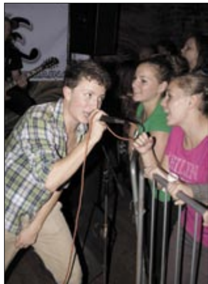
Wokalista grupy JOKE FERAJNA śpiewał razem z publicznością.

Jutro w „Rudercie” zagra metalowy zespół THY DISEASE wraz z supportami. Początek o godz. 19, bilety po 12 zł.