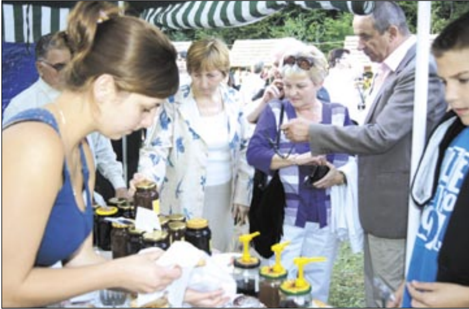
Słodka degustacja – przed zakupem klienci mogli poprzóbować różnych rodzajów miodu. Specjalne stoiki z pompką i talerze z kawałkami wafli stały na każdym stoisku.