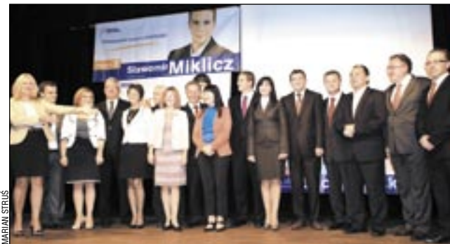
Chcieliby dalej zmieniać Podkarpacie, a zwłaszcza jego południową część. Czy wyborcy powierzą im kontynuowanie tego zadania? Przekonamy się 9 października.

Jak wypadnie reprezentacja PO w wyborach 9 października?